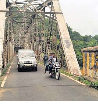
କୂଳ, ପଡ଼ୋଶୀ ଆକ୍ରମଣଦେଶ ଓ ନିକଟସ୍ଥ କୋଲାବ ନଦୀ ଉପରେ ଏହି ଯୋଲ ରହିଛି। ଏହି ଯୋଲ ଦେଇ ଦୈନିକ କୋରାପୁଟ, ନବରଙ୍ଗପୁର, ମାଲକାନଗିରି ଜିଲ୍ଲା, କୋରାପୁଟ ଜିଲ୍ଲାର ଲମତାପୁଟ ଓ ବୈପାରାଗୁଡ଼ା