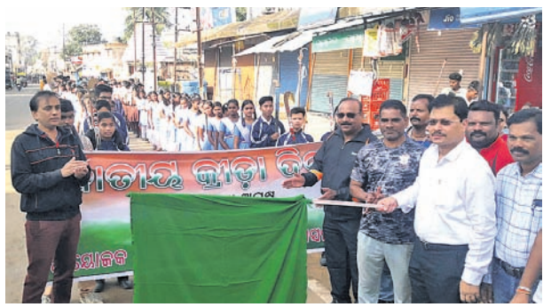
ଜିଲ୍ଲାପାଳ ପତାକା ଦେଖାଇ ଗୋଷାୟାତ୍ରାର ଶୁଭାରମ୍ଭ କରୁଛନ୍ତି ।