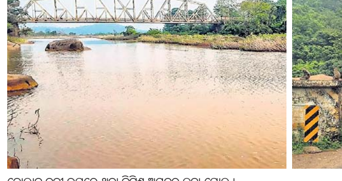
କୋଲାବ ନଦୀ ଉପରେ ଥିବା ବିଚିତ୍ର ଅମଳର ଲୁହା ଯୋଲ।

ବିଚିତ୍ର ଅମଳର ଲୋହନିର୍ମିତ ପାତ୍ରପୁଟ ଯୋଲ। ଏହି ଯୋଲ ଯେଉଁ ରୁଟ୍ରେ ପଡ଼ୁଛି, ତାହା ହେଉଛି କମ୍ପ୍ୟୁଟର-ବୈପାରାଗୁଡ଼ା ରାସ୍ତା। ଏହି ରାସ୍ତା ରାସ୍ତା-ବିକ୍ଷୟାତ୍ମକ କରିବାର ଅଂଶ ଭାବେ ୩୨୬ ନଂ ଜାତୀୟ ରାଜପଥରେ ଆସୁଛି। ଏହି ରାସ୍ତାଦେଇ ଦୈନିକ ହଜାର ହଜାର ଯାନବାହାନ ଚଳାଚଳ କରୁଥିବା ବେଳେ ଏହି ପାତ୍ରପୁଟ ଯୋଲରେ ହିଁ ଟ୍ରାଫିକ୍ ସମସ୍ୟାରେ ଫସୁଛନ୍ତି। ରାସ୍ତା-ବିକ୍ଷୟାତ୍ମକ କରିବାର କମ୍ପ୍ୟୁଟର ମୋଟୁ ପର୍ଯ୍ୟନ୍ତ ରାସ୍ତାକୁ ୩୨୬ ନମ୍ବର ଜାତୀୟ ରାଜପଥ ବୋଲି ଘୋଷଣା କରାଯାଇଛି। ଏହି କରିବାର ଭିତରେ ଆସୁଥିବା କମ୍ପ୍ୟୁଟର-