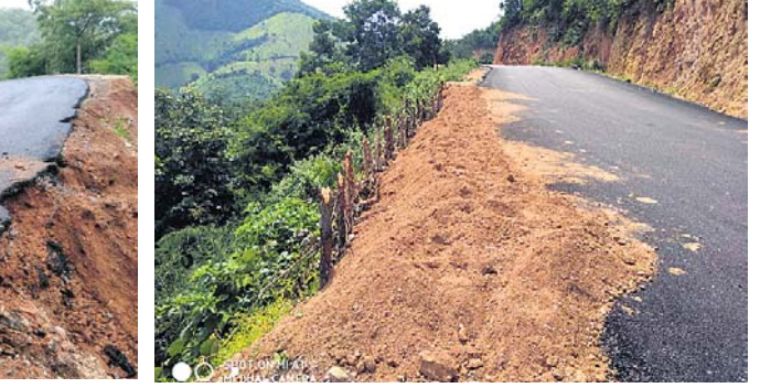
ଖବର ପ୍ରକାଶ ପରେ ରାସ୍ତାପାର୍ଶ୍ୱର ମରାମତି କରାଯାଇଛି।