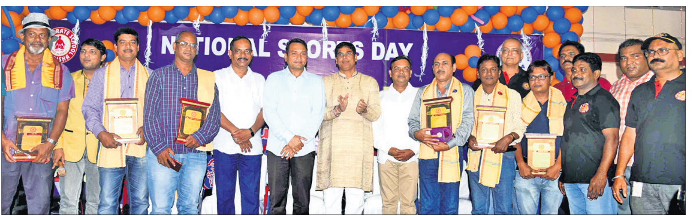
ଉତ୍କଳ କରାଟେ ଷ୍ଟୁଲର ପ୍ରତିଷ୍ଠା ଦିବସରେ ଗୁରୁତ୍ୱପୂର୍ଣ୍ଣ କ୍ରୀଡ଼ା ଖବରଦାତାମାନେ ଅତିଥି ଓ କର୍ମଚାରୀଙ୍କ ସହ।