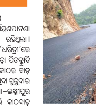
ଖବର ପୂର୍ବରୁ ଘାଟି ରାସ୍ତା।

କୋରାପୁଟ, ୨୯୮୮ (ସ.ପ୍ର.) କୋରାପୁଟ ଜିଲ୍ଲା ଲକ୍ଷ୍ମୀପୁର-ନାରାୟଣପାଟଣା ଘାଟିରାସ୍ତା ବିପଦସଙ୍କୁଳ ଅବସ୍ଥାରେ ରହିଥିଲା। ଏନେଇ ଗତ ମାସ ୨୯ ତାରିଖରେ 'ଧରତ୍ରୀ'ରେ ଖବର ପ୍ରକାଶ ପାଇବା ପରେ ସୁନାବେଡ଼ା ପିଡ଼କୁଡି ବିଭାଗ ସେହି ସ୍ଥାନରୁ ଗୁରୁତ୍ୱପୂର୍ଣ୍ଣ କାର୍ଯ୍ୟକ୍ରମ କାର୍ଯ୍ୟ କରି ସେଥିରେ ମାଟି ପ୍ୟାକିଂ କରିଥିବା ଗୁରୁବାର ଦେଖିବାକୁ ମିଳିଛି। ନାରାୟଣପାଟଣା-ଲକ୍ଷ୍ମୀପୁର ରାସ୍ତାର ପ୍ରାୟ ୮୫ ମିଲିମିଟର ଏପରି କାଠବାଡ଼ ନିର୍ମାଣ କରାଯାଇଥିବା ବିଭାଗୀୟ ସମ୍ପ୍ରା କହିଛନ୍ତି।