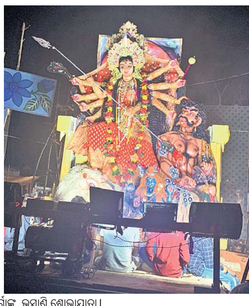
ପାପଦାହାଣ୍ଡିଠାରେ ମା' ଦୁର୍ଗାଙ୍କ ଭବ୍ୟ ଶୋଭାଯାତ୍ରା ।