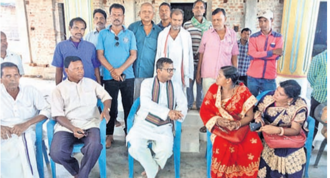
ଏମ୍ପି ସ୍ଥାନୀୟ ଲୋକଙ୍କ ସହ ଆଲୋଚନା କରୁଛନ୍ତି ।

ପଦ୍ମପୁର, ୯।୧୦(ଡି.ଏନ୍.ଏ.) କୋରାପୁଟ ଏମ୍ପି ସପ୍ତଗିରି ଉଲ୍ଲାସ ରୁପଦାର ପଦ୍ମପୁର ଗସ୍ତରେ ଆସି ସ୍ଥାନୀୟ ଅଞ୍ଚଳ ଲୋକଙ୍କ ସହ ସେମାନଙ୍କ ସୁବିଧା ଅନୁବିଧା ନେଇ ଆଲୋଚନା କରିଛନ୍ତି ।