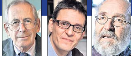
ଜେମ୍ସ ପିବ୍ଲସ୍, ଡିଡିଏର କୁଏଲୋଜ୍, ମିଚେଲ୍ ମେୟର