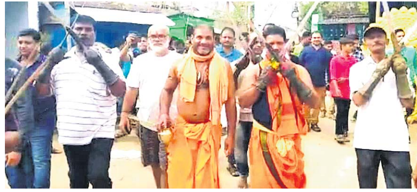
ପୂଜାର୍ଚନା ପରେ ଖଣ୍ଡାଗୁଡ଼ିକୁ ନଗର ପରିକ୍ରମା କରାଯାଇଛି ।