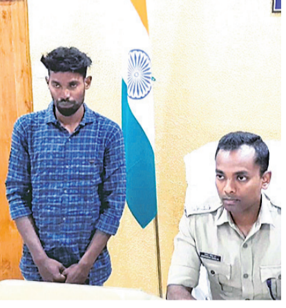
ଏମ୍ପିଙ୍କ ସହ ଅଭିଯୋଗ ଅଗ୍ରଣି ।

ହିନ୍ଦୁ ଦେବଦେବୀଙ୍କ ଫଟୋ ପୋଡ଼ିବା ଅଭିଯୋଗରେ ରାୟଗଡ଼ା ପୋଲିସ୍ ମଜକଦାର ତିନି ଥାନା ଅଧୀନ ପାଞ୍ଚାଳି ଗାଁର ଅଭିଯୋଗରେ ଗିରଫ କରିଛନ୍ତି ।