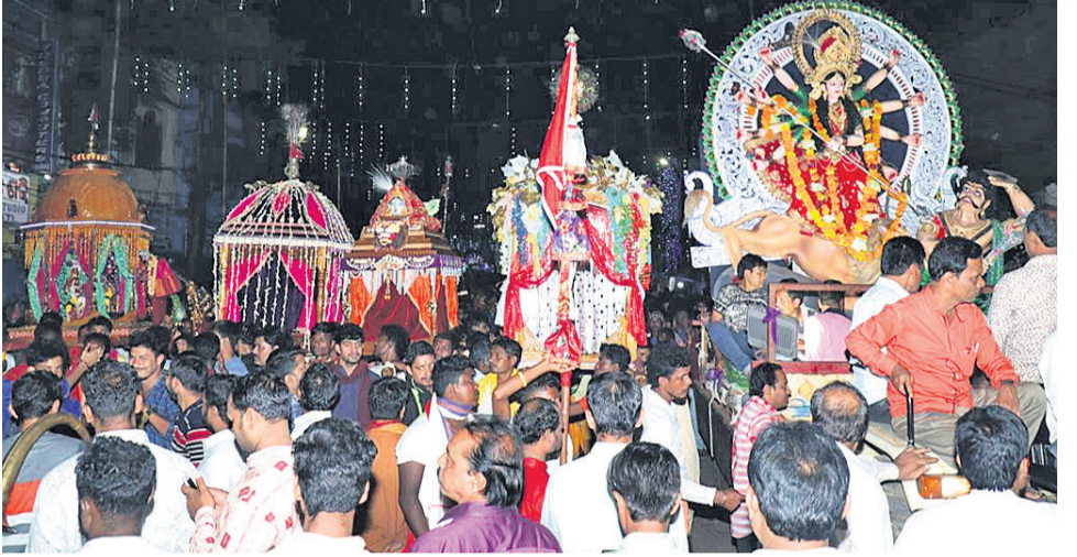
କନ୍ୟାପୁର ଦଶହରାରେ ଦେବୀ ମାଙ୍କୁ ଶୋଭାଯାତ୍ରାରେ ନିଆଯାଇଛି ।