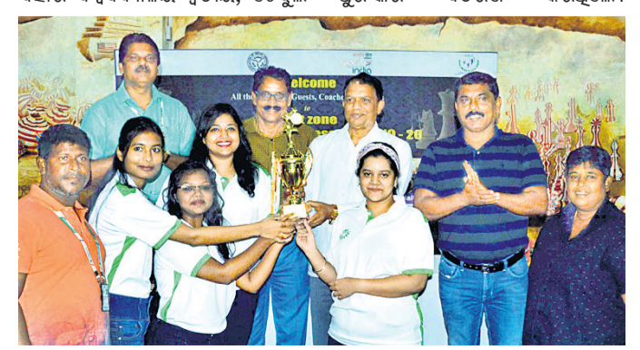
ମହିଳା ଟେଷ୍ଟରେ ରନର୍ସଅପ୍ କିଂ ଦଳର ଖେଳାଳିମାନେ ଅଧିକ୍ଷକଠାରୁ ପୁରସ୍କାର ନେଇଛନ୍ତି।

ଟେନିସର ପୁରୁଷ ବିଭାଗରେ ନର୍ଥ ବେଙ୍ଗାଲ ବିଶ୍ୱବିଦ୍ୟାଳୟ ଚାମ୍ପିୟନ ଓ ସୁନିଭର୍ସିଟି ଅଫ୍ କୋଲକାତା ରନର୍ସଅପ୍, ମହିଳା ବିଭାଗରେ ସୁନିଭର୍ସିଟି ଅଫ୍ କୋଲକାତା ଚାମ୍ପିୟନ, ନର୍ଥ ବେଙ୍ଗାଲ ବିଶ୍ୱବିଦ୍ୟାଳୟ ରନର୍ସଅପ୍ ଏବଂ ଭଲିବଲ୍ରେ ପଞ୍ଜାବ ବିଶ୍ୱବିଦ୍ୟାଳୟ ଚାମ୍ପିୟନ ଓ ବାରାଗସୀର ମହାତ୍ମାଗାନ୍ଧୀ କାଶୀ ବିଦ୍ୟାପୀଠ ରନର୍ସଅପ୍ ହୋଇଛି।