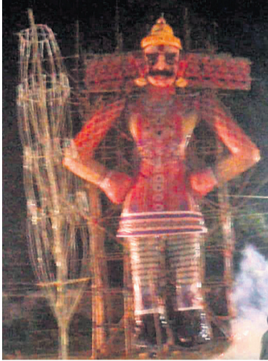
କନ୍ୟାପୁରରେ ରାବଣପୋଡ଼ି ।