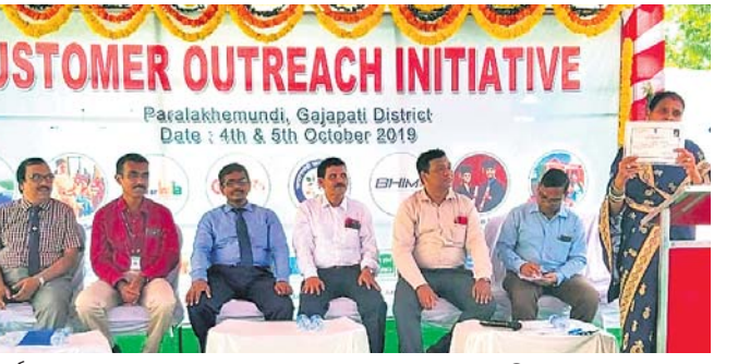
କାର୍ଯ୍ୟକ୍ରମରେ ମଞ୍ଚାସୀନ ଅନ୍ତର୍ଗତ ବ୍ୟାଙ୍କ ଅଧିକାରୀ, ଅଗ୍ରଣୀ ବ୍ୟାଙ୍କ ପରିଚାଳକ ଓ ଅନ୍ୟମାନେ ।