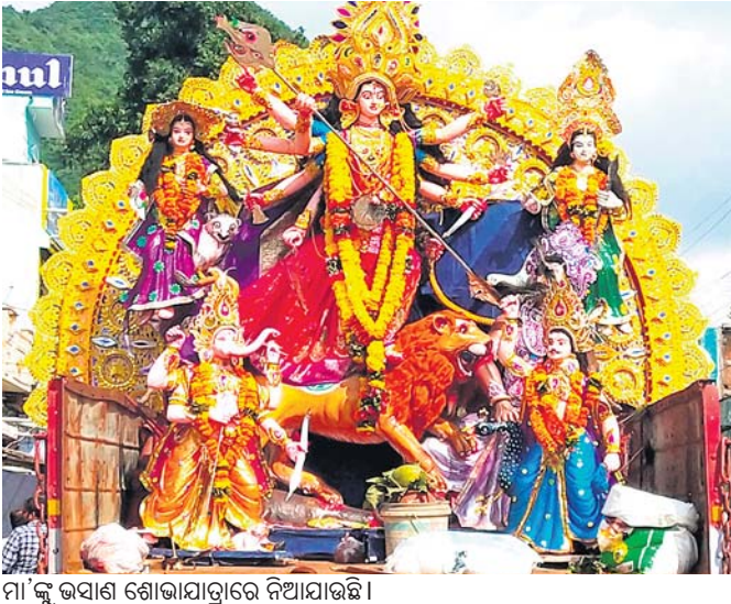
ମା'ଙ୍କୁ ଭଜାଣ ଶୋଭାଯାତ୍ରାରେ ନିଆଯାଇଛି ।