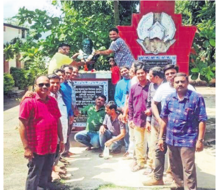
ଗୋପବନ୍ଧୁଙ୍କ ପ୍ରତିମୂର୍ତ୍ତି ନିକଟରେ ଶ୍ରଦ୍ଧାଘୃଣନ ଅର୍ପଣ କରାଯାଇଛି ।

ଗୁଣପୁର, ୯।୧୦(ଡି.ଏନ୍.ଏ.) ଗୁଣପୁରରେ ଗୋପବନ୍ଧୁଙ୍କ ଜୟନ୍ତୀ ଅବସରରେ ବିଭିନ୍ନ ସ୍ଥାନରେ 'ସେବା ଦିବସ' ପାଳନ କରାଯାଇଛି ।