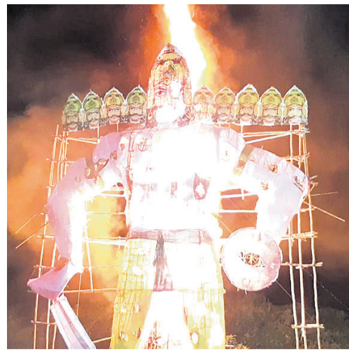
ରାୟଗଡ଼ା ଓ କେବେପୂରରେ ଅନୁଷ୍ଠିତ ରାବଣପୋଡ଼ି ।