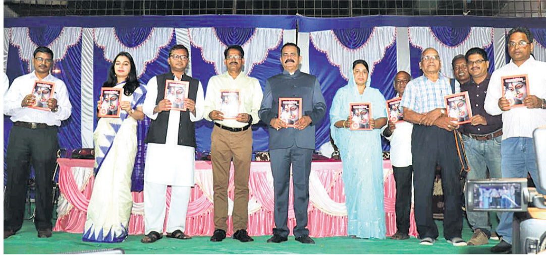
କନ୍ୟାପୁର ଦଶହରା ପଡ଼ିଆ ମଞ୍ଚରେ ବାର୍ଷିକ କ ପତ୍ରିକା 'ଅପରାଜିତା'କୁ ଅତିଥିମାନେ ଉନ୍ମୋଚନ କରୁଛନ୍ତି ।