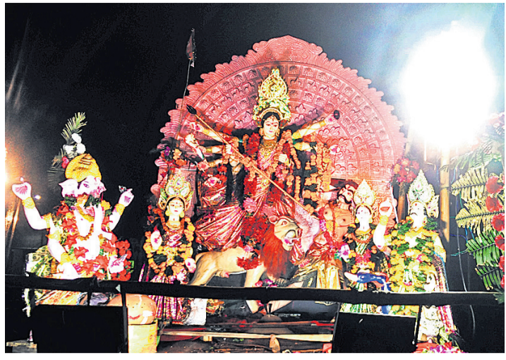
ତିନିଦିନେ ମାଙ୍କ ଭାସଣୀ ଶୋଭାଯାତ୍ରା ।