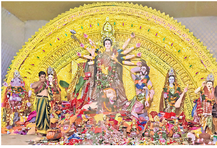
କେବେପୂରରେ ମାଙ୍କ ମୁଖ୍ୟ ମୂର୍ତ୍ତିକୁ ପୂଜା କରାଯାଇଛି ।