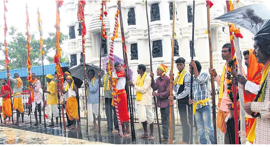
ଶାରଦୀୟ ଶ୍ରୀକ୍ଷେତ୍ରରେ ଏକାଠି ହୋଇଥିବା ପ୍ରତୀକ ଲାଠି ।

ଜୟପୁର ମହାରାଜଙ୍କ ଅମଳକୁ ଆଦିବାସୀମାନେ ଲାଠିଯାତ୍ରା ପାଳିଆଣୁଛନ୍ତି। କିନ୍ତୁ ଜୟପୁର ରାଜ୍ୟ ଦେହାନ୍ତ ପରେ ଗ୍ରାମ ନାୟକମାନେ ଲାଠି ଧରି ଜୟପୁର ନ ଯାଇ କୋରାପୁଟ ଶାରଦୀୟ ଶ୍ରୀକ୍ଷେତ୍ରରେ ମା' ବିନାମଙ୍କ ପାଖରେ ପୂଜାର୍ଚ୍ଚନା କରି ଦଶହରା ପାଳୁଛନ୍ତି। ମଙ୍ଗଳବାର ସ୍ଥାନୀୟ ଶାରଦୀୟ ଶ୍ରୀକ୍ଷେତ୍ରର ନିର୍ବାହୀମାନେ ଆଦିବାସୀଙ୍କ ଲାଠିଯାତ୍ରା ଉପରେ ଅନୁଷ୍ଠିତ ହୋଇଛି। ଏଥିରେ କୋରାପୁଟ ସହର ଓ ଆଖପାଖ ଖେରୁଡ଼ା, ବଦଳିକୁଡ଼ା, କମାରକୋଡ଼ା, ଲଙ୍କାପୁଟ, ଛପର, ରଜବାଲିକୁଣ୍ଡା ଗ୍ରାମର ୨୦ରୁ ଅଧିକ ଲାଠିଆରୀଙ୍କୁ ଗ୍ରାମ ପୂଜକ ନିର୍ବାହୀମାନେ ଆଣି ସେଠାରେ ପୂଜାର୍ଚ୍ଚନା କରିଥିଲେ। ପରେ ଶାରଦୀୟ ଶ୍ରୀକ୍ଷେତ୍ରରୁ ଅଣାଯାଇ ମା' ବିନାମଙ୍କ ପାଖରେ ପୂଜା କରାଯାଇଥିଲା। ଶାରଦୀୟ ଶ୍ରୀକ୍ଷେତ୍ରର ଅଧ୍ୟାପକ ଡକ୍ଟର ସହର ପରିକ୍ରମା କରିଥିଲେ। ଶେଷରେ ଶାରଦୀୟ ଶ୍ରୀକ୍ଷେତ୍ରର ଗ୍ରାମପଦେବୀ ନିର୍ବାହୀମାନେ ଲାଠିଆରୀଙ୍କୁ ସାଗର କରାଯାଇ ଶିରୋପା