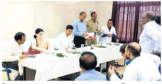
ଜିଲ୍ଲା ସ୍ୱାସ୍ଥ୍ୟସେବା ନେଇ ଅଧିକାରୀମାନେ ଆଲୋଚନା କରୁଛନ୍ତି।