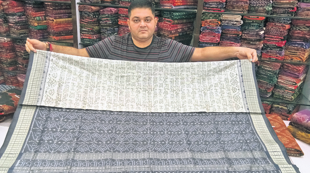
ବାନ୍ଧବିନୀ ମା ଶାକ୍ତି ପ୍ରବର୍ତ୍ତନ କରୁଛନ୍ତି।