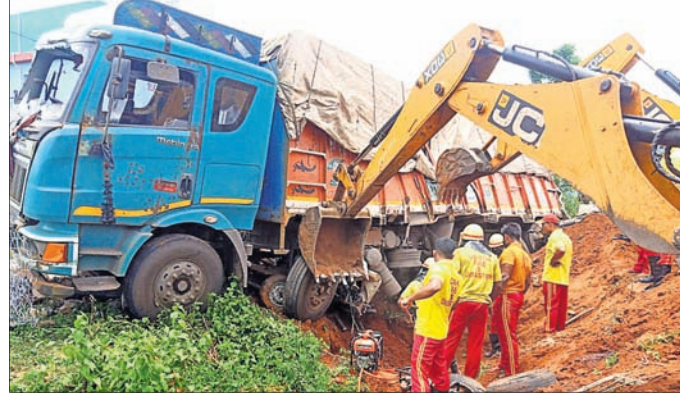
ଅଶ୍ୱିନୀ ବାହିନୀ ଟ୍ରକ୍ ତଳେ ଧସିଥିବା ଲୋକଙ୍କୁ ଉଦ୍ଧାର କରିବାକୁ ଉଦ୍ୟମ ଚଳାଇଛି