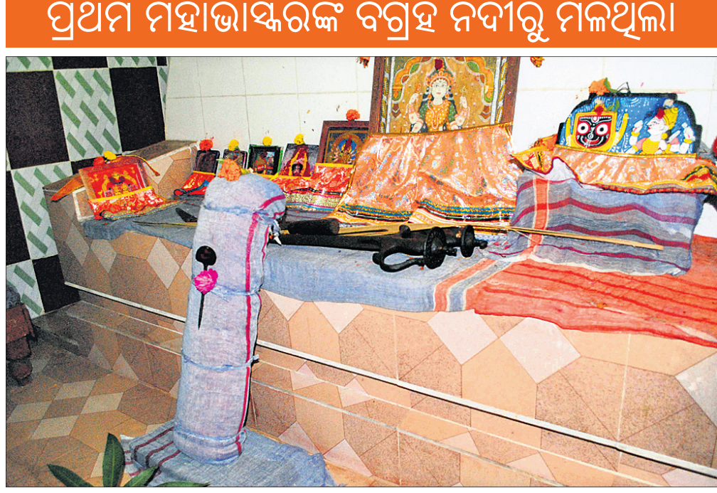
ପୂଜା ପାଉଥିବା ମାଦଳାପାଞ୍ଜି।

ବିଚାର ପ୍ରାୟ ବାହିନୀ କରିଗଲେ ଗାହାର ଅଭିପ୍ରାୟ ଅଜଣା ନୁହେଁ। ଅନ୍ୟତମ ଗୌରବମୟ ଏତିହ୍ୟକୁ ଗୋଳମାଳିଆ କରି ଛୋଟ କରି ଦେଖାଇଲେ ନିଜର ଆଲୋଚକପଣିଆ କାହିଁକି କରିହେବ।