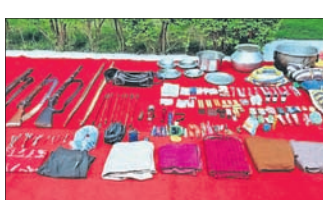
ମାଲକାନଗିରି, ୨୦୧୬(ଡି.ଏନ.ଏ.): ମାଲକାନଗିରି ଜିଲା ସାମଗ୍ରୀ ସେକ୍ଟରର ନାରାୟଣପୁର ଜିଲା ଅନ୍ତର୍ଗତ ଆର୍ଦ୍ଧା ଜଙ୍ଗଲରେ ଶନିବାର ଅପରାହ୍ନରେ ପୋଲିସ-ମାତ୍ରାବାଦୀଙ୍କ ମଧ୍ୟରେ ଗୁଳି ବିନିମୟ ଘଟିଛି।

ପୂର୍ବରୁ ଏହି ପ୍ରସ୍ (୧୫୩୩୧୧)ରେ ତୀର୍ଥକ୍ଷେତ୍ର ବିକ୍ରୟ ଉପସ୍ଥାପନ ପ୍ରାଥମିକ ଅବସ୍ଥାରେ ପାଇଁ ଉଦ୍ଦେଶ୍ୟ ଥିଲା।