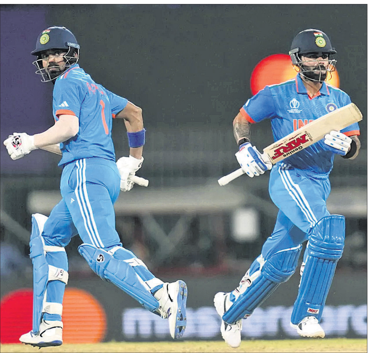
ଡେନିସ୍‌ରେ ରବିବାର ଅନୁଷ୍ଠିତ ଦିନିକିଆ କ୍ରିକେଟ ବିଶ୍ୱକପର ଅଷ୍ଟ୍ରେଲିଆ ବିପକ୍ଷ ମ୍ୟାଚରେ ଶତକାନ୍ଦ ଭାଗ୍ୟବାନ ଅବସରରେ ଲୋକେଶ ରାୟୁଲ ଓ ବିରାଟ କୋହଲି। (ରିପୋର୍ଟ: ଖେଳପୃଷ୍ଠା)

ବଲିଉଡ୍ ବେବୋ କରିନା କପୁର ହାଜିରାରେ ତାଙ୍କ ଆଗାମୀ ଫିଲ୍ମ 'ସିଙ୍ଗଲ୍ ଏଗେନ'ର ଶୁଟିଂ ଆରମ୍ଭ କରିଥିବା ନେଇ ଏକ ଫଟୋ ଶେୟାର କରିଛନ୍ତି।