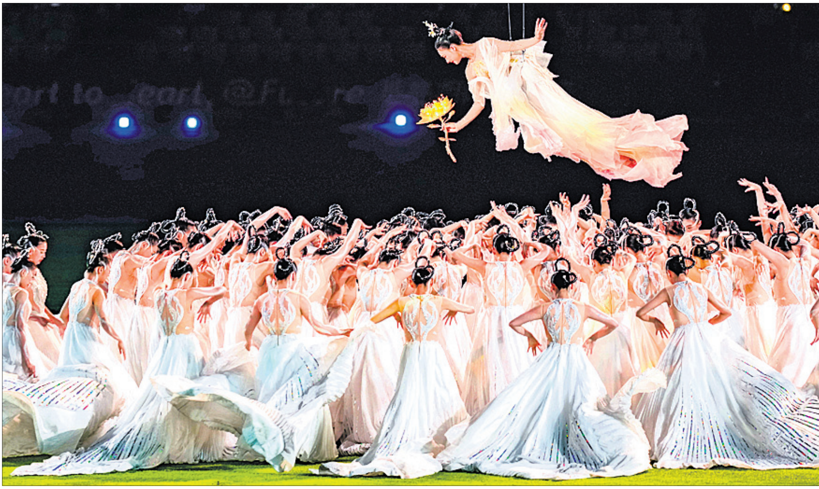
ଏସିଆନ୍ ଗେମ୍ସ ଉଦ୍‌ଯାପନା ଉତ୍ସବରେ କଳାକାରମାନେ ନୃତ୍ୟ ପରିବେଷଣ କରୁଛନ୍ତି।

ହାଙ୍ଗକୋ, ୮୧୦(ପି.ଟି.): ଗାନ୍ଧୀ ହାଙ୍ଗକୋରେ ଅନୁଷ୍ଠିତ ଏସିଆନ୍ ଗେମ୍ସ ଲାଲଟ ଓ ସାଉଥ ଖୋରେ ଲାଲଟ କାର୍ଯ୍ୟକ୍ରମରେ ଉଦ୍‌ଯାପିତ ହୋଇଛି।