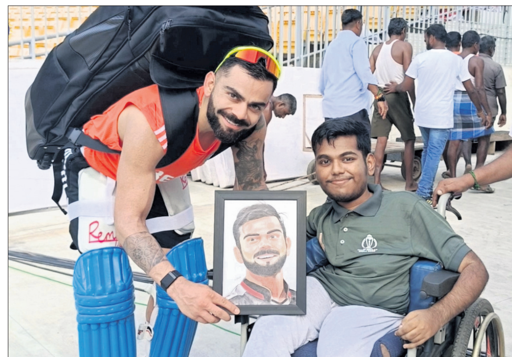
ଜଣେ ବିଦ୍ୟାର୍ଥୀଙ୍କୁ ପାଠ୍ୟପୁସ୍ତକ ଦେବା ପାଇଁ ଭାରତୀୟ ବିଶ୍ୱକପ ଶେଷରେ କୋହଲି।

୧୨: କପିଳ ଦେବ ୧୨: ସଚିନ ଚେନ୍ନାଇକର ଦ୍ରୁତ ୧୦୦୦ ରନ ଡେଭିଡ୍ ଓର୍ନର: ୧୯ ମ୍ୟାଚ* ସଚିନ ଚେନ୍ନାଇକର/ଏବି ଡିଭିଲିର୍ସ: ୨୦ ଭିକ୍ ରିଚାର୍ଡ୍/ସୌରଭ ଗାଙ୍ଗୁଲି: ୨୧ ମାର୍କ ଓ୍ଵ: ୨୨ ହର୍ଷେଲ ଗିର୍: ୨୨ ଅଷ୍ଟ୍ରେଲିୟଙ୍କ ସର୍ବାଧିକ ରନ ରିକି ପଂଟି: ୧୭୪୩ ଆତାମ ରିଲିକ୍ସ: ୧୦୮୫ ମାର୍କ ଓ୍ଵ: ୧୦୦୪ ଡେଭିଡ୍ ଓର୍ନର: ୧୦୦୧* ମାଥ୍ୟୁ ହେଡେନ-୯୮୭