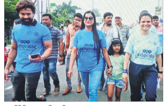
ରାହାଗିରି ଦିବସରେ ଏସ୍ପି ସାଗରିକା ନାଥ ଓ ଅନ୍ୟମାନେ।

ବାଲେଶ୍ୱର ସହରରେ ପ୍ରଥମଥର ପାଇଁ ରାହାଗିରି ଦିବସ ଅନୁଷ୍ଠିତ ହୋଇଛି।