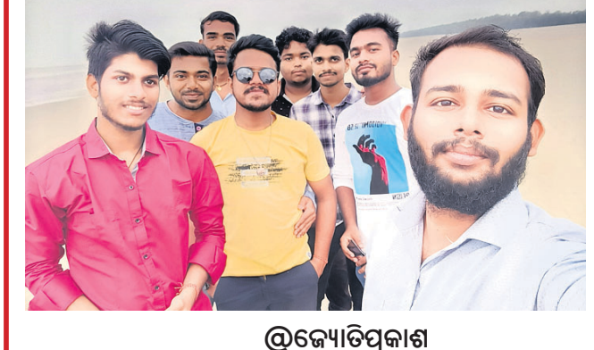
ଓକ୍ୟୋଡିପ୍ରକାଶ ସେଲ୍ଫି ସହ ନିଜର ନାମ ଓ ଫୋବାଇଲ୍ ନମ୍ବର ଉଲ୍ଲେଖ କରନ୍ତୁ।