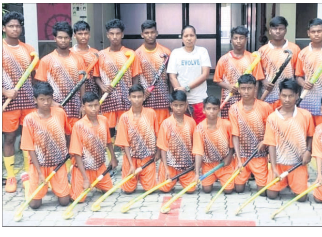
ବରିପଦା, ୮।୧୦(ନାକିତ୍ର ବିହାରୀ ଦଣ୍ଡପାଟ)

ଜୁନିୟର ବାଲକ ହକି ଚାମ୍ପିୟନଶିପ୍ରେ ମୟୂରଭଞ୍ଜ ଦଳ ଉପରେ ଉପସ୍ଥାପନ କରାଯାଇଛି।