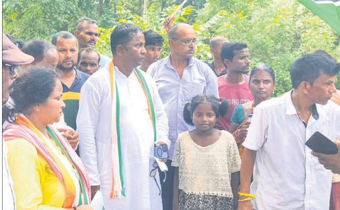
ଘରେ ଘରେ ହାତ କାର୍ଯ୍ୟକ୍ରମରେ କଂଗ୍ରେସ ନେତା ଓ କର୍ମୀ।

ଘରେ ଘରେ ହାତ କାର୍ଯ୍ୟକ୍ରମରେ କଂଗ୍ରେସ ନେତା ଓ କର୍ମୀ ଯୋଗ ଦେଇଛନ୍ତି।