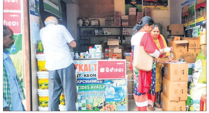
କୃଷିଜାତୀୟ ସାମଗ୍ରୀ ବିକ୍ରି ଦୋକାନରେ ସହକାରୀ କୃଷି ଅଧିକାରୀ ଯାଞ୍ଚ କରୁଛନ୍ତି।

ରଖୁଆ, ୮।୧୦(ମହେଶ୍ୱର ଦାସ) ସରକାରଙ୍କ ଦ୍ୱାରା ପାରାକ୍ୱେଟ୍ (ଘାସ ମରା ଔଷଧ) ବିକ୍ରି ଉପରେ କଟକଣା ଲାଗିବା ପରେ ରଖୁଆ କୃଷି ବିଭାଗ କରାଯାଇଛି।