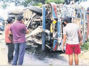
ଭଦ୍ରକ, ୮।୧୦(ସମ୍ବାଦନ ରାଉତ)- ୧୬ ନଂ. ଜାତୀୟ ରାଜପଥର ଭଦ୍ରକ ଚରଣାଠାରେ ରବିବାର ପୂର୍ବାହ୍ନରେ ଓଡ଼ିଶା ଟ୍ରିକରୁ ଏକ ଟ୍ରକ ଖସିପଡ଼ିଲା। ଟ୍ରକ ଚଳି ଏକ ବାଲକ ଚାପି ହୋଇ ଯାଇଥିବା ବେଳେ ଯୋଗାଣନା କର୍ମୀଙ୍କୁ ମଧ୍ୟ ଆଘାତ ଘଟିଥିଲା।

ଓଡ଼ିଶା ଟ୍ରିକରୁ ଖସିପଡ଼ିଲା ଟ୍ରକ ଚାପି ହୋଇଗଲା ବାଲକ