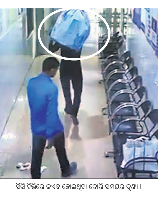
ସିସି ଟିଭିରେ କଏଦ ହୋଇଥିବା ଚୋରି ସମୟର ଦୃଶ୍ୟ ।