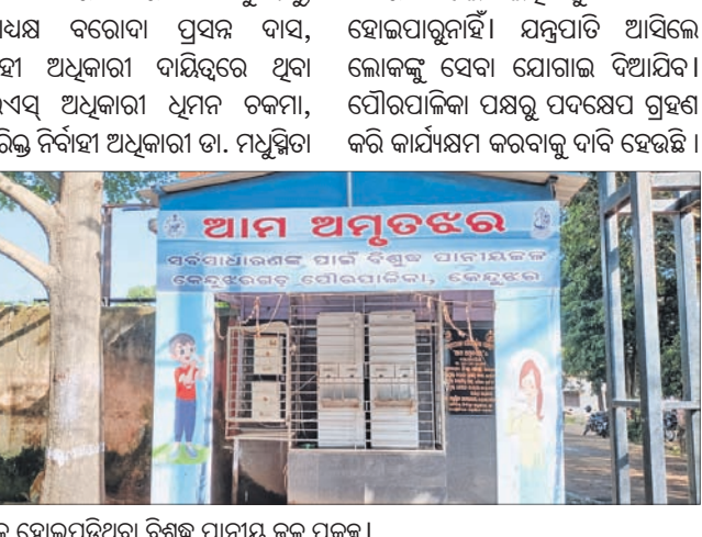
ଅଟକ ହୋଇପଡ଼ିଥିବା ବିଶୁଦ୍ଧ ପାନୀୟ ଜଳ ପ୍ରକଳ୍ପ।

କେନ୍ଦୁଝର, ୧୮।୧୦ (ନରେଶ ଚନ୍ଦ୍ର ପଟ୍ଟନାୟକ) କେନ୍ଦୁଝର ଜିଲ୍ଲା ପୌରପାଳିକା ପକ୍ଷରୁ କାର୍ଯ୍ୟାଳୟ ସମ୍ପୂର୍ଣ୍ଣ ସର୍ବସାଧାରଣଙ୍କୁ ବିଶୁଦ୍ଧ ପାନୀୟ ଜଳ ଯୋଗାଇବା ଲକ୍ଷ୍ୟରେ ପ୍ରତିଷ୍ଠା ହୋଇଥିବା 'ଆମ ଅନୁତଞ୍ଜର' କାମରେ ଲାଗୁନାହିଁ।