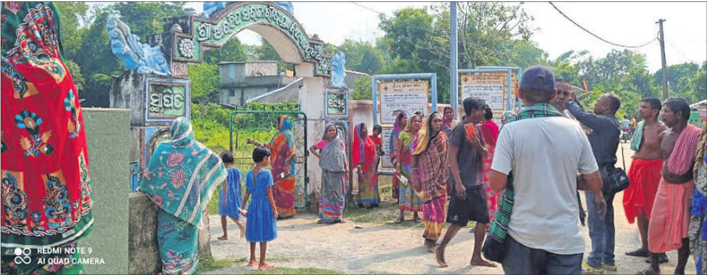
ସ୍କୁଲ ଆଗରେ ଅଭିଭାବକ ଓ ଗ୍ରାମବାସୀ ପ୍ରତିବାଦ କରୁଛନ୍ତି।

ଐପଦା ବ୍ଲକ୍ ବଡ଼ପୋଖରୀ ପଞ୍ଚାୟତ ବଧୂ ଗ୍ରାମର ଶ୍ରୀ ଅରବିନ୍ଦ ସରକାରୀ ଉଚ୍ଚ ପ୍ରାଥମିକ ବିଦ୍ୟାଳୟର ପ୍ରଧାନଶିକ୍ଷକ ଜଣେ ଚୂଡ଼ା ଶ୍ରୀମତୀ ଛାତ୍ରୀଙ୍କୁ ମାତୃ ମାରିବା ନେଇ ଗ୍ରାମବାସୀ, ଅଭିଭାବକ ଓ ପରିଚାଳନା କମିଟି ସଭ୍ୟାସଭ୍ୟାମାନେ ସ୍କୁଲ ଆଗରେ ପ୍ରତିବାଦ କରିଥିଲେ।