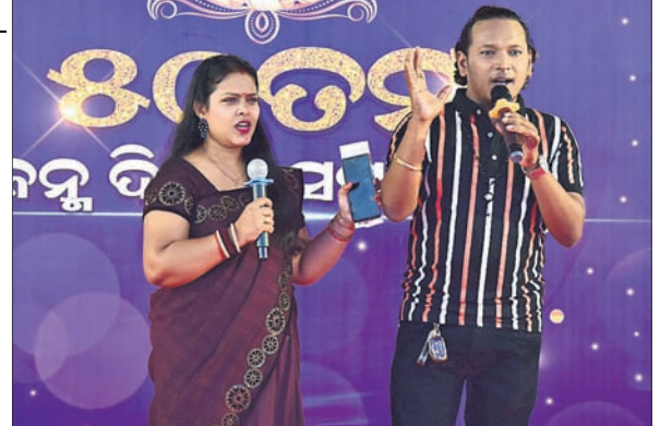
ସାଂସ୍କୃତିକ କାର୍ଯ୍ୟକ୍ରମକୁ ପରିଚାଳନା କରୁଛନ୍ତି ମାସି ଓ ସ୍ମୃତିରଞ୍ଜନ।