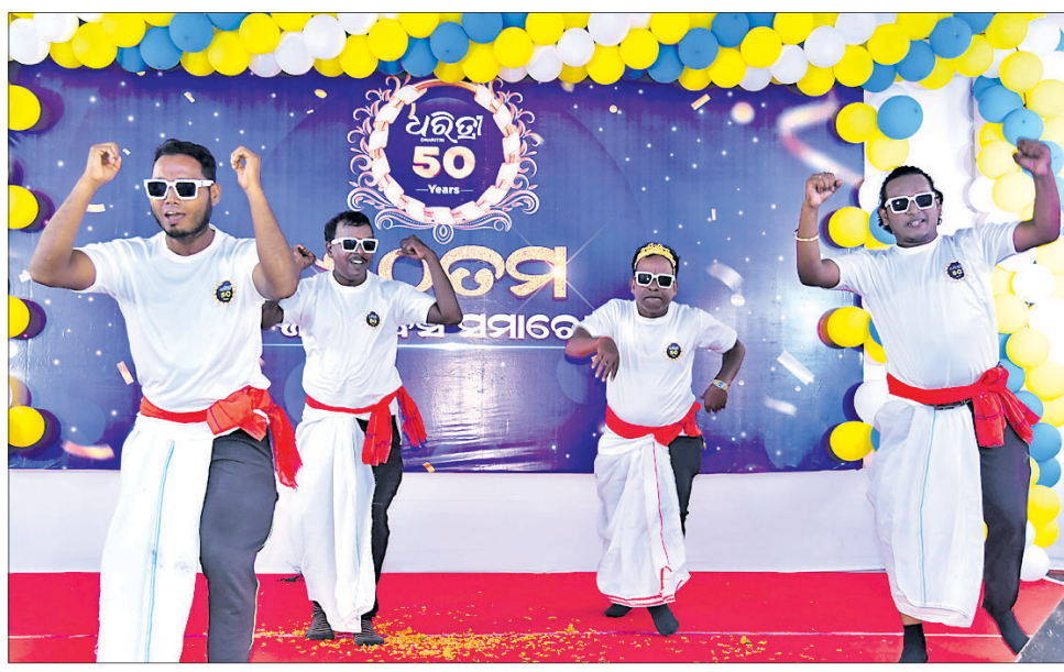
କାର୍ଯ୍ୟକ୍ରମରେ ଧରିତ୍ରୀ ଆଇଟି ଚିମ୍ପର ବିକାଶ, ରାଜୀବ, ସ୍ମୃତିରଞ୍ଜନ ଏବଂ ମନୋରଞ୍ଜନ ବାବା ନୃତ୍ୟ ଓ ଗୀତ ପରିବେଷଣ।