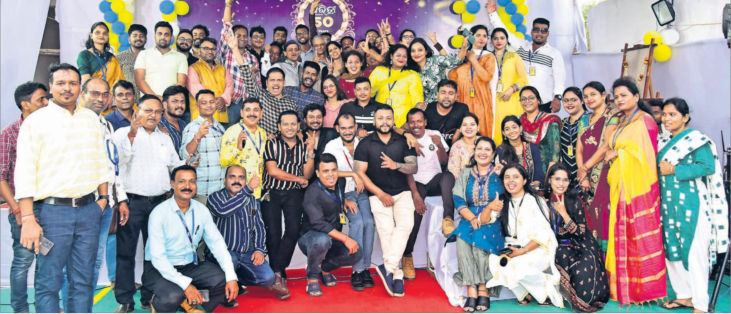
କାର୍ଯ୍ୟକ୍ରମରେ ଉପସ୍ଥିତ ଧରିତ୍ରୀ ପ୍ରବନ୍ଧକାର ସଦସ୍ୟମାନେ ।