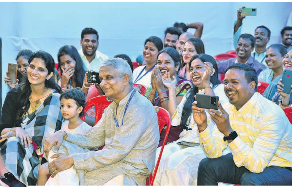
ନୃତ୍ୟର ତାଳେ ତାଳେ ଆନନ୍ଦର ଆସର।