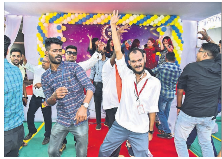
ନାଟଗୀତରେ ମସ୍ତୁରୁ ଧରିତ୍ରୀ ପରିବାର ସଦସ୍ୟ।