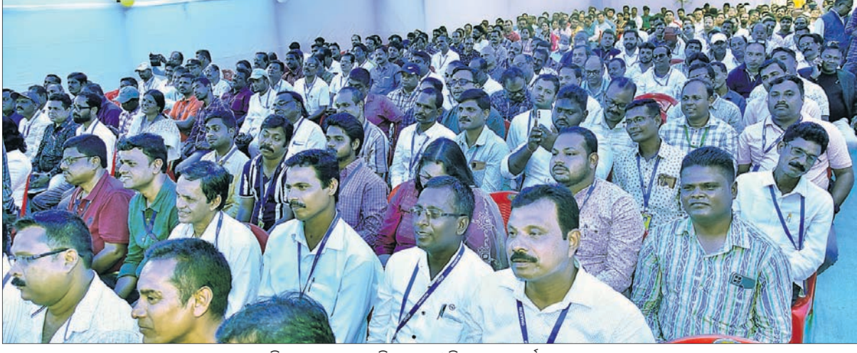
ଉପସ୍ଥିତ ଖବରଦାତା, ଧରିତ୍ରୀ ଏବଂ ଓଡ଼ିଶା ପୋଷ୍ଟ କର୍ମଚାରୀମାନେ ।