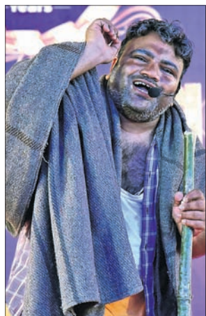
ରଞ୍ଜିତଞ୍ଜନ ଓ ପ୍ରଭାତଙ୍କ ବାବା ପରିବେଷିତ ଏକାଙ୍କିକା।