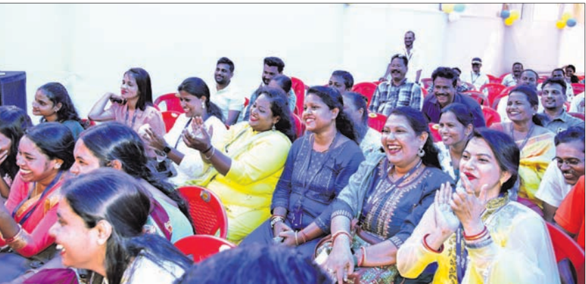
କାର୍ଯ୍ୟକ୍ରମରେ ନୃତ୍ୟ, ଗୀତ ଏବଂ ହାସ୍ୟଅଭିନୟର ଆନନ୍ଦ ଉଠାଇଥିବା ଧରିତ୍ରୀ ପରିବାରର ସଦସ୍ୟମାନେ।