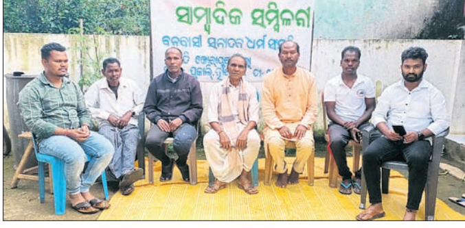
ଖବରବାତୀ ସମ୍ମିଳନୀରେ ବନବାସୀ ସମାଜନ ଧର୍ମ ସମିତିର ସଦସ୍ୟ ।