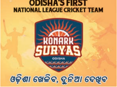
ଓଡ଼ିଶା ଖେଳିବ, ଦୁନିଆ ଦେଖୁବ