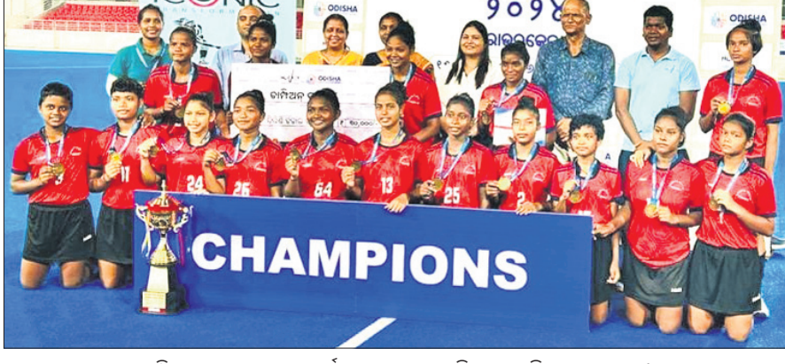
ଚାମ୍ପିୟନ ରାଉରକେଲା ଷ୍ଟୋର୍ଟ୍ସ ହଷ୍ଟେଲ ଖେଳାଳିମାନେ ଅତିଥିକ ଗହଣରେ।