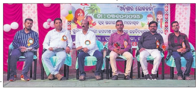
ସୁରଭି କାର୍ଯ୍ୟକ୍ରମରେ ଉପସ୍ଥିତ ଅତିଥିବୃନ୍ଦ ।

କରମୁର ଜଗଦୀଶ ଚନ୍ଦ୍ର ନାୟକ ଉଚ୍ଚ ବିଦ୍ୟାଳୟରେ ବୁଦ୍ଧପୁରୀୟ ସୁରଭି କାର୍ଯ୍ୟକ୍ରମକୁ ଗୁରୁତ୍ୱ ଦେଇ ଉଦ୍ଦାଟିତ ହୋଇଯାଇଛି।