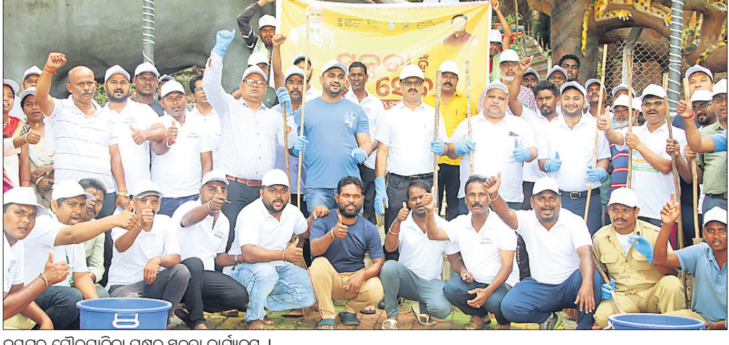
କରମୁର ପୌରପାଳିକା ପକ୍ଷରୁ ସ୍ୱଚ୍ଛତା କାର୍ଯ୍ୟକ୍ରମ ।

କରମୁର, ୩।୧୦ (ପବନ ପାଣିଗ୍ରାହୀ) କରମୁର ପୌରପାଳିକା ପକ୍ଷରୁ ସ୍ୱଚ୍ଛତା ହିଁ ସେବା, ସ୍ୱଭାବ ସ୍ୱଚ୍ଛତା ଓ ସଂସ୍କାର