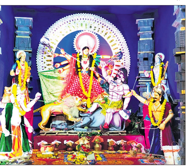
କରମୁରର ପାଇକ ସାହି ।