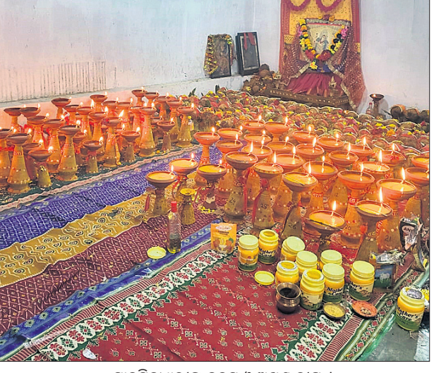
ମାନସିକଧାରାକ କଳସ ଓ ଅଖଣ୍ଡ ବାପ ।

କରମୁର, ୩।୧୦ (ପବନ ପାଣିଗ୍ରାହୀ) କରମୁରରେ ମୁଖ୍ୟା ମୂର୍ତ୍ତି ପୂଜା ଆରମ୍ଭ ହୋଇଥିବା ବେଳେ ନବରାତ୍ରି ପାଇଁ ସହର ଚଳଚଞ୍ଚଳ।