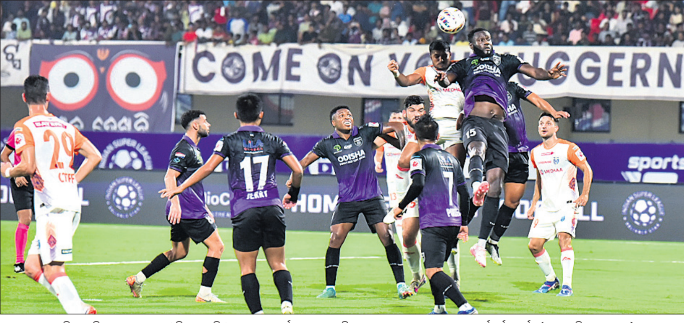
କଳିଙ୍ଗ ଖେଳାଳିମାନେ ଗୁଜରାଟ ଓଡ଼ିଶା ଏଫ୍ସି ଓ କେରଳ ରାଷ୍ଟ୍ରୀୟ ମଧ୍ୟରେ ଅନୁଷ୍ଠିତ ଆଇସିଏଏଏ ମ୍ୟାଚର ଏକ ସଂଘର୍ଷପୂର୍ଣ୍ଣ ମୁହୂର୍ତ୍ତ।

ପରବର୍ତ୍ତୀ ମ୍ୟାଚରେ ଜାମସେଦପୁର ଏଫ୍ସିକୁ ପରାସ୍ତ କରିଥିଲା.