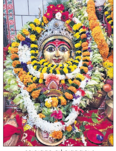
କୋରାପୁଟର ମା' ବାଟମଙ୍ଗଳା ।