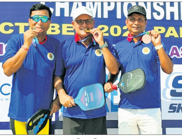
ପଦକ ସହ ଓଡ଼ିଶା ପ୍ରତିଯୋଗୀମାନେ।

ଭୁବନେଶ୍ୱର, ୭/୧୦ (ତପନ ସାହୁ) ହରିୟାଣାର ପାଟିପତାରେ ଜାତୀୟ ପିକଲବଲ ଚାମ୍ପିୟନଶିପର ୮ମ ସଂସ୍କରଣର ଉଦ୍‌ଘାଟନ ହୋଇଛି।