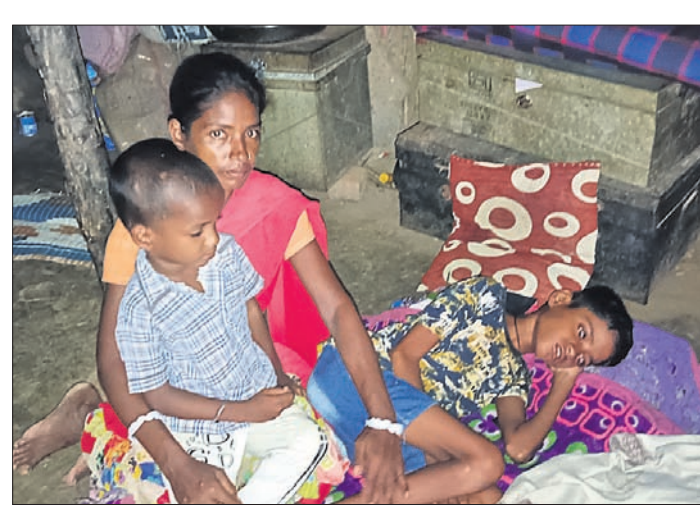
ପର ଘରେ ମୂଳ ଲାଗି ପ୍ରତିପୋଷଣ ଅନେକ କଷ୍ଟରେ ପାଠପଢାଇ ବଡ଼ କରୁଛନ୍ତି ମାଲକାନଗିରି ୩ ଓ ୪ ଓ ୫ ଓ ୬ ଓ ୭ ଓ ୮ ଓ ୯ ଓ ୧୦ ଓ ୧୧ ଓ ୧୨ ଓ ୧୩ ଓ ୧୪ ଓ ୧୫ ଓ ୧୬ ଓ ୧୭ ଓ ୧୮ ଓ ୧୯ ଓ ୨୦ ଓ ୨୧ ଓ ୨୨ ଓ ୨୩ ଓ ୨୪ ଓ ୨୫ ଓ ୨୬ ଓ ୨୭ ଓ ୨୮ ଓ ୨୯ ଓ ୩୦ ଓ ୩୧ ଓ ୩୨ ଓ ୩୩ ଓ ୩୪ ଓ ୩୫ ଓ ୩୬ ଓ ୩୭ ଓ ୩୮ ଓ ୩୯ ଓ ୪୦ ଓ ୪୧ ଓ ୪୨ ଓ ୪୩ ଓ ୪୪ ଓ ୪୫ ଓ ୪୬ ଓ ୪୭ ଓ ୪୮ ଓ ୪୯ ଓ ୫୦ ଓ ୫୧ ଓ ୫୨ ଓ ୫୩ ଓ ୫୪ ଓ ୫୫ ଓ ୫୬ ଓ ୫୭ ଓ ୫୮ ଓ ୫୯ ଓ ୬୦ ଓ ୬୧ ଓ ୬୨ ଓ ୬୩ ଓ ୬୪ ଓ ୬୫ ଓ ୬୬ ଓ ୬୭ ଓ ୬୮ ଓ ୬୯ ଓ ୭୦ ଓ ୭୧ ଓ ୭୨ ଓ ୭୩ ଓ ୭୪ ଓ ୭୫ ଓ ୭୬ ଓ ୭୭ ଓ ୭୮ ଓ ୭୯ ଓ ୮୦ ଓ ୮୧ ଓ ୮୨ ଓ ୮୩ ଓ ୮୪ ଓ ୮୫ ଓ ୮୬ ଓ ୮୭ ଓ ୮୮ ଓ ୮୯ ଓ ୯୦ ଓ ୯୧ ଓ ୯୨ ଓ ୯୩ ଓ ୯୪ ଓ ୯୫ ଓ ୯୬ ଓ ୯୭ ଓ ୯୮ ଓ ୯୯ ଓ ୧୦୦ ଓ ୧୦୧ ଓ ୧୦୨ ଓ ୧୦୩ ଓ ୧୦୪ ଓ ୧୦୫ ଓ ୧୦୬ ଓ ୧୦୭ ଓ ୧୦୮ ଓ ୧୦୯ ଓ ୧୧୦ ଓ ୧୧୧ ଓ ୧୧୨ ଓ ୧୧୩ ଓ ୧୧୪ ଓ ୧୧୫ ଓ ୧୧୬ ଓ ୧୧୭ ଓ ୧୧୮ ଓ ୧୧୯ ଓ ୧୨୦ ଓ ୧୨୧ ଓ ୧୨୨ ଓ ୧୨୩ ଓ ୧୨୪ ଓ ୧୨୫ ଓ ୧୨୬ ଓ ୧୨୭ ଓ ୧୨୮ ଓ ୧୨୯ ଓ ୧୩୦ ଓ ୧୩୧ ଓ ୧୩୨ ଓ ୧୩୩ ଓ ୧୩୪ ଓ ୧୩୫ ଓ ୧୩୬ ଓ ୧୩୭ ଓ ୧୩୮ ଓ ୧୩୯ ଓ ୧୪୦ ଓ ୧୪୧ ଓ ୧୪୨ ଓ ୧୪୩ ଓ ୧୪୪ ଓ ୧୪୫ ଓ ୧୪୬ ଓ ୧୪୭ ଓ ୧୪୮ ଓ ୧୪୯ ଓ ୧୫୦ ଓ ୧୫୧ ଓ ୧୫୨ ଓ ୧୫୩ ଓ ୧୫୪ ଓ ୧୫୫ ଓ ୧୫୬ ଓ ୧୫୭ ଓ ୧୫୮ ଓ ୧୫୯ ଓ ୧୬୦ ଓ ୧୬୧ ଓ ୧୬୨ ଓ ୧୬୩ ଓ ୧୬୪ ଓ ୧୬୫ ଓ ୧୬୬ ଓ ୧୬୭ ଓ ୧୬୮ ଓ ୧୬୯ ଓ ୧୭୦ ଓ ୧୭୧ ଓ ୧୭୨ ଓ ୧୭୩ ଓ ୧୭୪ ଓ ୧୭୫ ଓ ୧୭୬ ଓ ୧୭୭ ଓ ୧୭୮ ଓ ୧୭୯ ଓ ୧୮୦ ଓ ୧୮୧ ଓ ୧୮୨ ଓ ୧୮୩ ଓ ୧୮୪ ଓ ୧୮୫ ଓ ୧୮୬ ଓ ୧୮୭ ଓ ୧୮୮ ଓ ୧୮୯ ଓ ୧୯୦ ଓ ୧୯୧ ଓ ୧୯୨ ଓ ୧୯୩ ଓ ୧୯୪ ଓ ୧୯୫ ଓ ୧୯୬ ଓ ୧୯୭ ଓ ୧୯୮ ଓ ୧୯୯ ଓ ୨୦୦ ଓ ୨୦୧ ଓ ୨୦୨ ଓ ୨୦୩ ଓ ୨୦୪ ଓ ୨୦୫ ଓ ୨୦୬ ଓ ୨୦୭ ଓ ୨୦୮ ଓ ୨୦୯ ଓ ୨୧୦ ଓ ୨୧୧ ଓ ୨୧୨ ଓ ୨୧୩ ଓ ୨୧୪ ଓ ୨୧୫ ଓ ୨୧୬ ଓ ୨୧୭ ଓ ୨୧୮ ଓ ୨୧୯ ଓ ୨୨୦ ଓ ୨୨୧ ଓ ୨୨୨ ଓ ୨୨୩ ଓ ୨୨୪ ଓ ୨୨୫ ଓ ୨୨୬ ଓ ୨୨୭ ଓ ୨୨୮ ଓ ୨୨୯ ଓ ୨୩୦ ଓ ୨୩୧ ଓ ୨୩୨ ଓ ୨୩୩ ଓ ୨୩୪ ଓ ୨୩୫ ଓ ୨୩୬ ଓ ୨୩୭ ଓ ୨୩୮ ଓ ୨୩୯ ଓ ୨୪୦ ଓ ୨୪୧ ଓ ୨୪୨ ଓ ୨୪୩ ଓ ୨୪୪ ଓ ୨୪୫ ଓ ୨୪୬ ଓ ୨୪୭ ଓ ୨୪୮ ଓ ୨୪୯ ଓ ୨୫୦ ଓ ୨୫୧ ଓ ୨୫୨ ଓ ୨୫୩ ଓ ୨୫୪ ଓ ୨୫୫ ଓ ୨୫୬ ଓ ୨୫୭ ଓ ୨୫୮ ଓ ୨୫୯ ଓ ୨୬୦ ଓ ୨୬୧ ଓ ୨୬୨ ଓ ୨୬୩ ଓ ୨୬୪ ଓ ୨୬୫ ଓ ୨୬୬ ଓ ୨୬୭ ଓ ୨୬୮ ଓ ୨୬୯ ଓ ୨୭୦ ଓ ୨୭୧ ଓ ୨୭୨ ଓ ୨୭୩ ଓ ୨୭୪ ଓ ୨୭୫ ଓ ୨୭୬ ଓ ୨୭୭ ଓ ୨୭୮ ଓ ୨୭୯ ଓ ୨୮୦ ଓ ୨୮୧ ଓ ୨୮୨ ଓ ୨୮୩ ଓ ୨୮୪ ଓ ୨୮୫ ଓ ୨୮୬ ଓ ୨୮୭ ଓ ୨୮୮ ଓ ୨୮୯ ଓ ୨୯୦ ଓ ୨୯୧ ଓ ୨୯୨ ଓ ୨୯୩ ଓ ୨୯୪ ଓ ୨୯୫ ଓ ୨୯୬ ଓ ୨୯୭ ଓ ୨୯୮ ଓ ୨୯୯ ଓ ୩୦୦ ଓ ୩୦୧ ଓ ୩୦୨ ଓ ୩୦୩ ଓ ୩୦୪ ଓ ୩୦୫ ଓ ୩୦୬ ଓ ୩୦୭ ଓ ୩୦୮ ଓ ୩୦୯ ଓ ୩୧୦ ଓ ୩୧୧ ଓ ୩୧୨ ଓ ୩୧୩ ଓ ୩୧୪ ଓ ୩୧୫ ଓ ୩୧୬ ଓ ୩୧୭ ଓ ୩୧୮ ଓ ୩୧୯ ଓ ୩୨୦ ଓ ୩୨୧ ଓ ୩୨୨ ଓ ୩୨୩ ଓ ୩୨୪ ଓ ୩୨୫ ଓ ୩୨୬ ଓ ୩୨୭ ଓ ୩୨୮ ଓ ୩୨୯ ଓ ୩୩୦ ଓ ୩୩୧ ଓ ୩୩୨ ଓ ୩୩୩ ଓ ୩୩୪ ଓ ୩୩୫ ଓ ୩୩୬ ଓ ୩୩୭ ଓ ୩୩୮ ଓ ୩୩୯ ଓ ୩୪୦ ଓ ୩୪୧ ଓ ୩୪୨ ଓ ୩୪୩ ଓ ୩୪୪ ଓ ୩୪୫ ଓ ୩୪୬ ଓ ୩୪୭ ଓ ୩୪୮ ଓ ୩୪୯ ଓ ୩୫୦ ଓ ୩୫୧ ଓ ୩୫୨ ଓ ୩୫୩ ଓ ୩୫୪ ଓ ୩୫୫ ଓ ୩୫୬ ଓ ୩୫୭ ଓ ୩୫୮ ଓ ୩୫୯ ଓ ୩୬୦ ଓ ୩୬୧ ଓ ୩୬୨ ଓ ୩୬୩ ଓ ୩୬୪ ଓ ୩୬୫ ଓ ୩୬୬ ଓ ୩୬୭ ଓ ୩୬୮ ଓ ୩୬୯ ଓ ୩୭୦ ଓ ୩୭୧ ଓ ୩୭୨ ଓ ୩୭୩ ଓ ୩୭୪ ଓ ୩୭୫ ଓ ୩୭୬ ଓ ୩୭୭ ଓ ୩୭୮ ଓ ୩୭୯ ଓ ୩୮୦ ଓ ୩୮୧ ଓ ୩୮୨ ଓ ୩୮୩ ଓ ୩୮୪ ଓ ୩୮୫ ଓ ୩୮୬ ଓ ୩୮୭ ଓ ୩୮୮ ଓ ୩୮୯ ଓ ୩୯୦ ଓ ୩୯୧ ଓ ୩୯୨ ଓ ୩୯୩ ଓ ୩୯୪ ଓ ୩୯୫ ଓ ୩୯୬ ଓ ୩୯୭ ଓ ୩୯୮ ଓ ୩୯୯ ଓ ୪୦୦ ଓ ୪୦୧ ଓ ୪୦୨ ଓ ୪୦୩ ଓ ୪୦୪ ଓ ୪୦୫ ଓ ୪୦୬ ଓ ୪୦୭ ଓ ୪୦୮ ଓ ୪୦୯ ଓ ୪୧୦ ଓ ୪୧୧ ଓ ୪୧୨ ଓ ୪୧୩ ଓ ୪୧୪ ଓ ୪୧୫ ଓ ୪୧୬ ଓ ୪୧୭ ଓ ୪୧୮ ଓ ୪୧୯ ଓ ୪୨୦ ଓ ୪୨୧ ଓ ୪୨୨ ଓ ୪୨୩ ଓ ୪୨୪ ଓ ୪୨୫ ଓ ୪୨୬ ଓ ୪୨୭ ଓ ୪୨୮ ଓ ୪୨୯ ଓ ୪୩୦ ଓ ୪୩୧ ଓ ୪୩୨ ଓ ୪୩୩ ଓ ୪୩୪ ଓ ୪୩୫ ଓ ୪୩୬ ଓ ୪୩୭ ଓ ୪୩୮ ଓ ୪୩୯ ଓ ୪୪୦ ଓ ୪୪୧ ଓ ୪୪୨ ଓ ୪୪୩ ଓ ୪୪୪ ଓ ୪୪୫ ଓ ୪୪୬ ଓ ୪୪୭ ଓ ୪୪୮ ଓ ୪୪୯ ଓ ୪୫୦ ଓ ୪୫୧ ଓ ୪୫୨ ଓ ୪୫୩ ଓ ୪୫୪ ଓ ୪୫୫ ଓ ୪୫୬ ଓ ୪୫୭ ଓ ୪୫୮ ଓ ୪୫୯ ଓ ୪୬୦ ଓ ୪୬୧ ଓ ୪୬୨ ଓ ୪୬୩ ଓ ୪୬୪ ଓ ୪୬୫ ଓ ୪୬୬ ଓ ୪୬୭ ଓ ୪୬୮ ଓ ୪୬୯ ଓ ୪୭୦ ଓ ୪୭୧ ଓ ୪୭୨ ଓ ୪୭୩ ଓ ୪୭୪ ଓ ୪୭୫ ଓ ୪୭୬ ଓ ୪୭୭ ଓ ୪୭୮ ଓ ୪୭୯ ଓ ୪୮୦ ଓ ୪୮୧ ଓ ୪୮୨ ଓ ୪୮୩ ଓ ୪୮୪ ଓ ୪୮୫ ଓ ୪୮୬ ଓ ୪୮୭ ଓ ୪୮୮ ଓ ୪୮୯ ଓ ୪୯୦ ଓ ୪୯୧ ଓ ୪୯୨ ଓ ୪୯୩ ଓ ୪୯୪ ଓ ୪୯୫ ଓ ୪୯୬ ଓ ୪୯୭ ଓ ୪୯୮ ଓ ୪୯୯ ଓ ୫୦୦ ଓ ୫୦୧ ଓ ୫୦୨ ଓ ୫୦୩ ଓ ୫୦୪ ଓ ୫୦୫ ଓ ୫୦୬ ଓ ୫୦୭ ଓ ୫୦୮ ଓ ୫୦୯ ଓ ୫୧୦ ଓ ୫୧୧ ଓ ୫୧୨ ଓ ୫୧୩ ଓ ୫୧୪ ଓ ୫୧୫ ଓ ୫୧୬ ଓ ୫୧୭ ଓ ୫୧୮ ଓ ୫୧୯ ଓ ୫୨୦ ଓ ୫୨୧ ଓ ୫୨୨ ଓ ୫୨୩ ଓ ୫୨୪ ଓ ୫୨୫ ଓ ୫୨୬ ଓ ୫୨୭ ଓ ୫୨୮ ଓ ୫୨୯ ଓ ୫୩୦ ଓ ୫୩୧ ଓ ୫୩୨ ଓ ୫୩୩ ଓ ୫୩୪ ଓ ୫୩୫ ଓ ୫୩୬ ଓ ୫୩୭ ଓ ୫୩୮ ଓ ୫୩୯ ଓ ୫୪୦ ଓ ୫୪୧ ଓ ୫୪୨ ଓ ୫୪୩ ଓ ୫୪୪ ଓ ୫୪୫ ଓ ୫୪୬ ଓ ୫୪୭ ଓ ୫୪୮ ଓ ୫୪୯ ଓ ୫୫୦ ଓ ୫୫୧ ଓ ୫୫୨ ଓ ୫୫୩ ଓ ୫୫୪ ଓ ୫୫୫ ଓ ୫୫୬ ଓ ୫୫୭ ଓ ୫୫୮ ଓ ୫୫୯ ଓ ୫୬୦ ଓ ୫୬୧ ଓ ୫୬୨ ଓ ୫୬୩ ଓ ୫୬୪ ଓ ୫୬୫ ଓ ୫୬୬ ଓ ୫୬୭ ଓ ୫୬୮ ଓ ୫୬୯ ଓ ୫୭୦ ଓ ୫୭୧ ଓ ୫୭୨ ଓ ୫୭୩ ଓ ୫୭୪ ଓ ୫୭୫ ଓ ୫୭୬ ଓ ୫୭୭ ଓ ୫୭୮ ଓ ୫୭୯ ଓ ୫୮୦ ଓ ୫୮୧ ଓ ୫୮୨ ଓ ୫୮୩ ଓ ୫୮୪ ଓ ୫୮୫ ଓ ୫୮୬ ଓ ୫୮୭ ଓ ୫୮୮ ଓ ୫୮୯ ଓ ୫୯୦ ଓ ୫୯୧ ଓ ୫୯୨ ଓ ୫୯୩ ଓ ୫୯୪ ଓ ୫୯୫ ଓ ୫୯୬ ଓ ୫୯୭ ଓ ୫୯୮ ଓ ୫୯୯ ଓ ୬୦୦ ଓ ୬୦୧ ଓ ୬୦୨ ଓ ୬୦୩ ଓ ୬୦୪ ଓ ୬୦୫ ଓ ୬୦୬ ଓ ୬୦୭ ଓ ୬୦୮ ଓ ୬୦୯ ଓ ୬୧୦ ଓ ୬୧୧ ଓ ୬୧୨ ଓ ୬୧୩ ଓ ୬୧୪ ଓ ୬୧୫ ଓ ୬୧୬ ଓ ୬୧୭ ଓ ୬୧୮ ଓ ୬୧୯ ଓ ୬୨୦ ଓ ୬୨୧ ଓ ୬୨୨ ଓ ୬୨୩ ଓ ୬୨୪ ଓ ୬୨୫ ଓ ୬୨୬ ଓ ୬୨୭ ଓ ୬୨୮ ଓ ୬୨୯ ଓ ୬୩୦ ଓ ୬୩୧ ଓ ୬୩୨ ଓ ୬୩୩ ଓ ୬୩୪ ଓ ୬୩୫ ଓ ୬୩୬ ଓ ୬୩୭ ଓ ୬୩୮ ଓ ୬୩୯ ଓ ୬୪୦ ଓ ୬୪୧ ଓ ୬୪୨ ଓ ୬୪୩ ଓ ୬୪୪ ଓ ୬୪୫ ଓ ୬୪୬ ଓ ୬୪୭ ଓ ୬୪୮ ଓ ୬୪୯ ଓ ୬୫୦ ଓ ୬୫୧ ଓ ୬୫୨ ଓ ୬୫୩ ଓ ୬୫୪ ଓ ୬୫୫ ଓ ୬୫୬ ଓ ୬୫୭ ଓ ୬୫୮ ଓ ୬୫୯ ଓ ୬୬୦ ଓ ୬୬୧ ଓ ୬୬୨ ଓ ୬୬୩ ଓ ୬୬୪ ଓ ୬୬୫ ଓ ୬୬୬ ଓ ୬୬୭ ଓ ୬୬୮ ଓ ୬୬୯ ଓ ୬୭୦ ଓ ୬୭୧ ଓ ୬୭୨ ଓ ୬୭୩ ଓ ୬୭୪ ଓ ୬୭୫ ଓ ୬୭୬ ଓ ୬୭୭ ଓ ୬୭୮ ଓ ୬୭୯ ଓ ୬୮୦ ଓ ୬୮୧ ଓ ୬୮୨ ଓ ୬୮୩ ଓ ୬୮୪ ଓ ୬୮୫ ଓ ୬୮୬ ଓ ୬୮୭ ଓ ୬୮୮ ଓ ୬୮୯ ଓ ୬୯୦ ଓ ୬୯୧ ଓ ୬୯୨ ଓ ୬୯୩ ଓ ୬୯୪ ଓ ୬୯୫ ଓ ୬୯୬ ଓ ୬୯୭ ଓ ୬୯୮ ଓ ୬୯୯ ଓ ୭୦୦ ଓ ୭୦୧ ଓ ୭୦୨ ଓ ୭୦୩ ଓ ୭୦୪ ଓ ୭୦୫ ଓ ୭୦୬ ଓ ୭୦୭ ଓ ୭୦୮ ଓ ୭୦୯ ଓ ୭୧୦ ଓ ୭୧୧ ଓ ୭୧୨ ଓ ୭୧୩ ଓ ୭୧୪ ଓ ୭୧୫ ଓ ୭୧୬ ଓ ୭୧୭ ଓ ୭୧୮ ଓ ୭୧୯ ଓ ୭୨୦ ଓ ୭୨୧ ଓ ୭୨୨ ଓ ୭୨୩ ଓ ୭୨୪ ଓ ୭୨୫ ଓ ୭୨୬ ଓ ୭୨୭ ଓ ୭୨୮ ଓ ୭୨୯ ଓ ୭୩୦ ଓ ୭୩୧ ଓ ୭୩୨ ଓ ୭୩୩ ଓ ୭୩୪ ଓ ୭୩୫ ଓ ୭୩୬ ଓ ୭୩୭ ଓ ୭୩୮ ଓ ୭୩୯ ଓ ୭୪୦ ଓ ୭୪୧ ଓ ୭୪୨ ଓ ୭୪୩ ଓ ୭୪୪ ଓ ୭୪୫ ଓ ୭୪୬ ଓ ୭୪୭ ଓ ୭୪୮ ଓ ୭୪୯ ଓ ୭୫୦ ଓ ୭୫୧ ଓ ୭୫୨ ଓ ୭୫୩ ଓ ୭୫୪ ଓ ୭୫୫ ଓ ୭୫୬ ଓ ୭୫୭ ଓ ୭୫୮ ଓ ୭୫୯ ଓ ୭୬୦ ଓ ୭୬୧ ଓ ୭୬୨ ଓ ୭୬୩ ଓ ୭୬୪ ଓ ୭୬୫ ଓ ୭୬୬ ଓ ୭୬୭ ଓ ୭୬୮ ଓ ୭୬୯ ଓ ୭୭୦ ଓ ୭୭୧ ଓ ୭୭୨ ଓ ୭୭୩ ଓ ୭୭୪ ଓ ୭୭୫ ଓ ୭୭୬ ଓ ୭୭୭ ଓ ୭୭୮ ଓ ୭୭୯ ଓ ୭୮୦ ଓ ୭୮୧ ଓ ୭୮୨ ଓ ୭୮୩ ଓ ୭୮୪ ଓ ୭୮୫ ଓ ୭୮୬ ଓ ୭୮୭ ଓ ୭୮୮ ଓ ୭୮୯ ଓ ୭୯୦ ଓ ୭୯୧ ଓ ୭୯୨ ଓ ୭୯୩ ଓ ୭୯୪ ଓ ୭୯୫ ଓ ୭୯୬ ଓ ୭୯୭ ଓ ୭୯୮ ଓ ୭୯୯ ଓ ୮୦୦ ଓ ୮୦୧ ଓ ୮୦୨ ଓ ୮୦୩ ଓ ୮୦୪ ଓ ୮୦୫ ଓ ୮୦୬ ଓ ୮୦୭ ଓ ୮୦୮ ଓ ୮୦୯ ଓ ୮୧୦ ଓ ୮୧୧ ଓ ୮୧୨ ଓ ୮୧୩ ଓ ୮୧୪ ଓ ୮୧୫ ଓ ୮୧୬ ଓ ୮୧୭ ଓ ୮୧୮ ଓ ୮୧୯ ଓ ୮୨୦ ଓ ୮୨୧ ଓ ୮୨୨ ଓ ୮୨୩ ଓ ୮୨୪ ଓ ୮୨୫ ଓ ୮୨୬ ଓ ୮୨୭ ଓ ୮୨୮ ଓ ୮୨୯ ଓ ୮୩୦ ଓ ୮୩୧ ଓ ୮୩୨ ଓ ୮୩୩ ଓ ୮୩୪ ଓ ୮୩୫ ଓ ୮୩୬ ଓ ୮୩୭ ଓ ୮୩୮ ଓ ୮୩୯ ଓ ୮୪୦ ଓ ୮୪୧ ଓ ୮୪୨ ଓ ୮୪୩ ଓ ୮୪୪ ଓ ୮୪୫ ଓ ୮୪୬ ଓ ୮୪୭ ଓ ୮୪୮ ଓ ୮୪୯ ଓ ୮୫୦ ଓ ୮୫୧ ଓ ୮୫୨ ଓ ୮୫୩ ଓ ୮୫୪ ଓ ୮୫୫ ଓ ୮୫୬ ଓ ୮୫୭ ଓ ୮୫୮ ଓ ୮୫୯ ଓ ୮୬୦ ଓ ୮୬୧ ଓ ୮୬୨ ଓ ୮୬୩ ଓ ୮୬୪ ଓ ୮୬୫ ଓ ୮୬୬ ଓ ୮୬୭ ଓ ୮୬୮ ଓ ୮୬୯ ଓ ୮୭୦ ଓ ୮୭୧ ଓ ୮୭୨ ଓ ୮୭୩ ଓ ୮୭୪ ଓ ୮୭୫ ଓ ୮୭୬ ଓ ୮୭୭ ଓ ୮୭୮ ଓ ୮୭୯ ଓ ୮୮୦ ଓ ୮୮୧ ଓ ୮୮୨ ଓ ୮୮୩ ଓ ୮୮୪ ଓ ୮୮୫ ଓ ୮୮୬ ଓ ୮୮୭ ଓ ୮୮୮ ଓ ୮୮୯ ଓ ୮୯୦ ଓ ୮୯୧ ଓ ୮୯୨ ଓ ୮୯୩ ଓ ୮୯୪ ଓ ୮୯୫ ଓ ୮୯୬ ଓ ୮୯୭ ଓ ୮୯୮ ଓ ୮୯୯ ଓ ୯୦୦ ଓ ୯୦୧ ଓ ୯୦୨ ଓ ୯୦୩ ଓ ୯୦୪ ଓ ୯୦୫ ଓ ୯୦୬ ଓ ୯୦୭ ଓ ୯୦୮ ଓ ୯୦୯ ଓ ୯୧୦ ଓ ୯୧୧ ଓ ୯୧୨ ଓ ୯୧୩ ଓ ୯୧୪ ଓ ୯୧୫ ଓ ୯୧୬ ଓ ୯୧୭ ଓ ୯୧୮ ଓ ୯୧୯ ଓ ୯୨୦ ଓ ୯୨୧ ଓ ୯୨୨ ଓ ୯୨୩ ଓ ୯୨୪ ଓ ୯୨୫ ଓ ୯୨୬ ଓ ୯୨୭ ଓ ୯୨୮ ଓ ୯୨୯ ଓ ୯୩୦ ଓ ୯୩୧ ଓ ୯୩୨ ଓ ୯୩୩ ଓ ୯୩୪ ଓ ୯୩୫ ଓ ୯୩୬ ଓ ୯୩୭ ଓ ୯୩୮ ଓ ୯୩୯ ଓ ୯୪୦ ଓ ୯୪୧ ଓ ୯୪୨ ଓ ୯୪୩ ଓ ୯୪୪ ଓ ୯୪୫ ଓ ୯୪୬ ଓ ୯୪୭ ଓ ୯୪୮ ଓ ୯୪୯ ଓ ୯୫୦ ଓ ୯୫୧ ଓ ୯୫୨ ଓ ୯୫୩ ଓ ୯୫୪ ଓ ୯୫୫ ଓ ୯୫୬ ଓ ୯୫୭ ଓ ୯୫୮ ଓ ୯୫୯ ଓ ୯୬୦ ଓ ୯୬୧ ଓ ୯୬୨ ଓ ୯୬୩ ଓ ୯୬୪ ଓ ୯୬୫ ଓ ୯୬୬ ଓ ୯୬୭ ଓ ୯୬୮ ଓ ୯୬୯ ଓ ୯୭୦ ଓ ୯୭୧ ଓ ୯୭୨ ଓ ୯୭୩ ଓ ୯୭୪ ଓ ୯୭୫ ଓ ୯୭୬ ଓ ୯୭୭ ଓ ୯୭୮ ଓ ୯୭୯ ଓ ୯୮୦ ଓ ୯୮୧ ଓ ୯୮୨ ଓ ୯୮୩ ଓ ୯୮୪ ଓ ୯୮୫ ଓ ୯୮୬ ଓ ୯୮୭ ଓ ୯୮୮ ଓ ୯୮୯ ଓ ୯୯୦ ଓ ୯୯୧ ଓ