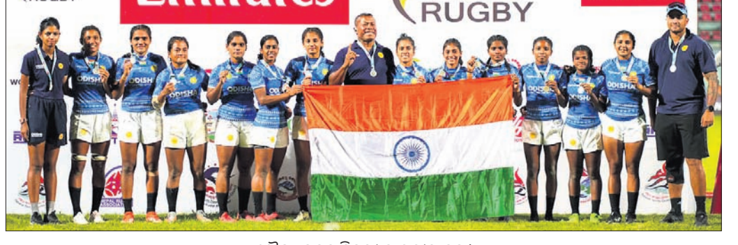
ରୌପ୍ୟ ପଦକ ବିଜୟୀ ଭାରତୀୟ ଦଳ।

ଭୁବନେଶ୍ୱର, ୭/୧୦ (ତପନ ସାହୁ) କାଠମାଣ୍ଡୁର ଦଶରଥ ସ୍ମାରକରେ ଅନୁଷ୍ଠିତ ଏସିଆ ରଗ୍‌ବୀ ଏନିଭେଟ୍‌ସ୍ ସେଭେନ୍ସ ଟ୍ରଫି-୨୦୨୪ରେ ଭାରତୀୟ ମହିଳା ଦଳ ରୌପ୍ୟ ପଦକ ହାସଲ କରିଛି।