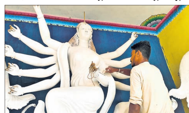
ଏମ୍ବି ୭ଏ, ୨୦୧୦(ଭିକି ବାରିକ)

ଏମ୍ବି ୭ଏ ମଣ୍ଡଳରେ ପୂଜାର ବିଶେଷ ମହାମ୍ମା ରହିଛି। ପୁରୁଣା ଗୋରା ଭିତରେ ପୂଜା ପାଳନେ ମା'ଙ୍କ ୧୮ ଫୁଟର ମୂର୍ତ୍ତୀ ପୂଜା ହେଉଛି ଏମ୍ବି ୭ଏ ସାମ୍ବନ୍ଧରେ ପୂଜା କମିଟି ପାଇଁ ୫୭ ତମ ପୂଜା। ସେହିପରି ମୂଳ ପିଠିକ ପାଇଁ ମଧ୍ୟ ରହିଛି ଆକର୍ଷଣୀୟ କାର୍ଯ୍ୟକ୍ରମ। ଏମ୍ବି-୭ଏ ଦୁର୍ଗା ମଣ୍ଡଳରେ ଭୁଲକିଏ ମଞ୍ଚ, ଝୁମିକିଏ ଦର୍ଶନ, ଉଦ୍‌ଭିଳି ଆଲ୍‌ପୁର ଡାକେ ତାଙ୍କେ ଚାଲେ ଧ୍ୟାନ ସାଙ୍ଗକୁ ଶୁଣି ଚାଲେ ମଧ୍ୟ ଏକ ନିଆରା ଅନୁଭବ ସାରିବେ ଦର୍ଶକ। ମା'ଙ୍କ ଆବାହନ ପାଇଁ ସକେଇ ହେଉଛି ପୂଜା ମଣ୍ଡପ। ଶରତର ଫୁଲର ପୂର୍ଣ୍ଣା। ଏଭଳି ଏକ ପୂର୍ଣ୍ଣ ପରିବେଶରେ ଆହୁରି ଜଗତ ଜନନୀ ମା' ଦୁର୍ଗା। ମା'ଙ୍କ ଆବାହନ ପାଇଁ ଚାଲିଛି ପ୍ରସ୍ତୁତି। ଶିଳ୍ପୀ ମନ୍ତ୍ର ମୁଖ୍ୟା ମୂଳି ତିଆରିରେ ଆଉ ସକେଇ ହେଉଛି ଗୋରା ମଣ୍ଡପ। ଶିଳ୍ପୀ ମନ୍ତ୍ର ମୁଖ୍ୟା ମୂଳି ତିଆରିରେ ଆଉ ସକେଇ ହେଉଛି ଗୋରା ମଣ୍ଡପ। ଧରାପୁଷ୍ପ ଆହୁରି ଜଗତ ଜନନୀ। ପୂର୍ଣ୍ଣା ପୂର୍ଣ୍ଣ ପାପ ନାଶକର ପ୍ରତିଷ୍ଠା କରିବେ ସତ୍ୟ ଓ ଶାନ୍ତି। ନଦୀ ପାଠରେ ହସ୍ତୁଣି କାଶିତପା। ମା'ଙ୍କ ଆବାହନ ପାଇଁ ବିକେଇ ଦେଇଛି ଗାଳିଆ। ଆଉ ଦିନ କେଇଟାରେ ଅପେକ୍ଷା ଧରାପୁଷ୍ପକୁ ଓହ୍ଲାଇବେ ମା'। ଦୁଃ ବିନାଶି ପ୍ରତିଷ୍ଠା କରିବେ ସତ୍ୟ ଧର୍ମ ଓ ଶାନ୍ତି। ଅଶ୍ୱିନର ଏ ଅପରୂପ ବେଳାରେ ମା'ଙ୍କୁ ଚାହିଁ ରହିଛି ମାଟିରୁ ଆକାଶ। ମୁଖ୍ୟା ମୂଳି ତିଆରିରେ ନିମ୍ନ ଶିଳ୍ପୀ ଗାଳିଆ ମଣ୍ଡପ ଆଉ ଗୋରା ସଜା। ଆଉ ଦିନ କେଇଟାରେ ଅପେକ୍ଷା। ଝଲସିବ ଏମ୍ବି ୭ଏ ଅଞ୍ଚଳ ସମେତ ସମ୍ପୂର୍ଣ୍ଣ ମାଲକାନଗିରି ଜିଲାର ବିଭିନ୍ନ ଦେବା ପାଠ। ଦୁର୍ଗାପୂଜା ମା'ଙ୍କ ପୂଜା ପାଖେଇ ଆସୁଛି। ଏଥି ପାଇଁ ମାଲକାନଗିରି ଜିଲାର କୋଣ ଅନୁକୋଣରେ ପୂଜା ପ୍ରସ୍ତୁତି କୋରାବାର ଚାଲିଛି। ରାଜ୍ୟ ତଥା ବାହାରର ବହୁ କାରିଗର ମୂଲି ଗଢାଉ ନିମ୍ନ ରହିଛନ୍ତି।