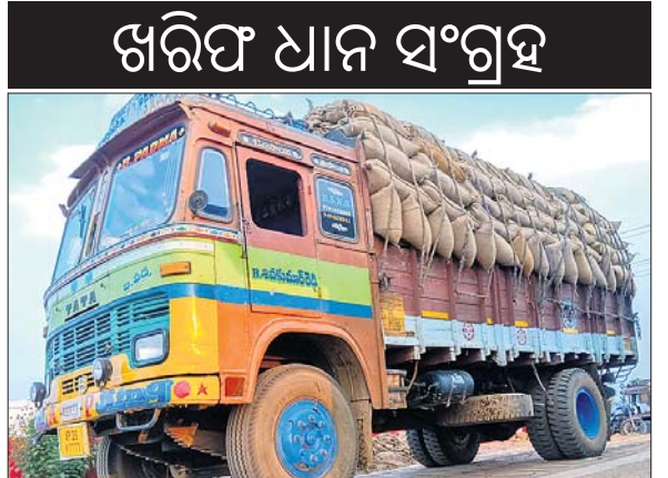
ଏହାକୁଦୃଷ୍ଟିରେ ରଖିଧାନ କିଣାବେଳେ ରାଜ୍ୟର ସାମାନ୍ୟତା ଜିଲ୍ଲାଗୁଡ଼ିକର ପ୍ରବେଶପଥକୁ ସିଲ୍ କରାଯିବ। ସିସିଟିଭି କ୍ୟାମେରା ମାଧ୍ୟମରେ ସାମାନ୍ୟତା ରାଜ୍ୟ ସହ

କେନ୍ଦ୍ର ସରକାର ୨୦୨୪-୨୫ ଆର୍ଥିକ ବର୍ଷରେ ଖରିଫ ଧାନର କୁଳଖଣ୍ଡ ପିଛା ସର୍ବନିମ୍ନ ସହାୟକ ମୂଲ୍ୟ (ଏମ୍‌ଏସ୍‌ସି) ୨,୩୦୦ ଟଙ୍କାରେ କାଟିଛନ୍ତି। ଓଡ଼ିଶା ସରକାର ଏହି ମୂଲ୍ୟଠାରୁ ଅଧିକ ୮୦୦ ଟଙ୍କାରେ ଅର୍ଥାତ୍ ୩,୧୦୦ ଟଙ୍କାରେ ଧାନ କିଣିବା ପଡ଼େଣା ଖାଦ୍ୟଶାସ୍ତ୍ର, ପଶୁମେଦିକା ଓ ଛତିଶଗଡ଼ର ଅସାଧୁ ବ୍ୟବସାୟୀ ଏହାର ଫାଇଦା ନେବା ପାଇଁ ଓଡ଼ିଶାରେ ଧାନ ବିକ୍ରି କରିପାରନ୍ତି ବୋଲି ରାଜ୍ୟ ସରକାର ଆଶଙ୍କା କରି ଏହା ଉପରେ ରୋକ୍ ଲଗାଇବାକୁ ଯାଚିଛନ୍ତି। ଏହିକ୍ରମେ ମଙ୍ଗଳବାର ମୁଖ୍ୟମନ୍ତ୍ରୀ ମୋହନ ଚରଣ ମାଝୀଙ୍କ ଅଧ୍ୟକ୍ଷତାରେ ଏକ ବୈଠକ ବସିଛି। ଏଥିରେ ବାହାର ରାଜ୍ୟର ଧାନକୁ ରୋକିବା ପାଇଁ ସାମାନ୍ୟତା ଜିଲ୍ଲାଗୁଡ଼ିକର ପ୍ରବେଶପଥକୁ ସିଲ୍ କରିବା ସହ ଏନ୍‌ଫୋର୍ସମେଣ୍ଟ୍ ଏକ୍ସ୍‌ପ୍ରେସ୍ କରାଯିବାକୁ ନିଷ୍ପତ୍ତି ନିଆଯାଇଛି। ଧାନ କିଣା ପ୍ରକ୍ରିୟାରେ ସ୍ୱଚ୍ଛତା ପାଇଁ ମନ୍ତ୍ରୀମାନେ ମଣ୍ଡି ବୁଲି ଚାଷୀଙ୍କ କଥା ବୁଝିବେ।