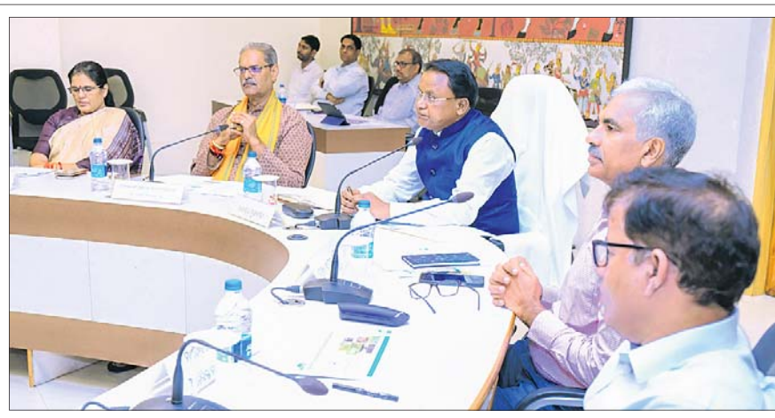
ଲୋକସେବା ଭବନରେ ମଙ୍ଗଳବାର ଅନୁଷ୍ଠିତ ବୈଠକରେ ଅଧ୍ୟକ୍ଷତା କରୁଥିବା ମୁଖ୍ୟମନ୍ତ୍ରୀ ମୋହନ ଚରଣ ମାଝୀ।