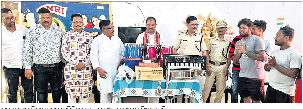
ନବରଙ୍ଗପୁର ବିଧାୟକଙ୍କ ଉପସ୍ଥିତିରେ ଅନ୍ତେବାସୀଙ୍କୁ ବାଦ୍ୟଯନ୍ତ୍ର ଦିଆଯାଇଛି ।