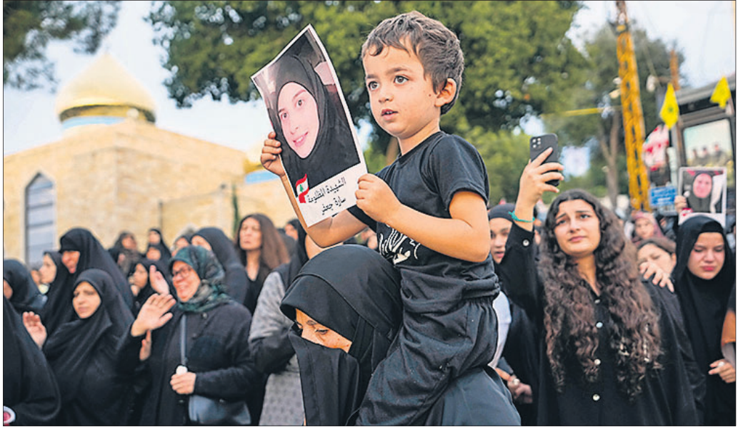
ଲେବାନନ୍‌ର ବାୟବୋଲୁଠାରେ ଏକ ସାମୂହିକ ଅତିମ ସଂସ୍କାର ଶୋଭାଯାତ୍ରାରେ ଜଣେ ବାକ ନିଜ ସମ୍ପର୍କୀୟଙ୍କ ଫଟୋକୁ ଧରିଛନ୍ତି ।