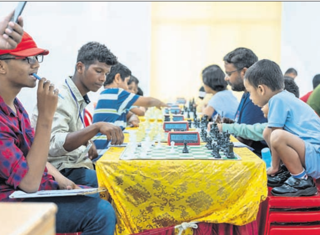
ପଞ୍ଚମ ରାଉଣ୍ଡ ଅବସରରେ ଖେଳାଳିମାନେ ।