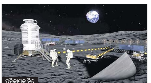
ପ୍ରତିକାମ୍ପ ଚିତ୍ର ପାଇଁ ଦେଶର ଦୀର୍ଘକାଳୀନ ବିକାଶ କାର୍ଯ୍ୟକ୍ରମକୁ ଉନ୍ନତ କରାଯାଇଛି। ମହାକାଶ କ୍ଷେତ୍ରରେ ଆଗାମୀ କିଛି ଦଶନ୍ଧି ମଧ୍ୟରେ ଚାଇନା ପକ୍ଷରୁ ବିଶିଷ୍ଟ ଚନ୍ଦ୍ରପୂର୍ଣ୍ଣ ମିଶନକୁ କାର୍ଯ୍ୟକାରୀ କରାଯିବ। ଏଥିପାଇଁ ୨୦୫୦ ପର୍ଯ୍ୟନ୍ତ ଯୋଜନା ପ୍ରସ୍ତୁତ ହୋଇଛି। ଚାଇନା ଏକାଡେମୀ ଅଫ୍ ସାଇନ୍ସ(ସିଏଏସ୍),

ଭୁବନେଶ୍ୱର, ୧୫/୧୦ ଚନ୍ଦ୍ରକୁ ମାଟି ନମୁନା ଆଣିବା ପରେ ଆଉ ଏକ ଚନ୍ଦ୍ରପୂର୍ଣ୍ଣ ମିଶନ ପାଇଁ ପ୍ରସ୍ତୁତି ଆରମ୍ଭ କରିଛି ଚାଇନା। ୨୦୫୦ ସୁଦ୍ଧା ଚାଇନା ପକ୍ଷରୁ ମାନବ ଚନ୍ଦ୍ର ମିଶନ, ଚନ୍ଦ୍ରରେ ମହାକାଶ କେନ୍ଦ୍ର ନିର୍ମାଣ ମିଶନ, ପୃଥିବୀ ବ୍ୟତୀତ ବାସଯୋଗ୍ୟ ଗ୍ରହ ଓ ଜୀବନର ଗବେଷଣା ଆଦିକୁ କାର୍ଯ୍ୟକାରୀ କରିବା ପାଇଁ ବେକିଂ ଘୋଷଣା କରିଛି। ମଙ୍ଗଳବାର ଚାଇନା ସର୍ବୋଚ୍ଚ ମହାକାଶ ସମ୍ମାନ ପକ୍ଷରୁ ମହାକାଶ ବିଜ୍ଞାନ