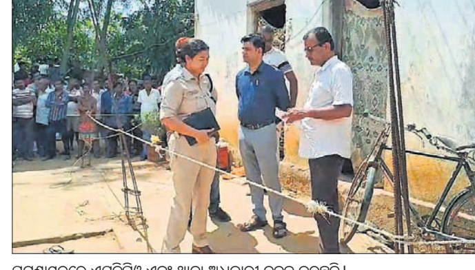
ଘଟଣାସ୍ଥଳରେ ଏସ୍ପିପିଓ ଏବଂ ଆନା ଅଧିକାରୀ ତଦନୁକୃତ କରୁଛନ୍ତି ।