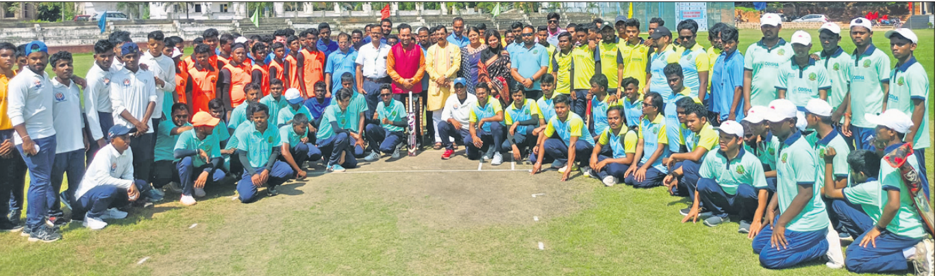
ରାଜ୍ୟସ୍ତରୀୟ ଦୃଷ୍ଟିବାଧୂତ କ୍ରିକେଟ ଟୁର୍ନାମେଣ୍ଟର ଉଦ୍‌ଯୋଗୀ ଅବସରରେ ଅତିଥିକ ସହ ଅଂଶଗ୍ରହଣକାରୀ ଦଳର ଖେଳାଳିମାନେ ।