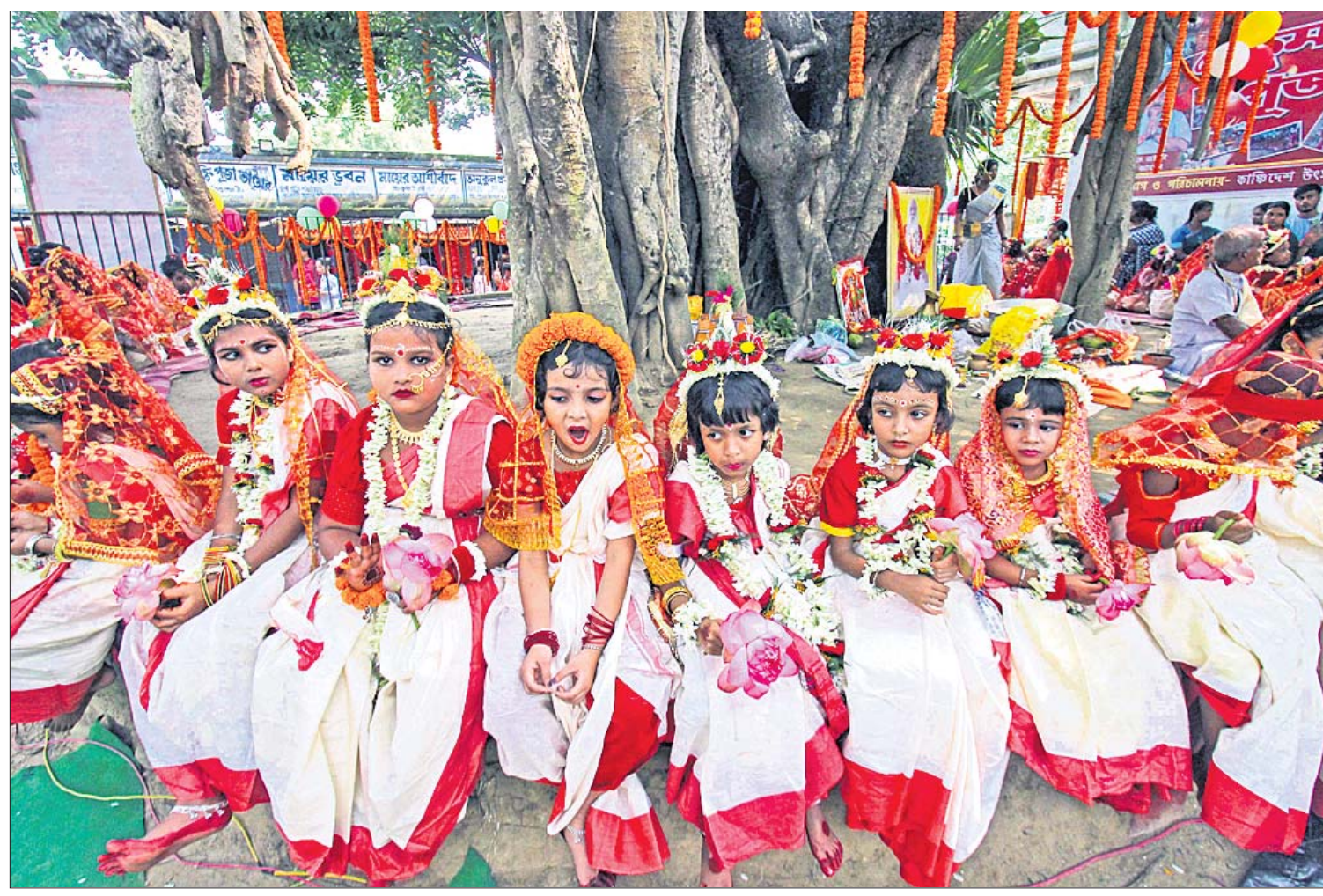
୫୧ ଶକ୍ତିପାଠ ମଧ୍ୟରୁ ଅନ୍ୟତମ ପଣ୍ଡିତବଞ୍ଚନ ବୀରଭୂମି ଜିଲ୍ଲା କନକାଳୀ କାଳୀ ମନ୍ଦିରରେ ମଙ୍ଗଳବାର ୫୧ ଡିଅକୁ ନେଇ କୁମାରୀ ପୂଜା କରାଯାଇଛି।

ଉଦିତା ସବୁଠାରୁ ଦୀନା ଖେଳାଳି ହକି ଲଣ୍ଡିଆ ଲିଗ୍ ମହିଳା ଖେଳାଳି ନିଲାମରେ ସବୁଠାରୁ ଦୀନା ଖେଳାଳି ବିବେଚିତ ହୋଇଛନ୍ତି ଭାରତର ଉଦିତା ଦୁହାନ।