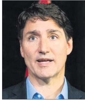
କାନାଡା ପ୍ରଧାନମନ୍ତ୍ରୀ ଜଷ୍ଟିନ୍ ଟ୍ରୁଡୋ

୨୦୨୩ ଜୁନ୍ ୧୮ରେ ଖଲସ୍ତାନୀ ବିଚ୍ଛିନ୍ନତାବାଦୀ ହରଦୀପ ସିଂ ନିଜାରଙ୍କ ହତ୍ୟାରେ ଭାରତ ସରକାରଙ୍କ ସମ୍ପୂର୍ଣ୍ଣ ଥିବା ଦର୍ଶାଇ କାନାଡା ଏହାର ତଦନ୍ତ ଆରମ୍ଭ କରିବା ପରଠାରୁ ଦୁଇଦେଶର ସମ୍ପର୍କରେ ତିକ୍ତତା ବଢ଼ିବାରେ ଲାଗିଛି। ସୋମବାର କାନାଡା ପୁଣି ଏହି ପ୍ରସଙ୍ଗ ଉଠାଇ ଭାରତୀୟ ଉଚ୍ଚାଧିକାରୀ ଓ କୃତନୀତିକ୍ଷମାନଙ୍କୁ ଅଭିଯୁକ୍ତ ଦର୍ଶାଇଥିଲା। ନ୍ୟୁଆଦିଲ୍ଲା ନିଜ ପ୍ରତିକ୍ରିୟାରେ ଭାରତୀୟ ଉଚ୍ଚାଧିକାରୀଙ୍କୁ ଫେରାଇ ଆଣିବା ସହ ୬ କାନାଡାୟ କୃତନୀତିକ୍ଷଙ୍କୁ ବହିଷ୍କାର କରିଛି। ଓଡ଼ିଆ ଏହାର ଜବାବ ଦେବାକୁ ଯାଇ ଭାରତ ଉପରେ କଟକଣା ଲଗାଇପାରେ ବୋଲି ମଙ୍ଗଳବାର କାନାଡା ବହିଷ୍କାପୀୟ ମନ୍ତ୍ରୀ ମେଲାନିସ୍ କୋଲି ସଙ୍କେତ ଦେଇଛନ୍ତି। ୨୦୨୨-୨୩ ଆର୍ଥିକ ବର୍ଷରେ ଦୁଇଦେଶ ୮.୪ ବିଲିୟନ ଆମେରିକୀୟ ଡଲାରର ବାଣିଜ୍ୟିକ କାରବାର କରିଥିବାବେଳେ ୨୦୨୩-୨୪ରେ ଏଥିରେ ହ୍ରାସ ପରିଲକ୍ଷିତ ହୋଇଥିଲା। ୨୦୨୩-୨୪ରେ ଭାରତ କାନାଡାଠାରୁ ୪.୬ ବିଲିୟନ ଡଲାର ମୂଲ୍ୟର ସାମଗ୍ରୀ ଆମଦାନୀ କରିଥିବାବେଳେ ରପ୍ତାନି ସାମଗ୍ରୀର ପରିମାଣ ୩.୮ ବିଲିୟନ ଡଲାର ରହିଥିଲା। ପୂର୍ବରୁ କୃତନୀତିକ ସମ୍ପର୍କ ପ୍ରତ୍ୟାବିତ ହୋଇଥିବାବେଳେ ଭାରତ ଉପରେ କାନାଡା ଅର୍ଥନୈତିକ କଟକଣା ଲଗାଇଲେ ଦ୍ୱିପାକ୍ଷିକ ବାଣିଜ୍ୟିକ କାରବାର ଆହୁରି ଖରାପ ହୋଇପାରେ, ଯାହାର ପ୍ରତ୍ୟକ୍ଷ ପ୍ରଭାବ ଭାରତୀୟ ବଜାର ଓ ଖାତରିକ ଉପରେ ପଡ଼ିବ। ଅନ୍ୟପକ୍ଷେ ତିକ୍ତତା ଯୋଗୁ କାନାଡାରେ ଥିବା ୪ ଲକ୍ଷରୁ ଊର୍ଦ୍ଧ୍ୱ ଭାରତୀୟ ଛାତ୍ରାଛାତ୍ରୀ ଏବଂ ଉଭୟ ଦେଶର ଭିକ୍ଷା ଆଶାୟୀଙ୍କ ତିକ୍ତା ମଧ୍ୟ ବଢ଼ିଛି। ତେଣୁ ଉଭୟ ରାଷ୍ଟ୍ର ସମ୍ପାଦ୍ୟ ଅର୍ଥନୈତିକ ଅଚଳାବସ୍ଥାକୁ ଏଡ଼ାଇବା ପାଇଁ ସତର୍କତାର ସହ ପଦକ୍ଷେପ ନେବା ଉଚିତ ବୋଲି ଥିକ୍‌କ୍ୟାକ୍ ଗ୍ଲୋବାଲ ଟ୍ରେଡ୍ ରିସର୍ଚ୍ଚ ଇନିସିଟିଭ୍ (କିଟିଆଇଆଇ) ସତର୍କ କରାଇଛି।