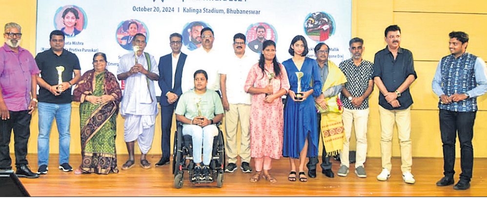
ସ୍ୱୋର୍ଷ୍ୟ ଲଗାଅନ ପୁରସ୍କାର ସହ ଅତିଥିଙ୍କ ସମେତ ଖେଳାଳି

ଭୁବନେଶ୍ୱର, ୨୦୧୦ (ସରୋଜ କେନା) ଭୁବନେଶ୍ୱର ପୁରସ୍କାର ପ୍ରତିଯୋଗିତାରେ ଉପାଧିକାରୀ ହୋଇଥିବା ପୁରସ୍କାରୀଙ୍କର ପୁରସ୍କାର ଘୋଷଣା କରାଯାଇଛି।