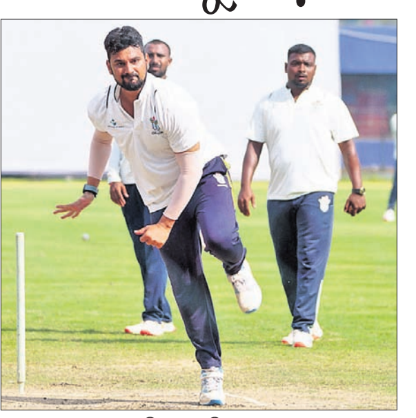
ବାରବାଟୀ ଷ୍ଟାଡିୟମରେ ଓଡ଼ିଶା ଦଳର ଅଭ୍ୟାସ।

ଭୁବନେଶ୍ୱର, ୧୨.୧୧ (ତପନ ସାଲ୍): ଚଳିତ ରଣଜୀ ଟ୍ରଫି ସିକ୍ସନରେ ଓଡ଼ିଶା ଏହାର ପଞ୍ଚମ ମ୍ୟାଚ ରୁଧିରାଠାରୁ କଟକର ବାରବାଟୀ ଷ୍ଟାଡିୟମରେ ଖେଳିବ। ଏଥର ଓଡ଼ିଶାର ପ୍ରତିଦ୍ୱନ୍ଦୀ ମହାରାଷ୍ଟ୍ର। ଓଡ଼ିଶା ଏପର୍ଯ୍ୟନ୍ତ ୪ଟି ମ୍ୟାଚ ଖେଳି ସାରିଥିଲେ ହେଁ ଆଶାକରୁଥିବା ପ୍ରଦର୍ଶନ କରିପାରି ନାହିଁ। ଉଭୟ ବ୍ୟାଟିଂ ଓ ବୋଲିଂରେ ବିଫଳ ରହିଛି ଗୋଟିଏ ପୋକାରକ୍ ନେତୃତ୍ୱାଧୀନ ଦଳ। ଅଗରତାଲାରେ ହେବାକୁଥିବା