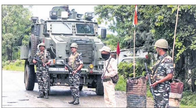
କରାଯାଇଛି । ସେଠାରେ ଥିବା କେତେକ ବୋକାଳକୁ ସୋମବାର ଉଗ୍ରପକ୍ଷୀମାନେ ନିଆଁ ଲଗାଇଦେଇଥିବା ଯୋଗ୍ୟ କହିଥିଲା ।

ଭଞ୍ଜାଳ, ୧୨.୧୧.୧୯ ମଣିପୁରର ଜିରିବାମ୍ ଜିଲ୍ଲାରେ ସୋମବାର ଅପରାହ୍ଣରେ ଦିଆରୁପିଏସ୍ ଯବାନଙ୍କ ଭୁଲରେ ପ୍ରାଣ ହରାଇଥିବା ୧୦ ଜଣ ଭୁଲି ଉଗ୍ରପକ୍ଷୀ ବୋଲି ବର୍ଣ୍ଣାଯାଇଥିଲା । ତେବେ ସେମାନେ ଉଗ୍ରପକ୍ଷୀ ନ ଥିଲେ, ବରଂ ଗ୍ରାମ ସ୍ୱେଚ୍ଛାସେବୀ ବୋଲି ଜୁଲି-ଜୋ ସଂଗଠନ ପକ୍ଷରୁ ଦାବି କରାଯାଇଛି । ଯବାନମାନେ ସେମାନଙ୍କ ଉପରେ ଅତର୍କିତ ଆକ୍ରମଣ କରି ହତ୍ୟା କରିଥିବା ଗ୍ଲାମାୟ ଆଦିବାସୀ ନେତାମାନଙ୍କ ଫୋରମ୍ (ଆଇଟିଏଲ୍‌ଏସ୍) କହିଛି । ସୋମବାର ୧୦ ଜଣଙ୍କ ମୃତଦେହ ମିଳିଥିବାବେଳେ ମଙ୍ଗଳବାର ସକାଳେ ୨ ଜଣ ବୟସ୍କ ବ୍ୟକ୍ତିଙ୍କ ମୃତଦେହ ଠାବ