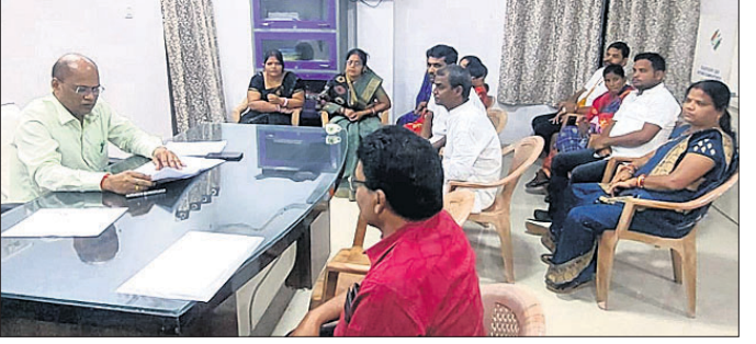
ସଭାକୁହରେ ଉପସ୍ଥିତ ସଭ୍ୟାସଭ୍ୟା ଓ ଉପକ୍ରମାପାଳ।