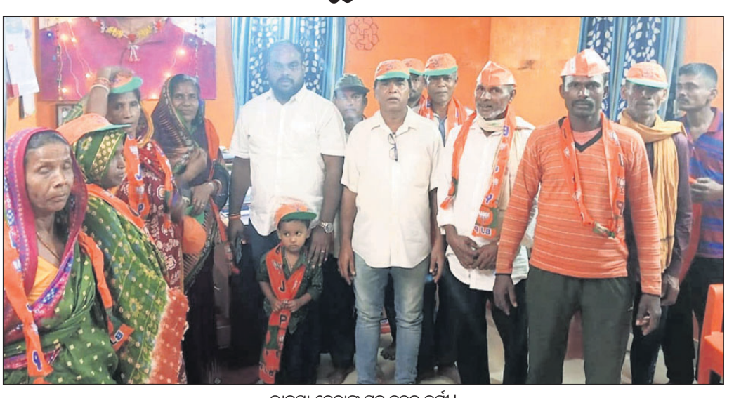
ଭାଜପା ନେତାଙ୍କ ସହ ନୂତନ କର୍ମୀ।