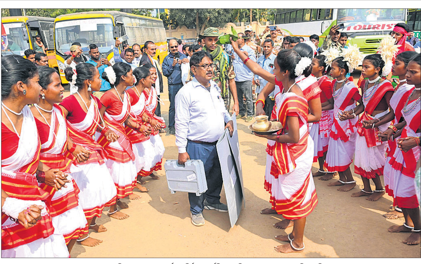
ଝାଡ଼ଖଣ୍ଡ ବିଧାନସଭା ପ୍ରଥମ ପର୍ଯ୍ୟାୟ ନିର୍ବାଚନ ପୂର୍ବଦିନ ପୋଲିଂ ସାମଗ୍ରୀ ସହ ଜଣେ ଅଧିକାରୀଙ୍କ ଭୋଗପ୍ରସାଦ କେନ୍ଦ୍ରକୁ ଯିବା ପୂର୍ବରୁ ରାଷ୍ଟ୍ରପତିଙ୍କୁ ଆଦିବାସୀ ମହିଳାମାନେ ପାରମ୍ପରିକ ସ୍ୱାଗତ ଜଣାଉଛନ୍ତି।

ଝାଡ଼ଖଣ୍ଡରେ ପ୍ରଥମ ପର୍ଯ୍ୟାୟ ନିର୍ବାଚନର ଦିନକ ପୂର୍ବରୁ ପ୍ରବର୍ତ୍ତନ ନିର୍ଦ୍ଦେଶାଳୟ (ଇଡି) ଏହି ରାଜ୍ୟ ସମେତ ପଶ୍ଚିମବଙ୍ଗର ୧୭ଟି ସ୍ଥାନରେ ମଙ୍ଗଳବାର ଚଢ଼ାଉ କରିଛି।