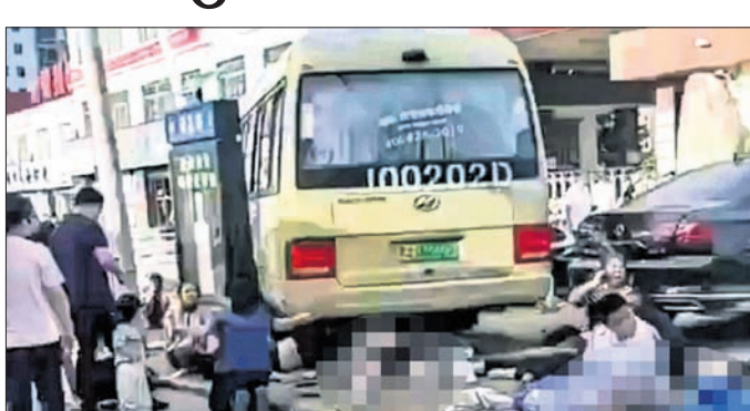
ଝୁହାଇ ସହରରେ ଥିବା ଝୋର୍ଟ୍ ସେଣ୍ଟର ବାହାରେ ଲୋକଙ୍କ ଉପରେ କାର୍ ମଡ଼ିଯାଇଛି ।

ସୋମବାର ରାତିରେ ଏହି ଘଟଣା ଘଟିଛି । ଝୋର୍ଟ୍ ସେଣ୍ଟରରେ ଲୋକେ ବ୍ୟାୟାମ କରୁଥିବାବେଳେ ବାହାରେ ଅନେକେ ରୁଣ୍ଡ ହୋଇଥିଲେ । ସେମାନଙ୍କ ଉପରକୁ କାର୍ ମଡ଼ିଯାଇଥିଲା । ରାତ୍ରୀ ଉପରେ ମୃତଦେହଗୁଡ଼ିକ ପଡ଼ିରହିଥିବାବେଳେ ଲୋକେ ସାହାଯ୍ୟ ପାଇଁ ଆକୃନ୍ତ ଚିତ୍କାର କରୁଥିବା ସୋସିଆଲ ମିଡ଼ିଆରେ ପ୍ରସାରିତ ଭିଡ଼ିଓରେ ଦେଖିବାକୁ ମିଳିଛି । କାର୍ ମଡ଼ାଇ ଦେଇଥିବା ୬୨ ବର୍ଷୀୟ ଭ୍ରାଜଭରକୁ ପୋଲିସ୍ ଗିରଫ କରି ଅଟକ ରଖିଛି । ତେବେ ଏହା ପୃଷ୍ଠା-୪