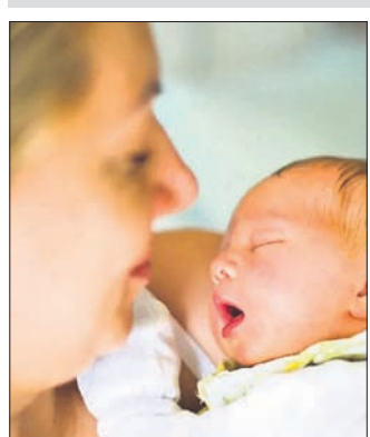
ହେବା ପରଠାରୁ ବନ୍ଧୁ ଧନକାବନହାନି ଘଟିଛି। ଫଳରେ ରୁଷିଆର ଜନସଂଖ୍ୟା ହ୍ରାସ ଦେଖାଦେଇଥିବାବେଳେ

ଏହି ସମସ୍ୟାକୁ ଦୂର କରିବା ପାଇଁ ଯୋଜନା ପ୍ରସ୍ତୁତ କରିବାକୁ ପୁତ୍ରିତ୍ୱ ଦେଶର ଅଧିକାରୀମାନଙ୍କୁ ଆହ୍ୱାନ କରିଛନ୍ତି। ଫଳରେ ଜନସଂଖ୍ୟା ବୃଦ୍ଧି ନେଇ ବିଭିନ୍ନ ସଙ୍ଗଠନ ପକ୍ଷରୁ ଦିଆଯାଉଥିବା ପ୍ରସ୍ତାବଗୁଡ଼ିକ ଉପରେ ରୁଷିୟ ଅଧିକାରୀମାନେ ବିଚାର ବିମର୍ଶ କରୁଛନ୍ତି। ସେକ୍ସ ମନ୍ତ୍ରଣାଳୟ ଗଠନ ସହ ଅନେକ ଅଜବ ପ୍ରସ୍ତାବ ମଧ୍ୟ ରୁଷିୟ ଅଧିକାରୀମାନଙ୍କୁ ମିଳିଛି। ଦମ୍ପତିଙ୍କ ମଧ୍ୟରେ ଅତରଳ ସୁହୃଦ୍ଧିକୁ ବଢ଼ାଇବା ପାଇଁ ରାତି ୧୦ଟାରୁ ୨ଟା ମଧ୍ୟରେ ଲଣ୍ଡନରେ ଏବଂ ବିକ୍ଟୁରି ସେବା ବନ୍ଦ କରିବା, ଘରେ ରହି ପିଲାଙ୍କ