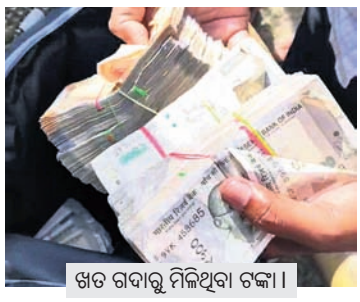
ଖତ ଗଦାରୁ ମିଳିଥିବା ଟଙ୍କା।