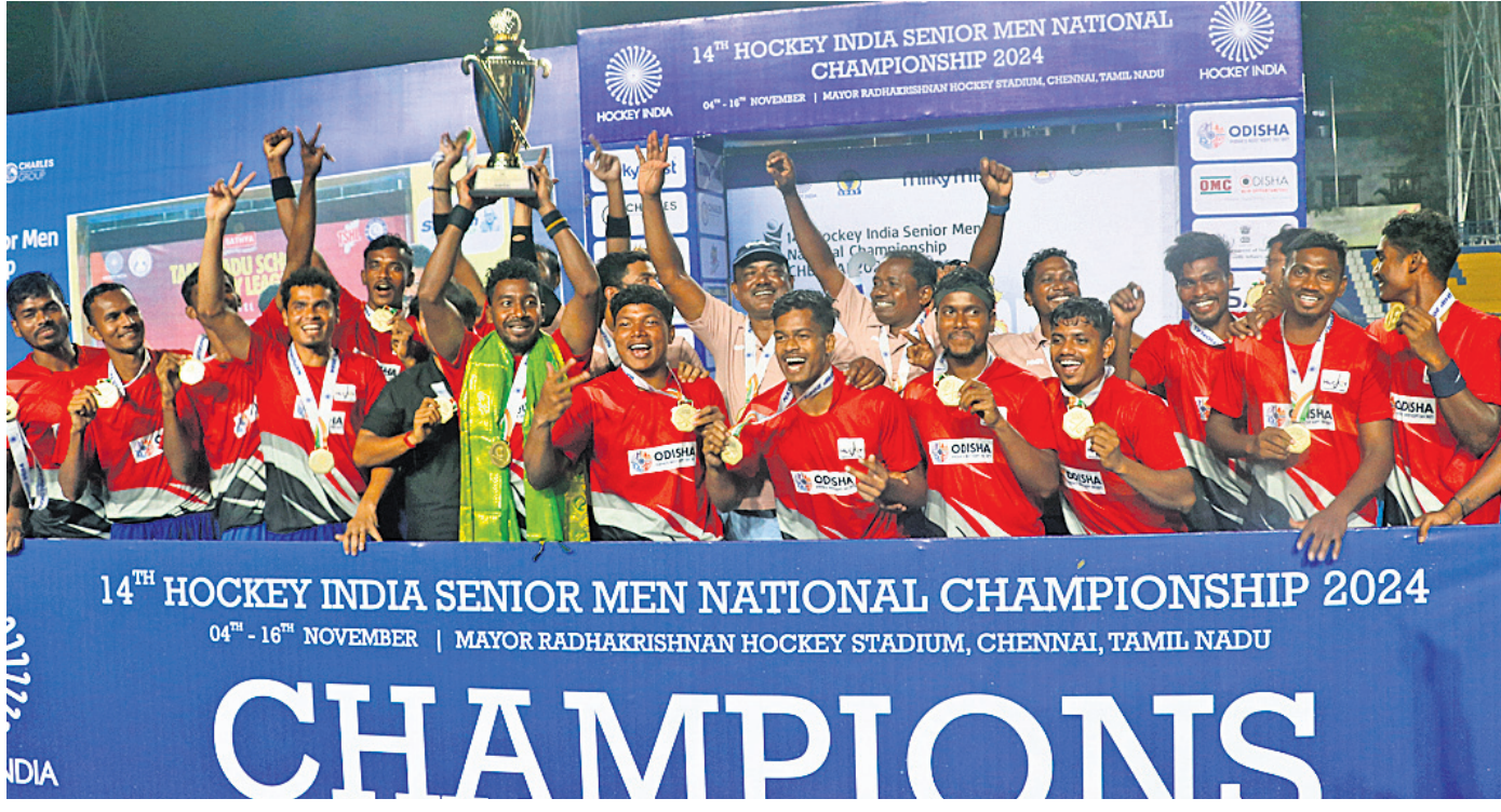
ଚେନାଇରେ ଅନୁଷ୍ଠିତ ଜାତୀୟ ସିନିୟର ହକି ଚାମ୍ପିୟନଶିପ୍‌ରେ ବିଜୟୀ ଟ୍ରଫି ସହ ଓଡ଼ିଶା ଦଳର ଖେଳାଳି ।

ବିଦେଶରୁ ଓଡ଼ିଶାକୁ ଆସିବ ନିବେଶକ। ମୁଖ୍ୟମନ୍ତ୍ରୀ ମୋହନ ଚରଣ ମାଝୀ ସିଙ୍ଗାପୁରରେ ଶିଳ୍ପ କରତର ଶୀର୍ଷ ନେତୃତ୍ୱରେ ଓଡ଼ିଶାକୁ ନିମନ୍ତ୍ରଣ ଦେବେ। ଏଥିପାଇଁ ମୁଖ୍ୟମନ୍ତ୍ରୀ ଓ ରାଜ୍ୟ ସରକାରଙ୍କ ବରିଷ୍ଠ ପ୍ରତିନିଧିମଣ୍ଡଳ ୪ ଦିନିଆ ସିଙ୍ଗାପୁର ଗସ୍ତରେ ଯାଇଛନ୍ତି। ସିଙ୍ଗାପୁର ଯିବା ପୂର୍ବରୁ ବିଜୁ ପଟ୍ଟନାୟକ ବିମାନବନ୍ଦରରେ ଗଣମାଧ୍ୟମକୁ ସୂଚନା ଦେଇ ମୁଖ୍ୟମନ୍ତ୍ରୀ କହିଛନ୍ତି, ମହାପ୍ରଭୁ ଶ୍ରୀକରନାଥଙ୍କ ଆଶୀର୍ବାଦ ଓ ପ୍ରଧାନମନ୍ତ୍ରୀ ନରେନ୍ଦ୍ର ମୋଦିଙ୍କ ମାର୍ଗଦର୍ଶନରେ ଏକ ବରିଷ୍ଠ ପ୍ରତିନିଧିମଣ୍ଡଳର ନେତୃତ୍ୱ ନେଇ ସିଙ୍ଗାପୁର ଅଭିମୁଖେ ବାହାରିବେ। ଏ ଯାତ୍ରା ନିଶ୍ଚୟ ସଫଳ ହେବ। ଯେତେବେଳେ ଯାତ୍ରା ବିଶ୍ୱରୁ ୧୬