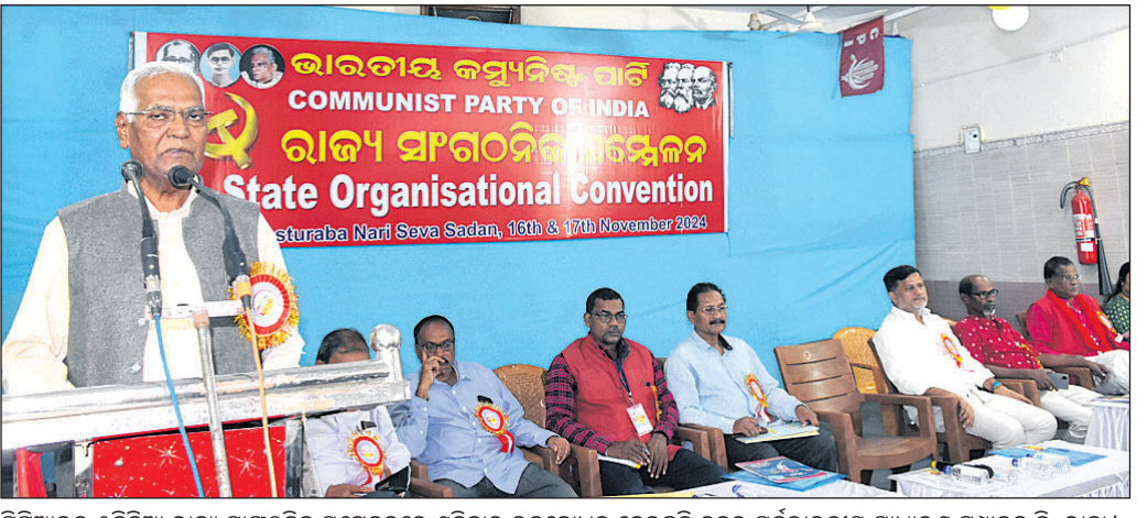
ସିପିଆଇର ୨୯ତମ ରାଜ୍ୟ ସାଙ୍ଗଠନିକ ସମ୍ମେଳନରେ ଶନିବାର ଉଦ୍‌ବୋଧନ ଦେଉଛନ୍ତି ଦଳର ସର୍ବଭାରତୀୟ ସାଧାରଣ ସମ୍ପାଦକ ଡି. ରାଜା।