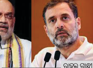
ଆଚରଣ ବିଧି ଉଲ୍ଲଙ୍ଘନ ଅଭିଯୋଗ

ଏଭଳି ମିଛ କହି ରାହୁଲ ଗାନ୍ଧୀଙ୍କୁ ମଧ୍ୟରେ ଭେଦଭାବ ସୃଷ୍ଟି କରୁଥିବା ଭାଜପା ଅଭିଯୋଗରେ ଦର୍ଶାଇଥିଲା। ସେହିଭଳି ଗତ ୧୩ ତାରିଖରେ କଂଗ୍ରେସ ପକ୍ଷରୁ ଇସି ନିକଟରେ ଅଭିଯୋଗ ହୋଇଥିଲା। ଯେ, ସ୍ୱରାଷ୍ଟ୍ର ମନ୍ତ୍ରୀ ଅମିତ୍ ଶାହା ଝାଡ଼ଖଣ୍ଡର ଧାନବାଦରେ ନିର୍ବାଚନୀ ସଭାରେ କଂଗ୍ରେସ ଏବଂ ଏହାର ସହଯୋଗୀ ଦଳଗୁଡ଼ିକ ବିରୋଧରେ ମିଥ୍ୟା, ବିଭାଜନ ସୃଷ୍ଟିକାରୀ ଓ ଅପବାଦମୂଳକ ମତବ୍ୟ ଦେଇଥିଲେ। କଂଗ୍ରେସ ଏବଂ ସହଯୋଗୀ ଦଳଗୁଡ଼ିକ ଏସ୍‌ଟି, ଏସ୍‌ଟି, ଓସି ବିରୋଧୀ ଏବଂ ସେମାନେ ଦେଶରେ ଆତଙ୍କବାଦକୁ ପ୍ରୋତ୍ସାହନ ଦେଉଛନ୍ତି ବୋଲି ଶାହା ଭାଷଣରେ କହିଥିବା ଅଭିଯୋଗରେ ଦର୍ଶାଯାଇଛି।