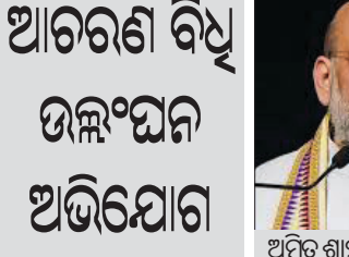
ଆଚରଣ ବିଧି ଉଲ୍ଲଙ୍ଘନ ଅଭିଯୋଗ

ମହାରାଷ୍ଟ୍ର ଏବଂ ଝାଡ଼ଖଣ୍ଡ ବିଧାନସଭା ନିର୍ବାଚନରେ ବେଳେ ଆଦର୍ଶ ଆଚରଣ ବିଧି ଉଲ୍ଲଙ୍ଘନ ନେଇ ଭାଜପା ଏବଂ କଂଗ୍ରେସ ପରସ୍ପର ବିରୋଧରେ ନିର୍ବାଚନ କମିଶନ (ଇସି) ନିକଟରେ ଅଭିଯୋଗ କରିଥିଲେ। ଇସି ଶନିବାର ଉଭୟ ଦଳର ଅଧକ୍ଷଙ୍କୁ ଏହା ଉପରେ ଜବାବ ମାଗିଛନ୍ତି। ନିର୍ବାଚନ ଆୟୋଗ ଭାଜପା ରାଷ୍ଟ୍ରୀୟ ଅଧକ୍ଷ ଜେ.ପି. ନକ୍ସା ଏବଂ କଂଗ୍ରେସ ଅଧକ୍ଷ ମଲ୍ଲିକାର୍ଜୁନ ଖାରୋଙ୍କୁ ଅଲଗା ଅଲଗା ପତ୍ର ଲେଖି ଅଭିଯୋଗ ଉପରେ ମତାମତ ରଖିବାକୁ କହିଛନ୍ତି। ସେମାନଙ୍କ ଅପରାଧ ୧୩ ଦୁଇ ସେମାନଙ୍କୁ ଜବାବ ମାଗାଯାଇଛି। ସାଧାରଣ ଶିକ୍ଷାଗାରରେ ପଢ଼ାଉଛନ୍ତି ନ ହୁଏ ଏବଂ