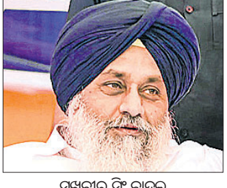
ସୁଖବୀର ସିଂ ବାଦଲ ନୂଆଦିଲ୍ଲୀ, ୧୬/୧୧

ସୁଖବୀର ସିଂ ବାଦଲ ଶନିବାର ଶିରୋମୁଖି ଅକାଳୀ ଦଳ (ଏସଏଡି) ଅଧକ୍ଷ ପଦରୁ ଇସ୍ତଫା ଦେଇଛନ୍ତି। ସୁଖବୀର ତାଙ୍କ ଇସ୍ତଫାପତ୍ର ଦଳର କାର୍ଯ୍ୟକାରୀ କମିଟି ନିକଟରେ ଦାଖଲ କରିଥିବା ଦକ୍ଷିଣ ନେତା ଦଲଜିତ ସିଂ ଟୋ ସ୍ୱୀକୃତି ଦେଇଛନ୍ତି। ଫଳରେ ନୂଆ ଅଧକ୍ଷ ନିର୍ବାଚନ ପାଇଁ ବାଟ ସଫା ହୋଇଯାଇଛି। ତାଙ୍କର ନେତୃତ୍ୱ ପ୍ରତି ଆଶ୍ୱାସ ପ୍ରକଟ କରିଥିବା ଏବଂ କାର୍ଯ୍ୟକାରୀ ମଧ୍ୟରେ ପୁରାଦମ୍ଭରେ ସହଯୋଗ କରିଥିବାରୁ ଦଳର ସମସ୍ତ ନେତା ଓ କର୍ମୀମାନଙ୍କୁ ସୁଖବୀର ଧନ୍ୟବାଦ ଜଣାଇଛନ୍ତି। ସୂଚନାଯୋଗ୍ୟ, ୨୦୧୯ ଡିସେମ୍ବର ୧୪ରେ ସୁଖବୀର ଦଳର ଅଧକ୍ଷ ନିର୍ବାଚିତ ହୋଇଥିବାବେଳେ ଆସନ୍ତା ମାସରେ ତାଙ୍କର ୫ ବର୍ଷିଆ କାର୍ଯ୍ୟକାଳ ପୂରଣ ହୋଇଥାଏ।