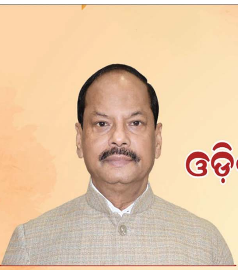
ଶ୍ରୀ ରଞ୍ଜିବ ଦାସ ରାଜ୍ୟପାଳ, ଓଡ଼ିଶା