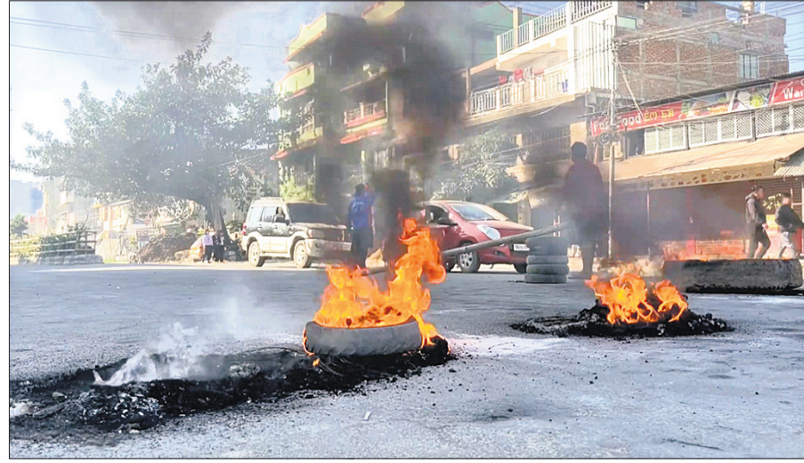
୬ ମେଇଟି ଅପହୃତଙ୍କ ମୃତଦେହ ମିଳିବା ପରେ ଶନିବାର ଇମ୍ପାଲରେ ଲୋକେ ରାସ୍ତାରେ ଗାୟାର ଜାଳି ବିସ୍ଫୋଜ କରୁଛନ୍ତି।