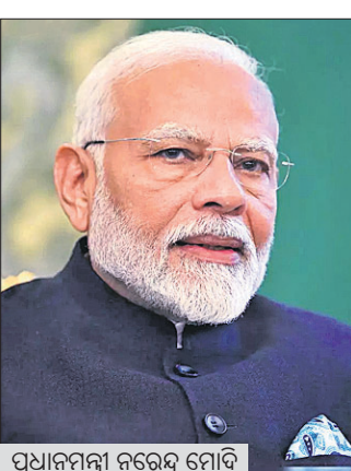
ପ୍ରଧାନମନ୍ତ୍ରୀ ନରେନ୍ଦ୍ର ମୋଦି

ଆମେରିକା ରାଷ୍ଟ୍ରପତି ଜୋ ବାଇଡେନ୍‌ଙ୍କ ଭଳି ପ୍ରଧାନମନ୍ତ୍ରୀ ନରେନ୍ଦ୍ର ମୋଦି ତାଙ୍କ ସ୍ମୃତିଶକ୍ତି ହରାଇବାର ସମ୍ଭାବନା ବୋଲି କଂଗ୍ରେସ ନେତା ରାହୁଲ ଗାନ୍ଧୀ ଶନିବାର ମହାରାଷ୍ଟ୍ରରେ ଏକ ନିର୍ବାଚନୀ ସଭାକୁ ଉଦ୍‌ବୋଧନ ଦେଲାବେଳେ କହିଛନ୍ତି। କଂଗ୍ରେସ ନେତ୍ରୀ ପ୍ରିୟଙ୍କା ଗାନ୍ଧୀ ଉଦ୍‌ବୋଧନ ପ୍ରସଙ୍ଗରେ କହିଛନ୍ତି, ପ୍ରଧାନମନ୍ତ୍ରୀ ଆଜିକାଲି ସେହି ପ୍ରସଙ୍ଗ