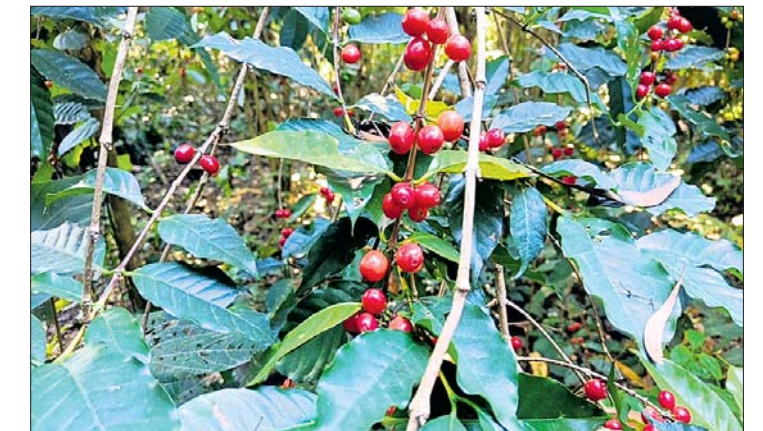
ଦାରିଙ୍ଗବାଡ଼ିର କର୍ମ ବରିତା।

ଦାରିଙ୍ଗବାଡ଼ିର କର୍ମ ଚଳିବ ପଛରେ ଚାଷ କରାଯାଉଛି। କୋରାପୁଟ ପରେ ଦାରିଙ୍ଗବାଡ଼ି କର୍ମର ଅନେକ ଚାହିଦା ରହିଛି। ମାତ୍ର ଦାରିଙ୍ଗବାଡ଼ି କର୍ମକୁ ନେଇ ସରକାରଙ୍କ ପକ୍ଷରୁ କୌଣସି ଆଗ୍ରହ ପ୍ରକାଶ ପାଉନି। ରାଜ୍ୟ ତଥା ରାଜ୍ୟ ବାହାରୁ ଏଠାକୁ ଆସୁଥିବା ପର୍ଯ୍ୟଟକ କର୍ମ ବରିତା ବୁଲୁଛି। କର୍ମମଞ୍ଜି ଓ ବକାରରେ ମିଳୁଥିବା କର୍ମଗୁଣ୍ଡ କିଛି ନିଅନ୍ତି। ଘରୋଇ ବ୍ୟବସାୟମାନେ ହିଁ କର୍ମ ମଞ୍ଜି ବିକ୍ରି କରନ୍ତି। ଜିଲ୍ଲା ପ୍ରଶାସନର ମୁଖିକା ସଂରକ୍ଷଣ ବିଭାଗ ଦ୍ୱାରା ପରିଚାଳିତ ଏହି କର୍ମ ବରିତା କେବଳ ପର୍ଯ୍ୟଟକଙ୍କଠାରୁ ଟିକେଟ ସଂଗ୍ରହ ବ୍ୟତୀତ ଆଉ କିଛି ପଦକ୍ଷେପ ନେଇ ନ ଥାଏ। କୋରାପୁଟ କର୍ମ ରାଜ୍ୟ ତଥା ରାଜ୍ୟ ବାହାରରେ ବହୁତ ପରିଚିତ ହୋଇପାରିଛି। ଏବେ ଦିଲ୍ଲୀର ପ୍ରଗତି ମୈଦାନରେ ଚାଲିଥିବା ବାଣିଜ୍ୟ ମେଳାରେ କୋରାପୁଟ କର୍ମର ଚାହିଦା ଅଧିକ ରହିଥିବା ବେଳେ ସେଠାରେ ଦାରିଙ୍ଗବାଡ଼ି କର୍ମର ସ୍ଥାନ ନାହିଁ। କୋରାପୁଟ କର୍ମ ବିକ୍ରି ଦାୟିତ୍ୱରେ