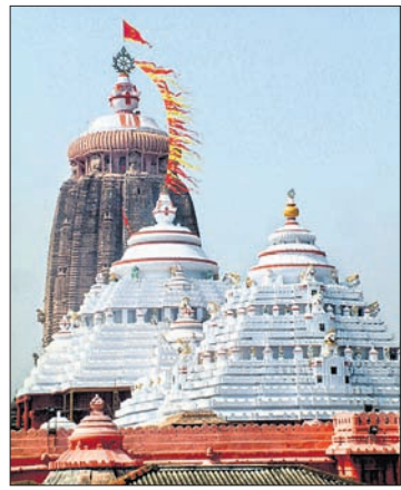
ଦୃଢ଼ କାର୍ଯ୍ୟାନୁଷ୍ଠାନ ଗ୍ରହଣ ଲାଗି ଜିଲାପାଳ ଏବଂ ଆରକ୍ଷା ଅଧିକାରୀଙ୍କୁ ଶ୍ରୀମନ୍ଦିର ମୁଖ୍ୟ

ପୁରୀରେ ମହାପ୍ରଭୁଙ୍କ ଜମି ନେଇ ଏକ ବଡ଼ କେଳେକାରୀ ସାମ୍ରାଜ୍ୟ ଆସିଛି। କେତେକଜଣ ଜମି ଦଲାଲ୍ ମହାପ୍ରଭୁଙ୍କ ୧୦୯ଟି ପୁତ୍ରକୁ ବେଆଇନ ଭାବେ ଜବରଦଖଲ କରି ଅନ୍ୟମାନଙ୍କୁ ହସ୍ତାନ୍ତର କରିଥିବା ଶ୍ରୀମନ୍ଦିର ପ୍ରଶାସନ ପକ୍ଷରୁ ବାସ୍ତବ୍ୟ ସାହି ଥାନାରେ ଲିଖିତ ଅଭିଯୋଗ ହୋଇଛି। ଏହି କେଳେକାରୀରେ ସମ୍ପୃକ୍ତ ବ୍ୟକ୍ତି ବିଶେଷକ ବିରୋଧରେ ଦୃଢ଼ କାର୍ଯ୍ୟାନୁଷ୍ଠାନ ନେବାକୁ ଅନୁରୋଧ କରାଯାଇଛି। ଏହି ଘଟଣା ଜଣାପଡ଼ିବା ପରେ ସେବାୟତଙ୍କଠାରୁ ଆରମ୍ଭ କରି ବୁଦ୍ଧିଜୀବୀମାନେ ଅସନ୍ତୋଷ ପ୍ରକାଶ କରିଛନ୍ତି।