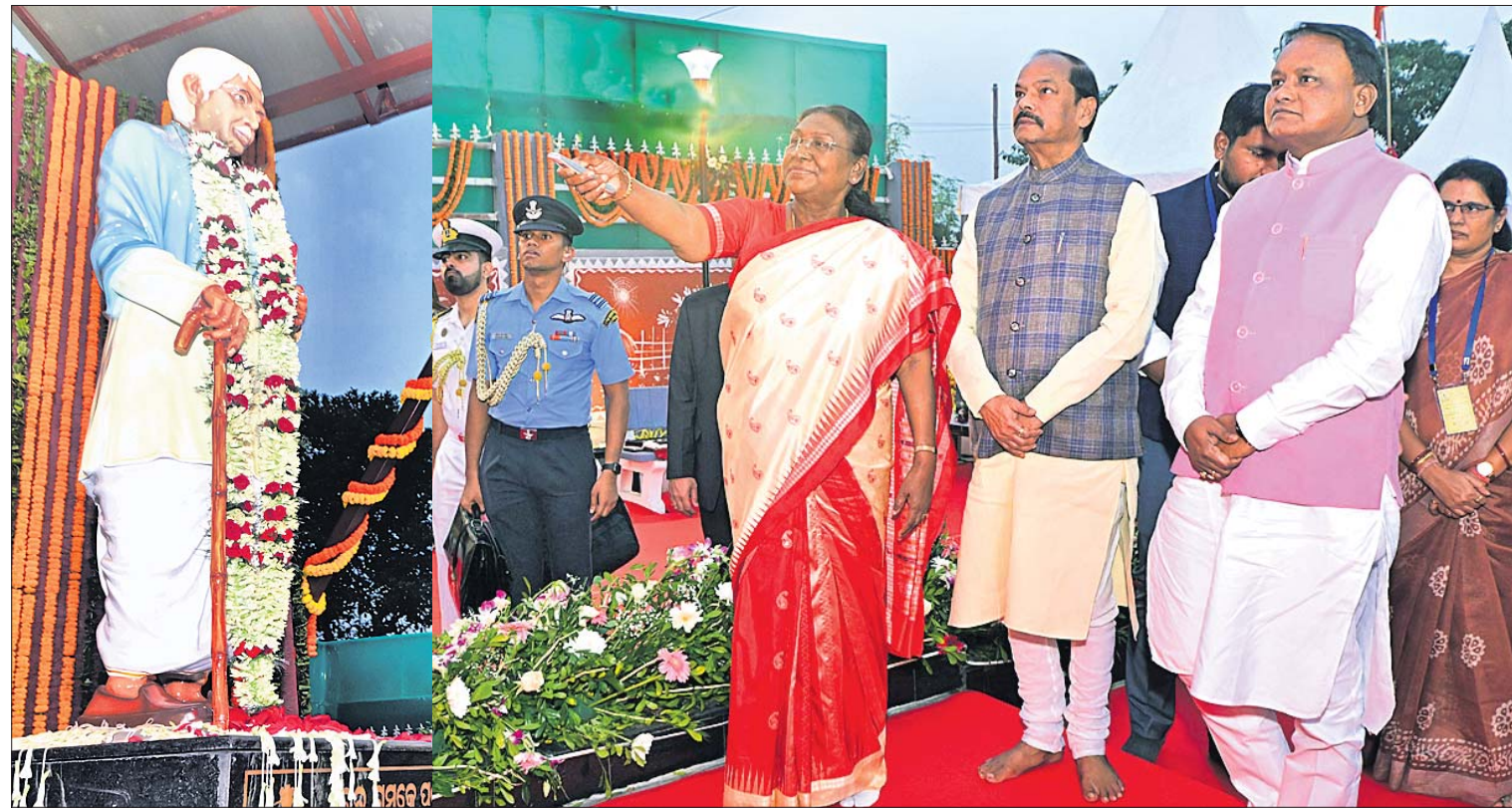
ଭୁବନେଶ୍ୱର ନିକାଡ୍ରାବିହାରସ୍ଥିତ ଆଦିବାସୀ ଦେବସ୍ଥାନ 'ଜାହିରା' ପୀଠରେ ମଙ୍ଗଳବାର ପଞ୍ଚମ ରତ୍ନାକର ମୁର୍ତ୍ତିଙ୍କ ପୂର୍ଣ୍ଣବୟସ୍କ ଅନାବରଣ କରୁଛନ୍ତି ରାଷ୍ଟ୍ରପତି ଦ୍ରୌପଦୀ ମୁର୍ତ୍ତି। ନିକଟରେ ଅଛନ୍ତି ରାଜ୍ୟପାଳ ରଘୁବର ଦାସ, ପୁଖ୍ୟମନ୍ତ୍ରୀ ମୋହନ ଚରଣ ମାଝୀ, ଉପପୁଖ୍ୟମନ୍ତ୍ରୀ ପ୍ରଭାତୀ ପରିଡ଼ା ଓ ଅନ୍ୟମାନେ ।