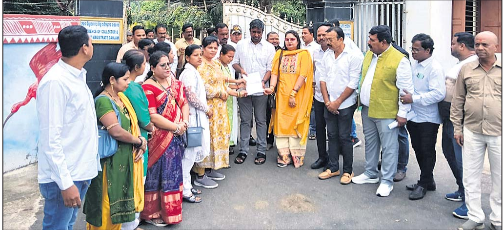
କର୍ପୋରେଟରମାନେ ଜିଲ୍ଲାପାଳଙ୍କୁ ଦାବିପତ୍ର ପ୍ରଦାନ କରୁଛନ୍ତି।

ବିଜଏମ୍‌ସିରେ ହରିଶ୍ଚନ୍ଦ୍ର ଯୋଜନା ଠିକ ଭାବେ କାର୍ଯ୍ୟକାରୀ ହୋଇପାରେ ନାହିଁ। ଯୋଜନା ବାବଦକୁ ୪ ହଜାର ଟଙ୍କା ଆର୍ଥିକ ଅନୁଦାନ ଠିକ ସମୟରେ ଦିଆଯାଇ ନାହିଁ।