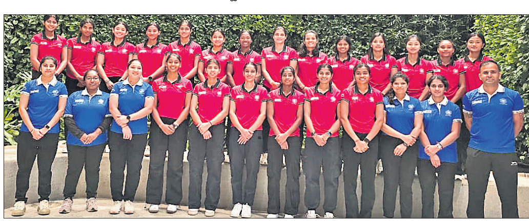
କ୍ରିଡ଼ର ମହିଳା ଏସିଆ କପ ହକି ଚୁନାବେଳେ ପାଇଁ ମଙ୍ଗଳବାର ଓମାନ ଯାତ୍ରା ପୂର୍ବରୁ ଭାରତୀୟ ଦଳ।

ଭୁବନେଶ୍ୱର, ୩୧୨ (ତପନ ସାହୁ) ସର୍ବଭାରତୀୟ ଚେଷ୍ଟା ସଂଘ (ଏଆଇସିଏସ୍) ସହଯୋଗରେ କ୍ରିଡ଼ ବିଶ୍ୱବିଦ୍ୟାଳୟର ବିଶ୍ୱନାଥୀୟ ଆନ୍ଦ ଅନ୍ତର୍ଜାତୀୟ ଚେଷ୍ଟା ହଲରେ ଚାଲିଥିବା ଅନ୍ତର୍ଜାତୀୟ ଚେଷ୍ଟା ମହୋତ୍ସବ 'ଏ' ବର୍ଗର ୨ଟି ରାଉଣ୍ଡ ଖେଳ ମଙ୍ଗଳବାର ଅନୁଷ୍ଠିତ ହୋଇଯାଇଛି।