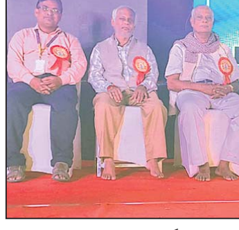
କାର୍ଯ୍ୟକ୍ରମରେ ମହାସଂଘ ଅତିଥି।

ଶ୍ରବଣର ବିଶ୍ୱ ଭିକ୍ଷାମୟ ଦିବସ ଚାଳିତ ହୋଇଛି। ଏବେ ଭିକ୍ଷାମୟ ପ୍ରୋକ୍ସାହନ ଦେଲେ ସମାଜ ବିକଶିତ ହେବ।