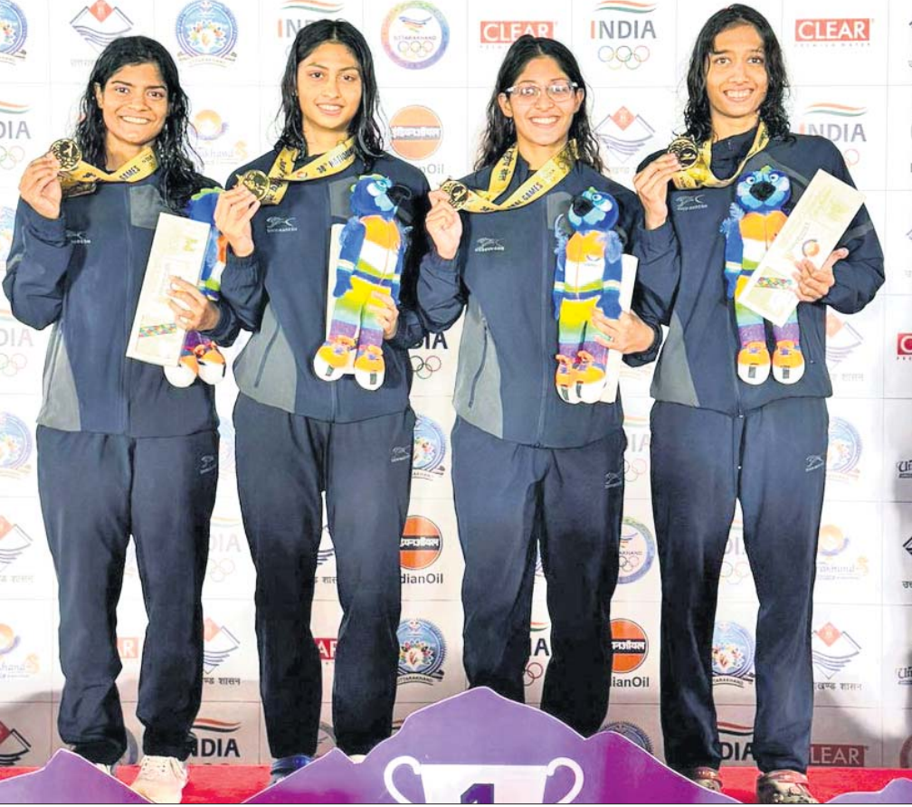
ଉତ୍ତରାଖଣ୍ଡରେ ଚାଲିଥିବା ଜାତୀୟ କ୍ରୀଡ଼ାର ୪୪୧୦୦ ମହିଳା ମିଡ୍‌ଲେ ରିଲେରେ ସ୍ୱର୍ଣ୍ଣପଦକ ବିଜୟୀ ଓଡ଼ିଶା ଦଳ।

୫୪-୦ରେ ହରାଇଥିବାବେଳେ ପରାସ୍ତ କରିଛି। ସେହିପରି ଓଡ଼ିଶା ୨୧ ପଏଣ୍ଟ ବ୍ୟବଧାନରେ ହରାଇ ପୁରୁଷ ଦଳ ୩୬-୦ରେ ଉତ୍ତରାଖଣ୍ଡକୁ ମହିଳା ଖୋ ଖୋ ଦଳ ବିଜ୍ଞାକୁ ୩୦- ସେମିଫାଇନାଲରେ ପହଞ୍ଚିଛି।