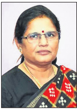
ଶ୍ରୀମତୀ ପ୍ରଭାତୀ ପରିଡ଼ା ଉପ ମୁଖ୍ୟମନ୍ତ୍ରୀ, ଓଡ଼ିଶା

ପୁରୁଷପ୍ରଧାନ ସମାଜରେ ପୁରୁଷମାନଙ୍କ ଉପରେ କେବଳ ଦୃଷ୍ଟି ଦିଆଯାଇ ଆସିଛି। ସମାଜର ସମସ୍ତ ଉପାଦାନ ଓ ଉନ୍ନତିରତା ପାଇଁ ପୁରୁଷମାନଙ୍କ ଉପରେ ଧ୍ୟାନ ଦିଆଯାଇ ଆସିଛି। ମହିଳାଙ୍କ ସମ୍ପର୍କରେ କେବଳ ଶାନ୍ତି ଓ ମାୟା ମାନାଯାଇ ଆସିଛି। କିନ୍ତୁ ମହିଳାଙ୍କର ମନସ୍ତତ୍ତ୍ୱ, ସାମ୍ମିତି ଓ ପ୍ରତିକାରକ ଶକ୍ତିର ଉପରେ ଆଜି ଧ୍ୟାନ ଦିଆଯାଉଛି। ରାଜ୍ୟର ସମସ୍ତ ସମାଜିକ ଓ ନୀତିଗତ କ୍ଷେତ୍ରରେ ମହିଳାଙ୍କର ଅବଦାନ ଉପରେ ଧ୍ୟାନ ଦିଆଯାଉଛି। ମହିଳାଙ୍କର ସମ୍ପର୍କରେ ଧ୍ୟାନ ଦିଆଯାଉଛି। ମହିଳାଙ୍କର ସମ୍ପର୍କରେ ଧ୍ୟାନ ଦିଆଯାଉଛି।