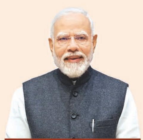
ଶ୍ରୀ ନରେନ୍ଦ୍ର ମୋଦୀ ପ୍ରଧାନମନ୍ତ୍ରୀ