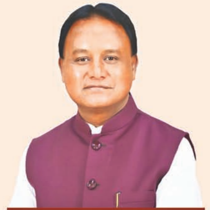
ଶ୍ରୀ ମୋହନ ଚରଣ ମାଝୀ ମୁଖ୍ୟମନ୍ତ୍ରୀ, ଓଡ଼ିଶା