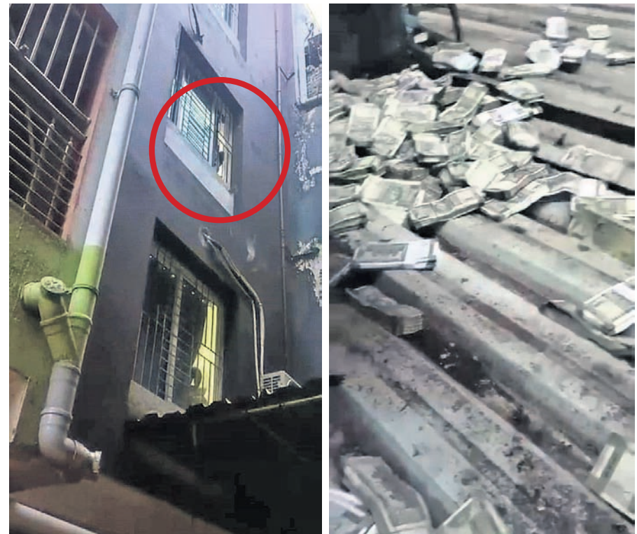
ଝରକାରୁ (ବୁଦ୍ଧ ଚିହ୍ନିତ) ଚଳେ ଥିବା ଆଜିବେଶ୍ୱର ଉପରକୁ ଟଙ୍କା ବିଡ଼ା ଫିଙ୍ଗାଯାଇଛି।

ଅଫିସ୍ ଚାନ୍ଦ ଓ ଅନୁଗୋଳ ଜିଲ୍ଲା ଲୋକେଲପଣି ଗ୍ରାମସ୍ଥିତ ଚୈତ୍ରେକପୁର, ଶିକ୍ଷକପତାୟିତ ସମ୍ପର୍କୀୟଙ୍କ ଘର ଆଦି ରହିଛି। ସନ୍ଧ୍ୟା ସୁଦ୍ଧା ହୋଇଥିବା ଯାହାରୁ ବୈକୁଣ୍ଠ ୧୫ କୋଟିରୁ ଅଧିକ ସ୍ତ୍ରୀବର ଓ ଅସ୍ଥାବର ସମ୍ପତ୍ତି ଠାବ କରିଥିବା ସୂଚନା ମିଳିଛି। ତେବେ ଭିଜିଲାନ୍ସ ଟିମ୍ମକୁ ଦେଖି ବୈକୁଣ୍ଠ ଭୁବନେଶ୍ୱର ଡୁମ୍ପିଂଗ୍ରାଉଣ୍ଡିଂ ପ୍ଲାନ୍ ଉପର କାଟେ ବିଡ଼ା ବିଡ଼ା ୫୦୦ ଟଙ୍କା ନୋଟ୍ (କୋଟିଏରୁ ଉର୍ଦ୍ଧ୍ୱ) ଫିଙ୍ଗି ଦେଇଥିଲେ, ଯାହାର ଭିତ୍ତି ଓ ସୋସିଆଲ ମିଡ଼ିଆରେ ଭାଇରାଲ ହେଉଛି। ଏଥିସହ ଯନ୍ତ୍ରୀ ଦାମୀ ହାତସତ୍ତି ସତ୍ତାକ ରଖୁଥିଲେ ବୋଲି ଜଣାପଡ଼ିଛି।