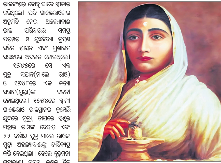
ରାଣୀ ଅହଲ୍ୟାବାଇ ହୋଲ୍‌କର

ପୁରୁଷପ୍ରଧାନ ସମାଜରେ ପୁରୁଷମାନଙ୍କ ଉପରେ କେବଳ ଦୃଷ୍ଟି ଦିଆଯାଇ ଆସିଛି। ସମାଜର ସମସ୍ତ ଉପାଦାନ ଓ ଉନ୍ନତିରତା ପାଇଁ ପୁରୁଷମାନଙ୍କ ଉପରେ ଧ୍ୟାନ ଦିଆଯାଇ ଆସିଛି। ମହିଳାଙ୍କ ସମ୍ପର୍କରେ କେବଳ ଶାନ୍ତି ଓ ମାୟା ମାନାଯାଇ ଆସିଛି। କିନ୍ତୁ ମହିଳାଙ୍କର ମନସ୍ତତ୍ତ୍ୱ, ସାମ୍ମିତି ଓ ପ୍ରତିକାରକ ଶକ୍ତିର ଉପରେ ଆଜି ଧ୍ୟାନ ଦିଆଯାଉଛି। ରାଜ୍ୟର ସମସ୍ତ ସମାଜିକ ଓ ନୀତିଗତ କ୍ଷେତ୍ରରେ ମହିଳାଙ୍କର ଅବଦାନ ଉପରେ ଧ୍ୟାନ ଦିଆଯାଉଛି। ମହିଳାଙ୍କର ସମ୍ପର୍କରେ ଧ୍ୟାନ ଦିଆଯାଉଛି। ମହିଳାଙ୍କର ସମ୍ପର୍କରେ ଧ୍ୟାନ ଦିଆଯାଉଛି।