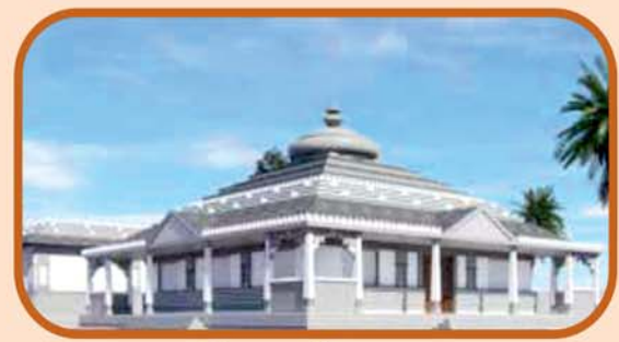
ପ୍ରସ୍ତାବିତ ତୀର୍ଥ ଯାତ୍ରୀ କେନ୍ଦ୍ର

ଓଡ଼ିଶା ସେତୁ ଓ ନିର୍ମାଣ ନିଗମ ଲିଃ., ନିର୍ମାଣ ବିଭାଗ, ଓଡ଼ିଶା ସରକାର