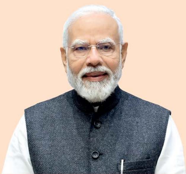
ଶ୍ରୀ ନରେନ୍ଦ୍ର ମୋଦୀ ପ୍ରଧାନମନ୍ତ୍ରୀ

ରାଜ୍ୟର ୩୧୪ଟି ଓଡ଼ିଆ ଆବର୍ଣ୍ଣ ବିଦ୍ୟାଳୟ (ଓଏଭି)ରେ ଓଡ଼ିଆ ଶିକ୍ଷକ ନିୟୁତ୍ ହେବେ। ସମସ୍ତ ଓଏଭିରେ ଜଣେ ଲେଖାଏ ଓଡ଼ିଆ ପ୍ରଶିକ୍ଷିତ ସ୍ନାତକ ଶିକ୍ଷକ (ଟିଚିଟି) ନିୟୁତ୍ ପାଇଁ ନୂତନ ପଦ ସୃଷ୍ଟି ହୋଇଛି।