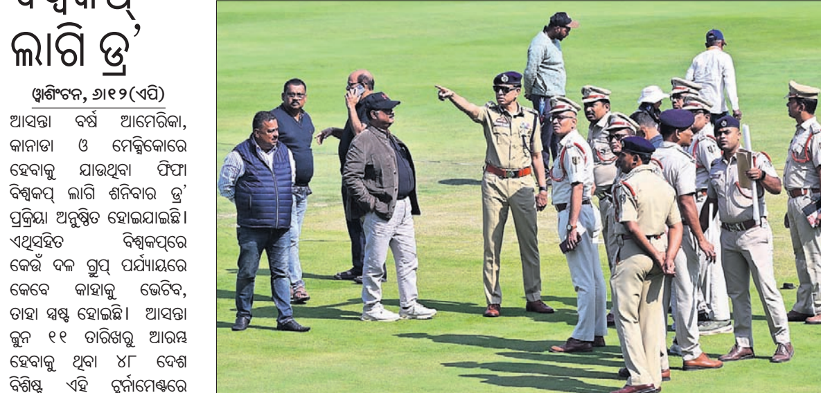
ପୋଲିସ୍ ଅଧିକାରୀମାନେ ପୁରୁଷା ବ୍ୟବସ୍ଥା ଯାଞ୍ଚ କରୁଛନ୍ତି ।