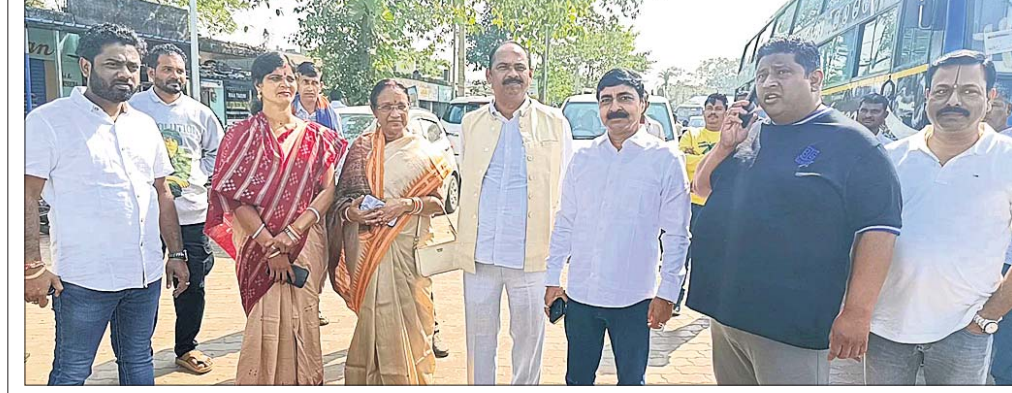
ଭୁବନେଶ୍ୱର ସିବା ପାଇଁ ଭଦ୍ରକ ନୂଆ ବସ୍ଷାଣରେ ପ୍ରସାସକାନ୍ତି ସାମଲଙ୍କ ସହ ଅନ୍ୟ ନେତା ଓ କର୍ମୀ ।