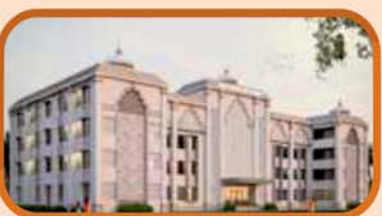
ପ୍ରସ୍ତାବିତ ଯାତ୍ରୀ ନିବାସ