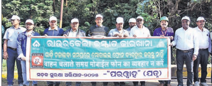
ଆରୁପ୍ତ ଅଧିକାରୀ ଓ କର୍ମଚାରୀ ମାନବ ଶୃଙ୍ଖଳରେ ରହିଛନ୍ତି।

ରାଉରକେଲା, ୬।୧୨ (ବିପ୍ଳବ ରଞ୍ଜନ ଦାଶ) ବାର୍ତ୍ତା ପ୍ରଦର୍ଶନ କରୁଥିବା ପୂର୍ବରୁ ଧରି ଏକ ସୁଦର୍ଶ ମାନବ ଶୃଙ୍ଖଳ ଗଠନ କରିଥିଲେ। ଗ୍ରାମିକ ନିୟମର ସଠିକ ଅନୁପାଳନ କରିବା, ସୁରକ୍ଷିତ ସହ ସଡ଼କ ନିୟମାବଳୀ ମାନିବାର ଅଭ୍ୟାସ କରିବା, ଗାଡ଼ିଚଳାଇବା ସମୟରେ ମୋବାଇଲ୍ ଫୋନ୍ ବ୍ୟବହାର ନ କରିବା, ଅସୁରକ୍ଷିତ ଓଭରଟେକିଂକୁ ନିବୃତ୍ତ ରହିବା, ଗ୍ରାମିକ ସିଗ୍ନାଲ ପାଳନ କରିବା, ବିପଦସୂଚୀ ଗାଡ଼ି ଚାଳନା ଅଭ୍ୟାସକୁ ଦୂରରେ ରଖିବା ନିର୍ଦ୍ଧାରିତ ଗତି ସାମା ବଜାୟ ରଖିବା ଭଳି ଅତ୍ୟାବଶ୍ୟକ ଦିଗଗୁଡ଼ିକ ଉପରେ ଗୁରୁତ୍ୱ ଦିଆଯାଇଥିଲା। ଇସ୍ତାତ ସହରାଞ୍ଚଳ ବାସିନ୍ଦା ଏବଂ ବାହନ ଚାଳକଙ୍କ ମଧ୍ୟରେ ବାସ୍ତବିକ ସୃଷ୍ଟି ସଡ଼କ ସୁରକ୍ଷା ସଂସ୍କୃତିକୁ ପ୍ରୋତ୍ସାହିତ କରିବା ଏହି ପଦକ୍ଷେପର ଲକ୍ଷ୍ୟ ରହିଥିଲା।