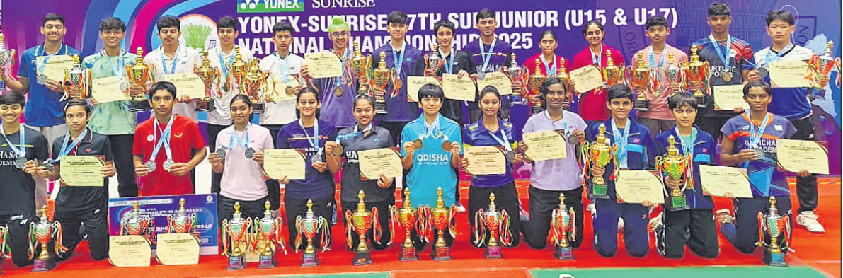
ପୁରୁଷାର ସହ କୁଟା ପ୍ରତିଯୋଗୀମାନେ ଅତିଥିକ ରତ୍ନରେ ।