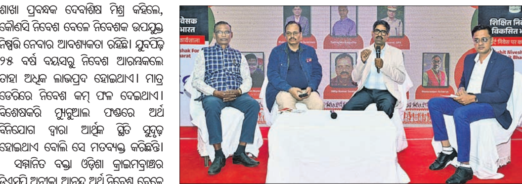
କାର୍ଯ୍ୟକ୍ରମରେ ଯୋଗ ଦେଇଥିବା ପ୍ୟାନେଲିଷ୍ଟ।