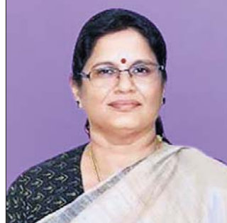
ଉପମୁଖ୍ୟମନ୍ତ୍ରୀ ପ୍ରଭାତୀ ପରିଡ଼ା

ରାଜ୍ୟ ସରକାର ପ୍ରଥମେ ୫, ପରେ ୭ ଓ ୧୨ ଲକ୍ଷ ଟଙ୍କା ଅଜ୍ଞାନତ୍ରାଡ଼ି କେନ୍ଦ୍ର ନିର୍ମାଣ ପ୍ରଥମେ ଦେଉଥିଲେ । ଏବେ ଅଜ୍ଞାନତ୍ରାଡ଼ି କେନ୍ଦ୍ର ନିର୍ମାଣ ଲାଗି ସରକାର ୧୫ ଲକ୍ଷ ଟଙ୍କା ପର୍ଯ୍ୟନ୍ତ ଦେଉଛନ୍ତି ।