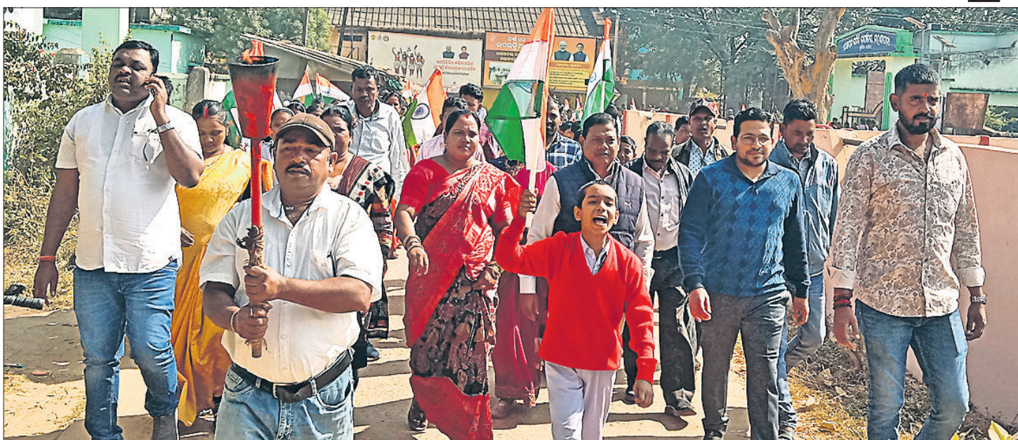
ଅତିଥି ଓ ଛାତ୍ରାଛତ୍ରମାନେ ମଶାଳ ଶୋଭାଯାତ୍ରାରେ ଯାଉଛନ୍ତି।

ଲୁହାପତା, ୬୧୨ (ବାରମ୍ବାର ପଢ଼ା) ସୁନ୍ଦରଗଡ଼ ଜିଲ୍ଲା ସାଂସଦ ଶ୍ରେଣୀର ଲୁହାପତା ବ୍ଲକ୍ରେ ଶନିବାର ସାଂସଦ ଖେଳ ମହୋତ୍ସବ ଓ ମଶାଳ ଶୋଭାଯାତ୍ରା ଅନୁଷ୍ଠିତ ହୋଇଯାଇଛି।