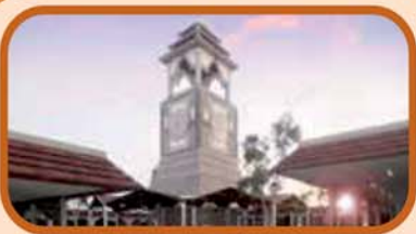
ପ୍ରସ୍ତାବିତ ମାର୍କେଟ୍ କମ୍ପ୍ଲେକ୍ସ