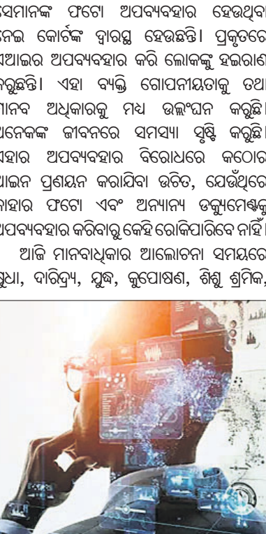
କୃତ୍ରିମ ବୁଦ୍ଧିମତ୍ତା ମାନବାଧିକାରର ପରିଭାଷାକୁ ଏକ ନୂତନ ପ୍ରଭାବ ଦେଖାଉଛି। କୁଟ୍ରିମ୍ ବୁଦ୍ଧିମତ୍ତା ସବୁଠାରୁ ବିପଦପୂର୍ଣ୍ଣ ବିନା ହେଉଛି ଏହା ନିଜକୁ ନିରପେକ୍ଷ ବୋଲି ଦାବି କରେ, କିନ୍ତୁ ତଥ୍ୟ ଏବଂ ଆଲଗୋରିଦମ୍ ସମାଜର ପକ୍ଷପାତୀ ମାନସିକତାକୁ ପୂର୍ଣ୍ଣ ରୁହେଁ। ଯଦି ତଥ୍ୟ ପକ୍ଷପାତୀ ହୁଏ, ତେବେ ଏଆଇ ସେହି ପକ୍ଷପାତକୁ ବୈଜ୍ଞାନିକ ସତ୍ୟରେ ପରିଣତ କରିବ। ଏହି ପ୍ରଭୃତିବିଦ୍ୟା କେତେକ ସମୟରେ ଶକ୍ତି ଶକ୍ତିର ସବୁଠାରୁ ଶକ୍ତିଶାଳୀ ସହଯୋଗୀ ମଧ୍ୟ ହୋଇପାରେ। ଏହା ପ୍ରଭୃତିବିଦ୍ୟାର ଏକ ପ୍ରକାର

ସେମାନଙ୍କ ଫଟୋ ଅପବ୍ୟବହାର ହେଉଥିବା ନେଇ କୋର୍ଟ ଦ୍ୱାରା ହେଉଛି। ପ୍ରକୃତରେ ଏଆଇର ଅପବ୍ୟବହାର କରି ଲୋକଙ୍କୁ ହଇରାଣ କରୁଛନ୍ତି। ଏହା ବ୍ୟକ୍ତି ଗୋପନୀୟତାକୁ ତଥା ମାନବ ଅଧିକାରକୁ ମଧ୍ୟ ଉଲ୍ଲଙ୍ଘନ କରୁଛି। ଅନେକଙ୍କ ଜୀବନରେ ସମସ୍ୟା ସୃଷ୍ଟି କରୁଛି। ଏହାର ଅପବ୍ୟବହାର ବିରୋଧରେ କଠୋର ଆଇନ ପ୍ରଣୟନ କରାଯିବା ଉଚିତ, ଯେଉଁଥିରେ କାହାର ଫଟୋ ଏବଂ ଅନ୍ୟାନ୍ୟ ତଥ୍ୟମାନଙ୍କୁ ଅପବ୍ୟବହାର କରିବାକୁ କେହି ରୋକିପାରିବେ ନାହିଁ। ଆଜି ମାନବାଧିକାର ଆଲୋଚନା ସମୟରେ ଷ୍ଟ୍ରୀୟା, ଦାରିଦ୍ର୍ୟ, ମୁକ୍ତ, କୁସପେକ୍ଷଣ, ଶିଶୁ ଶ୍ରମିକ,