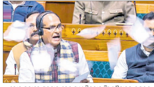
ଲୋକ ସଭାରେ ଗୁରୁବାର କେନ୍ଦ୍ର ମନ୍ତ୍ରୀ ଶିବରାଜ ସିଂ ଚୌହାନଙ୍କ ଉପରକୁ ବିରୋଧୀ ସଦସ୍ୟମାନେ ବିଲ୍ ନକଲ ଚିରି ଫୋପାଡ଼ୁଥିବାର ଦୃଶ୍ୟ।

ଲୋକ ସଭାରେ ଗୁରୁବାର ପ୍ରବଳ ବିରୋଧ ମଧ୍ୟରେ ବିଲ୍-ଜି ରାମ୍ ଜି ବିଲ୍- ୨୦୨୫ ଗୃହୀତ ହୋଇଛି। ୨୦ ବର୍ଷର ମହାତ୍ମା ଗାନ୍ଧୀ ଜାତୀୟ ଗ୍ରାମାଣ ନିରୀକ୍ଷିତ କର୍ମନିମ୍ନ ଆଇନ (ଏମ୍.ଜି.ଏନ୍.ଆଇ.ଏ) ସ୍ଥାନରେ ଏହାକୁ କାର୍ଯ୍ୟକାରୀ କରାଯିବ। ଏମ୍.ଜି.ଏନ୍.ଆଇ.ଏକୁ ବଦଳାଇବାକୁ ଯାଇ ସରକାର ମହାତ୍ମା ଗାନ୍ଧୀଙ୍କୁ ଅପମାନିତ କରିଥିବା ବିରୋଧୀ ଏମ୍.ପି.ମାନେ ଅଭିଯୋଗ କରିଛନ୍ତି। ବିଲ୍ ଆଲୋଚନାରେ ଭାଗନେଇ କେନ୍ଦ୍ର ଗ୍ରାମାଣ ବିଭାଗ ମନ୍ତ୍ରୀ ଶିବରାଜ ସିଂ ଚୌହାନ କହିଥିଲେ, ୨୦୦୯