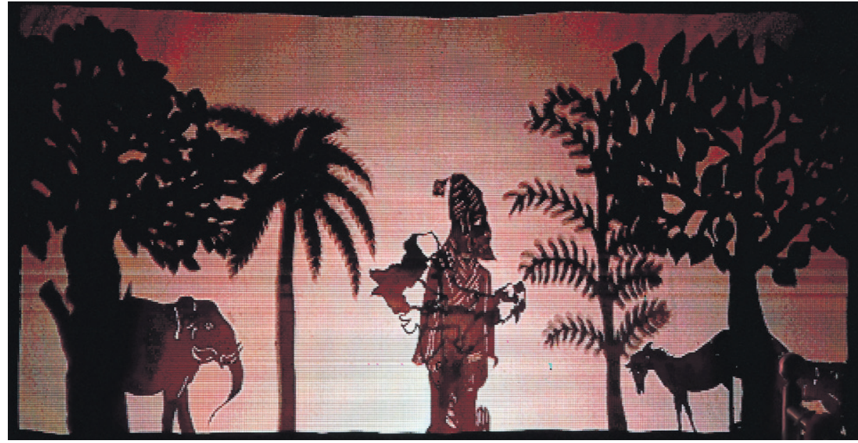
ଓଡ଼ିଆ ଭାଷା, ସାହିତ୍ୟ ଓ ସଂସ୍କୃତି ବିଭାଗ ଆନୁକୂଲ୍ୟରେ ଓଡ଼ିଶା ସଙ୍ଗୀତ ନାଟକ ଏକାଡେମୀ ପକ୍ଷରୁ ଗୁରୁବାର ଭଜନକଳା ମଣ୍ଡପରେ ଆରମ୍ଭ ହୋଇଥିବା 'ଜାତୀୟ କଣ୍ଠେଇ ନାଟ ଭସବ'ରେ ପରିବେଷିତ ହୋଇ କଣ୍ଠେଇ ନାଟକ 'ବନ୍ଦେ ମାତରମ'ର ପୁରୁଣା ପୃଷ୍ଠା ।