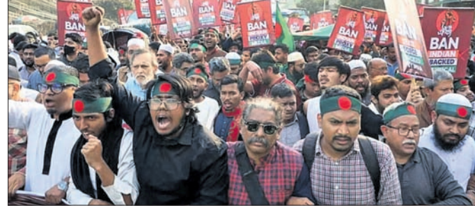
ରାଜଶାହିରେ ଭାରତ ବିରୋଧୀ ସ୍ଲୋଗାନ ଦେଉଛନ୍ତି ବିକ୍ଷୋଭକାରୀ।

ଦିଲ୍ଲୀର ମୁକ୍ତ କାଟିଦେବୁ: ଛାତ୍ରନେତାଙ୍କ ଧମକ