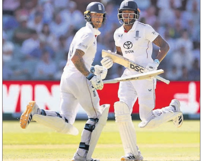
ବେନ୍ ଷ୍ଟୋକ୍ ଓ ଗୋଟ୍ରା ଆର୍ଟର।

ଭୁବନେଶ୍ୱର ଅଷ୍ଟ୍ରେଲିଆ ଟୀମ୍ ଅଧ୍ୟାପକ ପ୍ରଥମ ଇନିଂସ୍ ଫୋର୍ମାଟ୍ ୩୨୬/୮୭ ବ୍ୟାଟିଂ ଆରମ୍ଭ କରି ବଳକା ୨ ଉତ୍ତମକେନ୍ଦ୍ରୀ ଦକ୍ଷିଣ ଆମେରିକାରେ ୪୫ ରନ ଯୋଡ଼ିଥିଲେ। ପୂର୍ବଦିନ ଅପରାଜିତ ଥିବା ବ୍ୟାଟର ମିଚେଲ ଷ୍ଟାର୍କ ୪୪ ଓ ଏନ୍‌ଏଚ୍ ବୋଲୋ ୧୪ ରନ କରି ଆଡ଼େ ହୋଇଥିଲେ। ଇଂଲଣ୍ଡ ପକ୍ଷରୁ ଗୋଟ୍ରା ଆର୍ଟର ୫ ଉତ୍ତମକେନ୍ଦ୍ରୀ ହୋଇଥିବା ବେଳେ ବ୍ରାଡ଼ବେନ କାର୍ଯ୍ୟ ଓ ଫ୍ଲିଲ୍ କ୍ୟାମ୍