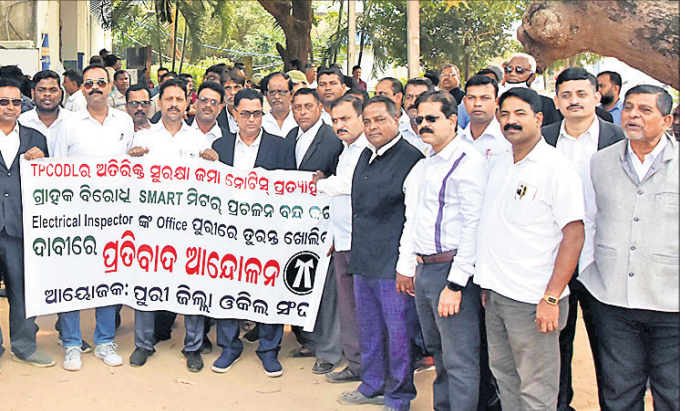
ଅତିରିକ୍ତ ସୁରକ୍ଷା କର୍ମୀ ନୋବିସ ପ୍ରତ୍ୟାହାର ସମ୍ପେଦ ବିଜି ନାବି ନେଇ ପୁରୀ ଓଜଳ ସଂପ୍ରଦାୟରୁ ଗୁରୁବାର ରେଡ଼କ୍ରସ୍ ରୋଡ଼ସ୍ଥିତ ଚାଟା ପାଖର ଅଫିସ୍ ସମ୍ମୁଖରେ ବିଶୋଭ ପ୍ରଦର୍ଶନ କରାଯାଇଛି।

ସମାକ୍ଷା କାର୍ଯ୍ୟକ୍ରମରେ ପୋଲିସର ବିଶିଷ୍ଟ ଅଧିକାରୀମାନେ ଉପସ୍ଥିତ ରହି ସମ୍ପୃକ୍ତ ଥାନା ଅଧିକାରୀ ଓ କର୍ମଚାରୀମାନଙ୍କୁ ଆବଶ୍ୟକ ନିର୍ଦ୍ଦେଶନା ଦେଇଥିଲେ। ପୁରୀ ପୋଲିସ୍ ପକ୍ଷରୁ ନବବର୍ଷ ୨୦୨୬ ଅବସରରେ ଶ୍ରୀମନ୍ଦିରକୁ ଆସୁଥିବା ସମସ୍ତ ଶ୍ରୀକଳ୍ପକୁ ସହଯୋଗ କରିବା, ଶାନ୍ତିଶୃଙ୍ଖଳା ରକ୍ଷା କରିବା ଓ ସୁରକ୍ଷା ଦର୍ଶନ ସୁନିଶ୍ଚିତ କରିବା ପାଇଁ ସମସ୍ତ ପ୍ରସ୍ତୁତି ଗ୍ରହଣ କରାଯାଇଛି।