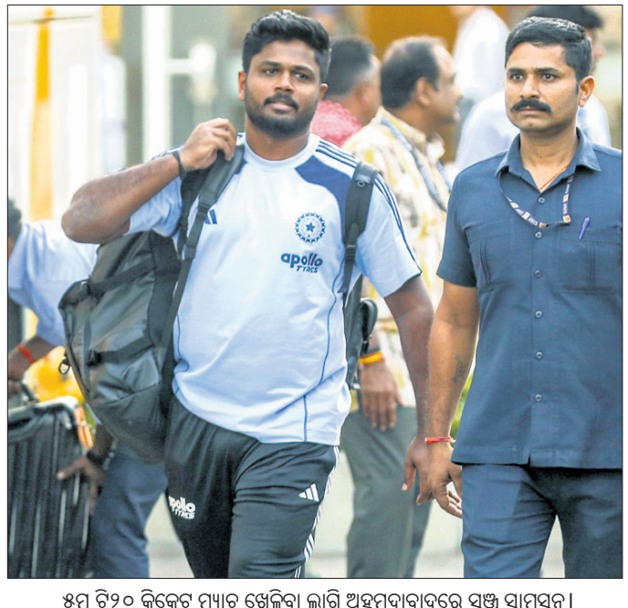
୫ମ ଟି୨୦ କ୍ରିକେଟ ମ୍ୟାଚ ଖେଳିବା ଲାଗି ଅହମଦାବାଦରେ ସଖି ସାମସଦ।

ଅହମଦାବାଦ, ୧୮୧୨ (ପି.ଟି.) ସ୍ଥାନୀୟ ନଗର ପୋଲିସ୍ ଥାନାରେ ଶୁକ୍ରବାର ଭାରତ ଓ ଦକ୍ଷିଣ ଆଫ୍ରିକା ମଧ୍ୟରେ ଅତିଥି ଚଳା ପଞ୍ଚମ ଟି୨୦ ମ୍ୟାଚ୍ ଖେଳାଯିବ। ସିରିଜରେ ଏବେ ୨-୧ରେ ଭାରତ ଆଗୁଆ ରହିଛି। ରୁଧିରା ନାଥ ଶେଖାରିଙ୍କୁ