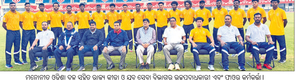
ମନୋନୀତ ଓଡ଼ିଶା ଦଳ ସହିତ ରାଜ୍ୟ କ୍ରୀଡ଼ା ଓ ସୁବ ସେବା ବିଭାଗର ଉଚ୍ଚପଦାଧିକାରୀ ଏବଂ ଫାଉଣ୍ଡେସନର ସଭ୍ୟମାନେ।

ଭୁବନେଶ୍ୱର, ୧୮୧୨ (ବିଜୟ ରଣା) ଈନ୍ଦ୍ରପ୍ରସାଦ ନାରାୟଣପୁର ଠାରେ ୧୯ତମ କାତୀୟ ପୁରୁଷଲ ଚାମ୍ପିୟନସିପ୍ ସନ୍ତୋଷ ଟ୍ରଫି ୨୦୨୪-୨୬ କ୍ୱାଲିଫାଇଂ ରାଉଣ୍ଡ ଖେଳି ଅନୁଷ୍ଠିତ ହେବ। ଏଥିରେ ଭାରତ ନେତା ପାଇଁ ପୁରୁଷଲ ଆସୋସିଏସନ ଅଫ୍ ଓଡ଼ିଶା (ଫାଓ) ତରଫରୁ ୨୦ ଜଣିଆ ଓଡ଼ିଶା ସିରିଜର ପୁରୁଷ ଦଳ ମନୋନୟନ କରାଯାଇଛି। ଦଳ ସହିତ ୪ଜଣ