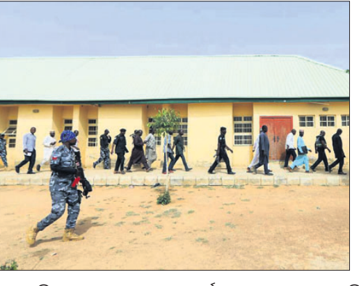
ନେଲକେରିଆର ଶିକ୍ଷା ବ୍ୟବସ୍ଥା ପିଲାଙ୍କ କମ୍ ଉପସ୍ଥାନକରଣ ସମସ୍ୟାକୁ ସାମ୍ନା କରୁଛି।

କିଟିବର୍ଷ ନଭେମ୍ବରରେ ନାଲକେରିଆର ବିଭିନ୍ନ ସ୍କୁଲକୁ ଅନେକ ଶହ ପିଲାଙ୍କୁ ଅପହରଣ କରାଯାଇଥିଲା। ସେହିମାନେ ଏବେ ବନ୍ଦୀ କିମ୍ବା ନିଖୋଜ। ତେବେ ନିକଟରେ ୧୦୦ ହାତ୍ରୁକୁ ଉଦ୍ଧାର କରାଯିବା ପରେ ସାମାନ୍ୟ ବିଶ୍ୱାସ ସୃଷ୍ଟି ହୋଇଛି। ଉତ୍ତର ଏବଂ କେନ୍ଦ୍ର ନାଲକେରିଆର ଅନେକ ଅଞ୍ଚଳରେ ସ୍କୁଲଗୁଡ଼ିକରେ ପିଲାଙ୍କ ଉପସ୍ଥାନ କମିଛି। ଅପହରଣ ଯୋଗୁ ସ୍କୁଲ ବନ୍ଦ ରହିବା କିମ୍ବା ଭୟରେ ଅଭିଭାବକମାନେ ପିଲାଙ୍କୁ ଘରେ ରଖିବା ଯୋଗୁ ଏଭଳି ସ୍ଥିତି ସୃଷ୍ଟି ହୋଇଥିବା କୁହାଯାଇପାରେ। କିନ୍ତୁ ୨୦୨୪ରେ ପ୍ରକାଶ ପାଇଥିବା ସ୍ଥାନୀୟ ଗଣମାଧ୍ୟମିକ ମିଡ଼ିଆ ସ୍ତମ୍ଭରେ ଅନେକ ପ୍ରସ୍ତାବ ନାଲକେରିଆ ସରକାର ଏବଂ ପାଣି ଯୋଗାଇଥିବା ଅଭିଭାବକମାନେ ସଂଗୁରୁକ୍ତ ସମ୍ପ୍ରଦାୟରେ ଉପସ୍ଥାନ କରାଯାଇଛି। ତୁରନ୍ତ ପ୍ରକାରରେ କାର୍ଯ୍ୟକାରୀ ଯୋଜନାରେ ଦିନ, ସେଫ୍ଟି ପ୍ରକାରରେ ନିର୍ଦ୍ଦେଶ ଦିଆଯାଇଛି, ନାଲକେରିଆର ୧୦ଟି ଜିଲ୍ଲାରେ ଯାସ୍ତ କରାଯାଇଥିବା ୧୭% ସ୍କୁଲ ପୂର୍ଣ୍ଣ ମାନଦଣ୍ଡର ଅତିକମରେ ୭୦% ପାଳନ କରିଥିଲେ। ନାଲକେରିଆର ପାଠ୍ୟପୁସ୍ତକ ସଂଗ୍ରହର ଉପସ୍ଥାନ କରାଯାଇଛି। ସର୍ବମୁଖ୍ୟତଃ ପୂର୍ବରୁ ଏହି ସ୍ଥିତିକୁ ସୁଧାରିବା ଉଚିତ। ସେ ପର୍ଯ୍ୟନ୍ତ, ସ୍କୁଲର ପୁରୁଣା ସମ୍ପତ୍ତି ଅନେକ ପ୍ରସ୍ତାବ ନାଲକେରିଆ ସରକାର ଏବଂ ପାଣି ଯୋଗାଇଥିବା ଅଭିଭାବକମାନେ ସଂଗୁରୁକ୍ତ ସମ୍ପ୍ରଦାୟରେ ଉପସ୍ଥାନ କରାଯାଇଛି। ନାଲକେରିଆର ଶିକ୍ଷା ବ୍ୟବସ୍ଥା ପିଲାଙ୍କ କମ୍ ଉପସ୍ଥାନକରଣ ସମସ୍ୟାକୁ ସାମ୍ନା କରୁଛି। କିନ୍ତୁ ପିଲାଙ୍କ ଅପହରଣ ବ୍ୟବସ୍ଥାରେ ଏକ ଗଠନ ସମସ୍ୟା, ଯାହା ଏବେ ସାଧାରଣ ଘଟଣା ପାଇଁ ଅତିବାହିତ। ଏମାନଙ୍କୁ ସମ୍ପୂର୍ଣ୍ଣ ଭାବରେ ନାଲକେରିଆ ସରକାରର ପୂର୍ବରୁ ୨୦୨୩ ଅନୁସୂଚୀ, ଉତ୍ତରପ୍ରଦେଶ ନାଲକେରିଆର ରାଜ୍ୟ କେନ୍ଦ୍ରରେ ୭୭% ବାଳିକା ଓ ୬୨% ବାଳକ ପ୍ରାଥମିକ ସ୍କୁଲରେ ନାମ ଲେଖାଇବାକୁ ଦିଆଯାଇଛି। ଉଲ୍ଲେଖନୀୟ, ଏହି ରାଜ୍ୟରେ ୨୦୨୩ରେ ୨୫ହାତ୍ରକୁ ଅପହରଣ କରାଯାଇଥିଲା। ମାଧ୍ୟମିକ ସ୍କୁଲଗୁଡ଼ିକରେ ମଧ୍ୟ ସମାନ ପ୍ରତିଷ୍ଠିତ ପିଲା