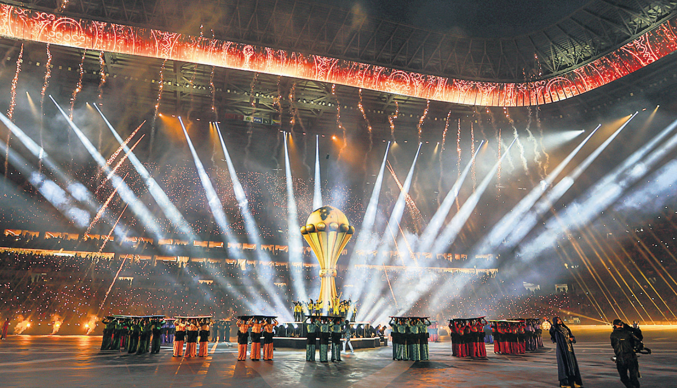
ମରୁବୋର ରାବାଟଠାରେ ଆଫ୍ରିକା କପ୍ ଅଫ୍ ନେଶନ୍ସ ଯୁବକ ଚାମ୍ପିୟନସିପ୍ ଉଦ୍‌ଘାଟନା ଉତ୍ସବରେ କଳାକାରମାନେ ନୃତ୍ୟ ପ୍ରଦର୍ଶନ କରୁଛନ୍ତି। ଗ୍ରୁପ୍ ‘ଏ’ରେ ସ୍ଥାନ ପାଇଥିବା ମରୁବୋ ଉଦ୍‌ଘାଟନା ମ୍ୟାଚରେ କୋମୋରୋସକୁ ୨-୦ ଗୋଲରେ ପରାସ୍ତ କରିଛି।

ସମ୍ପୂର୍ଣ୍ଣ ହୋଇଥିବା ଫ୍ରେସ୍‌କଣ୍ଟ୍ରୋଲ୍‌ର ୭୫୩ ବ୍ୟାଟରଙ୍କ ଷ୍ଟୋର ୨୫୩ ରନ କରିପାରି ନ ଥିଲା। ଫ୍ରେସ୍‌କଣ୍ଟ୍ରୋଲ୍ ଶାମାର କୋଶେଫ ଓ ଅଲକାରିକୋଶେଫଙ୍କ ବିନା ଏହି ମ୍ୟାଚ ଖେଳିଥିଲା। ଅନ୍ୟପକ୍ଷରେ ଆସିଡିକେଟ ସମସ୍ୟା ଯୋଗୁ ମ୍ୟାଚ୍ ହେନରୀ, ଡ୍ରିଲ୍ ଓ ରୁରକି, ବେନ୍ ସିଅର୍ସ, କାଲିଲ କେମିସନ, ନାଥାନ ସ୍ମିଥ୍ ଓ କ୍ଲେୟର ଟିକେନରଙ୍କ ଭଳି ଖେଳାଳିଙ୍କ ଅନୁପସ୍ଥିତିରେ ଡୁଫି ନ୍ୟୁଜିଲାଣ୍ଡ ପେସ୍ ବାହିନୀର ନେତୃତ୍ୱ ନେଇଥିଲେ। ତୃତୀୟ ଟେଷ୍ଟର ପରିସଂଖ୍ୟାନ ଉଲ୍ଲେଖନୀୟ ଥିଲା। ଡେଭିଡ୍ କନଫ୍ରେଜ୍ ୨୨୬ ଏବଂ ଟମ୍ ଲଥାମଙ୍କ ୧୩୭ ଏବଂ ସେମାନଙ୍କ ମଧ୍ୟରେ ଓପିନିଂ ଭାଗାଦାରିରେ ୩୨୩ରନ ଯୋଗଦାନ ଯୋଗୁ ନ୍ୟୁଜିଲାଣ୍ଡ ୫୭୫/୮ ସ୍କୋରରେ ଏହାର ପ୍ରଥମ ଇନିଂସ ଘୋଷଣା କରିଥିଲା। ଦ୍ୱିତୀୟ ଇନିଂସରେ କନଫ୍ରେଜ୍ ଓ ଲଥାମ ଯଥାକ୍ରମେ ୧୦୦ ଓ ୧୦୧ ରନ କରିଥିଲେ। ଦୁହେଁଙ୍କ ମଧ୍ୟରେ ୧୯୨ ରନର ପାର୍ଟନରସିପ୍ ହୋଇଥିଲା। ନ୍ୟୁଜିଲାଣ୍ଡ ୩୦୬/୨ ସ୍କୋରରେ ଏହାର ଦ୍ୱିତୀୟ ଇନିଂସ ଘୋଷଣା କରିଥିଲା। ଫ୍ରେସ୍‌କଣ୍ଟ୍ରୋଲ୍ ପ୍ରଥମ ଇନିଂସରେ ୪୨୦ରନ କରି ଅଲଆଉଟ ହୋଇଯିବା ବ୍ୟତୀତ ଦଳ ପାଇଁ ୪୬୨ରନର ବିଜୟ ଲକ୍ଷ୍ୟ ଧାର୍ଯ୍ୟ ହୋଇଯାଇଥିଲା। ଡେଭିଡ୍ କନଫ୍ରେଜ୍ ମ୍ୟାଚ ଅଫ ଦି ମ୍ୟାଚ ବିବେଚିତ ହୋଇଥିଲେ। ଗୋଟିଏ ଟେଷ୍ଟ ମ୍ୟାଚରେ ଦ୍ୱିଗତକ ଓ ଶତକ ହାସଲ କରିବାରେ କନଫ୍ରେଜ୍ ନ୍ୟୁଜିଲାଣ୍ଡର ପ୍ରଥମ ଖେଳାଳି ବିବେଚିତ ହୋଇଛନ୍ତି। ପୂର୍ବରୁ ଫ୍ରେସ୍‌କଣ୍ଟ୍ରୋଲ୍ ପ୍ରଥମ ଇନିଂସରେ ୪ ଉଇକେଟ ନେଇଥିବା ଜାକବ ଡୁଫି ଫ୍ଲୋୟର ଅଫ ଦି ସିରିଜ୍ ବିବେଚିତ ହୋଇଥିଲେ।