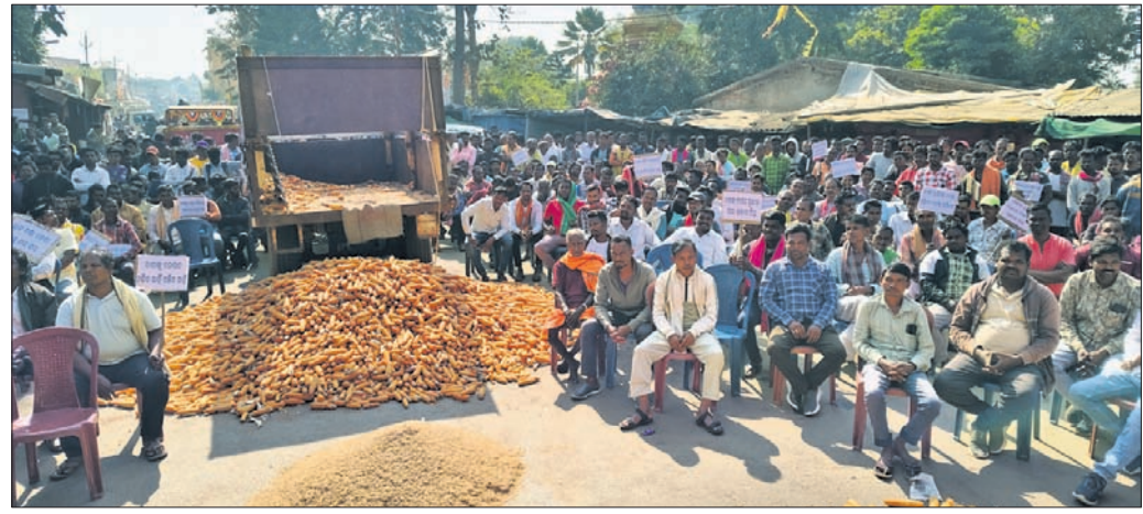
ଝରିଗାଁରେ ଚାଷୀ ଓ ରାଜନୈତିକ ଦଳର ନେତାମାନେ ପ୍ରତିବାଦ କରୁଛନ୍ତି।

■ ଧାନ, ମକା ଗଭାଉ ଧାରଣାରେ ଚାଷୀ ■ ସପ୍ତାହବାପୀ ଚକ ଅଣ ବନ୍ଦ ତାକରା ■ ସମର୍ଥନ ଜଣାଇ ଧାରଣାରେ ବସିଲେ ବିଜେଡି, କଂଗ୍ରେସ ନେତା