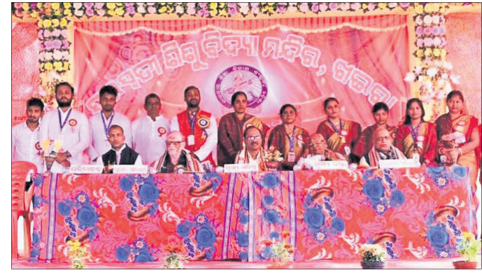
କେଳେ ବାପା କେଳେ ମା ସମ୍ମିଳନୀରେ ମହାସାଧନ ଅତିଥି।