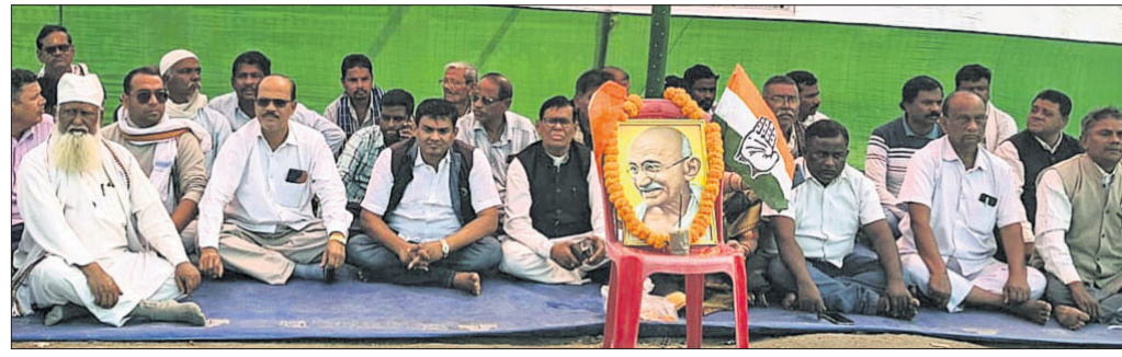
ଜିଲ୍ଲାପାଳଙ୍କ କାର୍ଯ୍ୟାଳୟ ସମ୍ମୁଖରେ ଧାରଣାତର କଂଗ୍ରେସ ନେତା ଓ କର୍ମୀମାନେ ।

ଏମ୍.ଜି.ଏନ୍.ଆର୍.ଇ.ଜି.ଏସ୍ ଯୋଜନା ନାମକରଣ ପରିବର୍ତ୍ତନର ପ୍ରତିବାଦ