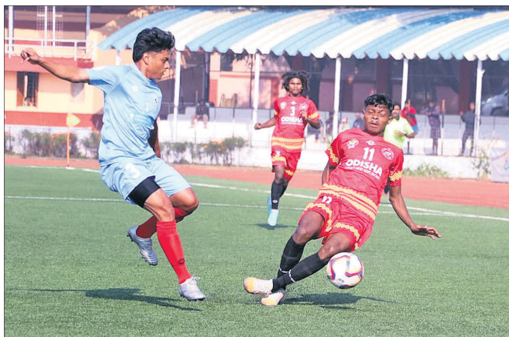
ଓଡ଼ିଶା ଓ ମଧ୍ୟପ୍ରଦେଶ ମଧ୍ୟରେ ଅନୁଷ୍ଠିତ ମ୍ୟାଚର ଏକ ସଂଘର୍ଷପୂର୍ଣ୍ଣ ମୁହୂର୍ତ୍ତ।