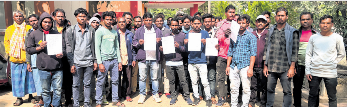
ଜିଲ୍ଲାପାଳଙ୍କୁ ଦାବିପତ୍ର ଦେବାକୁ ଆସିଥିବା ଗ୍ରାମବାସୀ।