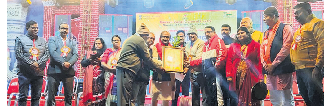
ଉଦ୍‌ଘାଟନା ଉତ୍ସବରେ ଉପସ୍ଥିତ ଅତିଥି।

ଓଡ଼ିଶା-ପଶ୍ଚିମବଙ୍ଗ ମଧ୍ୟରେ ସମନ୍ୱୟ ରକ୍ଷା ପାଇଁ ଜଲେଶ୍ୱର ସୀମାନ୍ତ ଗ୍ରାମୀଣ ମହୋତ୍ସବ ଏକ ସେତୁ ଭାବେ କାମ କରୁଛି। ଜଲେଶ୍ୱରରେ ହୁଇ ଦଶନ୍ଧି ଧରି ଏପରି ମହୋତ୍ସବ ଆୟୋଜିତ ହେଉଥିବାରୁ ଏହା ଜଲେଶ୍ୱର ସମେତ ଆଖପାଖ ଅଞ୍ଚଳର ସାମାଜିକ ଓ ଅର୍ଥନୈତିକ ବିକାଶକୁ ବାଟ କଢ଼ାଇ ନେଉଛି ବୋଲି ରବିବାର ସମ୍ବନ୍ଧୀୟ ଆୟୋଜିତ ଜଲେଶ୍ୱର ସୀମାନ୍ତ ଗ୍ରାମୀଣ ମହୋତ୍ସବ-୨୦୨୫ ଓ ଉତ୍କଳବଙ୍ଗ ମିତ୍ରୀ ଉତ୍ସବର ଉଦ୍‌ଘାଟନା ଉତ୍ସବରେ ମତ ପ୍ରକାଶ ପାଇଛି। ରବିବାର ଅପରାହ୍ନରେ ଜଲେଶ୍ୱର ଷ୍ଟେସନ ବଜାର କାଳ ମନ୍ଦିର ସମ୍ମୁଖକୁ ଏକ ଶୋଭାଯାତ୍ରା ବାହାରି ସହର ପରିକ୍ରମା କରିବା ସହ ଜଲେଶ୍ୱର ନୂଆବଜାର ଚାରିଶା ଛକ ସମ୍ମୁଖେ ମହୋତ୍ସବ ପଡ଼ିଆରେ ପହଞ୍ଚିଥିଲା। ଶୋଭାଯାତ୍ରାରେ ରାଜ୍ୟ ତଥା ରାଜ୍ୟ ବାହାରର ୬୦ ସାଂସ୍କୃତିକ ଦଳ ସାମିଲ ହୋଇ ସେମାନଙ୍କର କଳାନୈପୁଣ୍ୟ ପ୍ରଦର୍ଶନ କରିଥିଲେ।