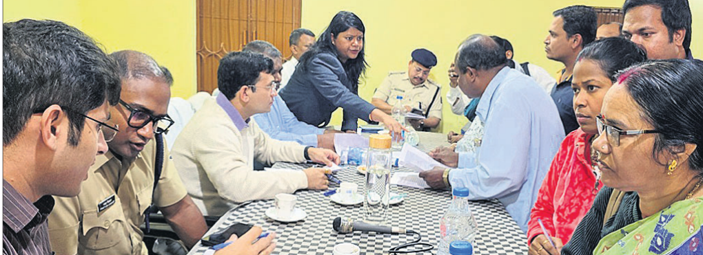
ମିଳିତ ଜନଶୁଣାଣିରେ ଜିଲାପାଳ ଓ ଏସ୍ପି ଅଭିଯୋଗ ଶୁଣୁଛନ୍ତି।