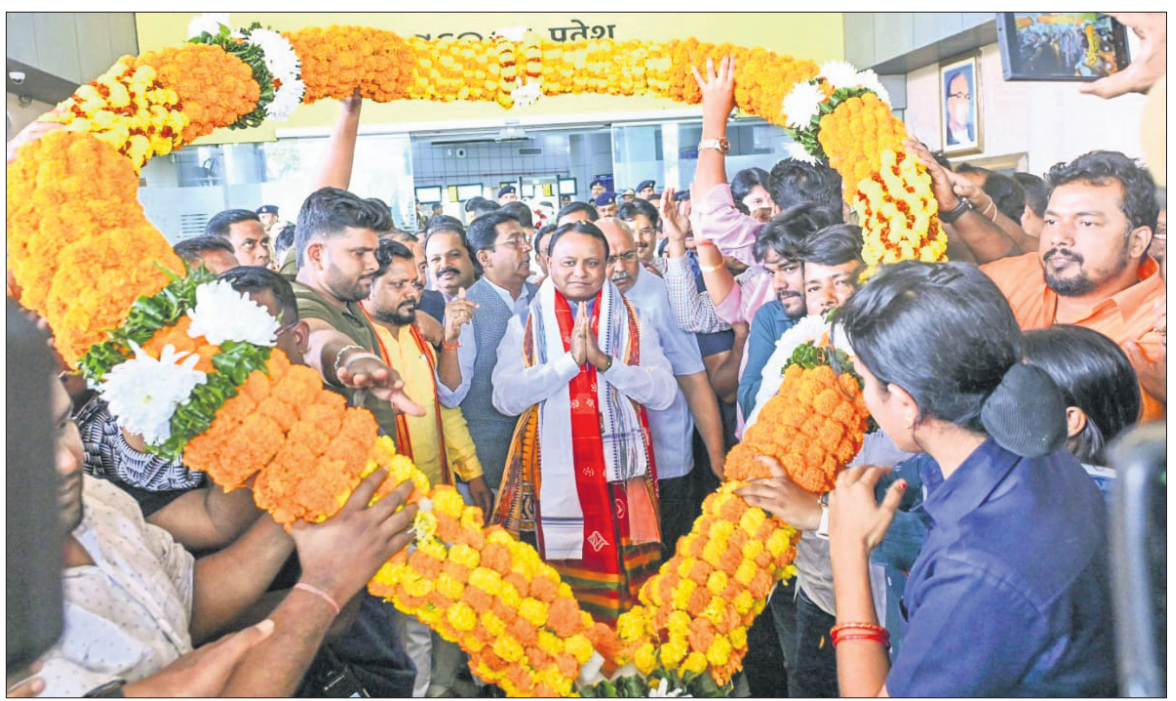
ହାଇଦ୍ରାବାଦ୍ ଗସ୍ତରୁ ଫେରିବା ପରେ ଯୋଗବାର ଭୁବନେଶ୍ୱର ବିମାନବନ୍ଦରଠାରେ ମନ୍ତ୍ରୀ, ବିଧାୟକ, ଭାଜପା ଦଳର ନେତା ଓ କର୍ମୀମାନେ ପୁଷ୍ୟମନ୍ତ୍ରୀ ମୋହନ ଚରଣ ମାଝୀଙ୍କୁ ସମ୍ବର୍ଦ୍ଧନ କରୁଛନ୍ତି।