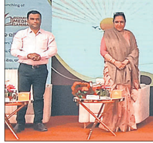
ଅନୁଷ୍ଠିତ କାର୍ଯ୍ୟକ୍ରମରେ ମନ୍ତ୍ରୀ, ଜିଲ୍ଲାପାଳ ଓ ଅନ୍ୟମାନେ ।