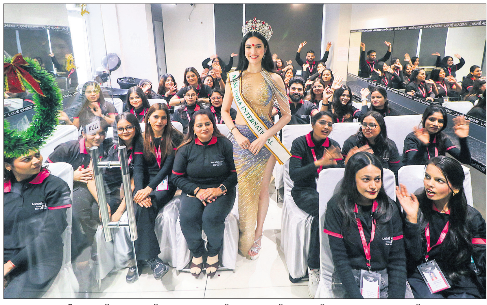
ଲକ୍ଷ୍ମୀର ହଜରତକଳାପୁତ୍ର ଲାଙ୍ଗେ ଏକାଡେମୀରେ ଏକ ସେସନ୍ ଅବସରରେ ମିସ୍ ଇଣ୍ଡିଆ ଇଣ୍ଟରନାସନାଲ ଇଣ୍ଡିଆ, ୨୦୨୪ ରୁଣ୍ଡ ସିନ୍ଧୁ ଉପାହାରୀ ଛାତ୍ରୀମାନଙ୍କ ସହ କଥା ହେଉଛନ୍ତି ।