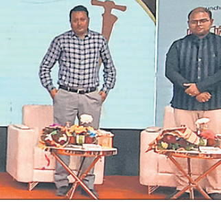
ବାର୍ଷିକ ଉତ୍ସବରେ ଉପସ୍ଥିତ ଅତିଥି ।

ଗନ୍ଧାମାଳି କୁଳ ପିଏମ୍.ଶ୍ରୀ ଦାଖା ସରକାରୀ ଉଚ୍ଚ ବିଦ୍ୟାଳୟର ୨୯ତମ ବାର୍ଷିକ ଉତ୍ସବ ଯୋଗଦାନ କରାଯାଇଛି ।