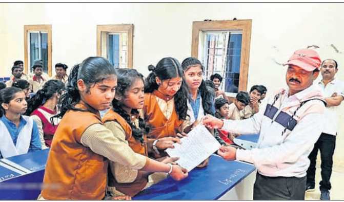
ଛାତ୍ରାମାନେ ସିଆର୍ସିସିଙ୍କୁ ଅଭିଯୋଗପତ୍ର ଦେଇଛନ୍ତି।