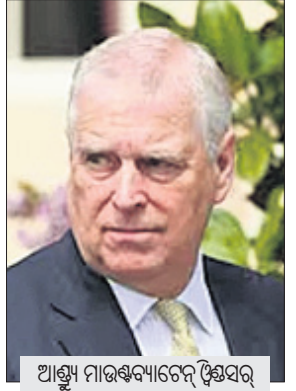
ଆଣ୍ଡ୍ରୁ ମାଡ଼ବ୍ୟାଚେର୍ ଫ୍ରେଡ଼ରକ୍

ବହୁ ଚର୍ଚ୍ଚିତ କେନ୍ଦ୍ରୀୟ ଏସ୍ଟିମେଟ୍ ଯୋଗୁଁ କେଳେକାରୀ ସମ୍ପର୍କିତ ମାମଲାରେ ଛଦି ହୋଇ ପୂର୍ବତନ ବ୍ରିଟିଶ ରାଜକୁମାର ତଥା କିଙ୍ଗ୍ ଚାର୍ଲ୍ସ୍ ଶାସକ ଭାବେ ଆଣ୍ଡ୍ରୁ ମାଡ଼ବ୍ୟାଚେର୍ ଫ୍ରେଡ଼ରକ୍ ଟିରପ୍ ହୋଇଛନ୍ତି । ଆଣ୍ଡ୍ରୁ ମାଡ଼ବ୍ୟାଚେର୍ ଯମତୀର ଅଧ୍ୟକ୍ଷ ହୋଇଛନ୍ତି ବହୁ ଗୁରୁତ୍ୱପୂର୍ଣ୍ଣ ସରକାରୀ ତଥ୍ୟ ଦେଉଥିବା ଅଭିଯୋଗ ହେବା ପରେ ମୁକ୍ତ ପୋଲିସ୍ ତାଙ୍କୁ ଟିରପ୍ କରିଛି । ପୂର୍ବ ଜର୍ମାନିରୁ ଆଣ୍ଡ୍ରୁଙ୍କ ବାସଭବନରେ ମୁକ୍ତ ପୋଲିସ୍ ଏକ ସ୍ୱତନ୍ତ୍ର ଟିମ୍ ଗୁରୁତ୍ୱପୂର୍ଣ୍ଣ ସରକାରୀ ଦସତ୍କାର କରିବା ପରେ ବ୍ରିଟିଶ