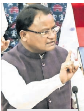
ମୁଖ୍ୟମନ୍ତ୍ରୀ ମୋହନ ଚରଣ ନାୟକ

କଂଗ୍ରେସ ବିଷୟ ବିଧାନସଭାରେ ବିରୋଧୀ ଦଳର ସରକାରୀ ଆଲୋଚନାରେ ବିଶେଷ ଯୋଗଦାନ ନ ରଖି, ପାଟିଭୁଷ୍ଟ, ହୋଇଛି । ଗଣତାନ୍ତ୍ରିକ ପରମ୍ପରାରେ ବିରୋଧୀ ଦଳର ପ୍ରଶ୍ନ ପଚାରିବାର ଅଧିକାର ରହିଛି । କିନ୍ତୁ ସୁଇଚ୍ଚିତରେ ବିରୋଧୀ ଦଳର କାର୍ଯ୍ୟକଳାପକୁ ଦେଖିଲେ ମନେହୁଏ, ସେମାନେ ଲୋକଙ୍କ ସ୍ୱରକୁ ବିଧାନସଭାରେ ରଖିବାକୁ ଚାହୁଁନାହାନ୍ତି । ସବୁଠାରୁ ପରିତାପର ବିଷୟ, ବିରୋଧୀ ଦଳର ନେତାଙ୍କ ସହ ତାଙ୍କ ସରକାରୀ ଆଲୋଚନାରେ ବିରୋଧୀ ଦଳର ଅଭିଭାଷଣ ସମୟରେ କଂଗ୍ରେସ କଂଗ୍ରେସରୁ ଚାହୁଁ ନ ଥିବା ଭଳି ମନେ ହେଉଥିଲା । ସେହି ସମୟରେ ବିଜେଡି ସରକାର କଥା ଏବଂ କାର୍ଯ୍ୟକଳାପକୁ ଯଦି ଲକ୍ଷ୍ୟ କରାଯାଏ, ତେବେ ସେଥିରେ ତାଙ୍କମତ ନ ଥିଲା । ଭଳି ଲାଭୁଥିଲା । ତେଣୁ ବିରୋଧୀ ଦଳର ଆଚରଣ ଅତ୍ୟନ୍ତ ନିରାଶାଜନକ । ବିଧାନସଭାରେ ହଜିଗୋଳକରି ବାହାରିଗଲା ବୋଲି ମୁଖ୍ୟମନ୍ତ୍ରୀ ମୋହନ ଚରଣ ନାୟକ କହିଛନ୍ତି । ରାଜ୍ୟପାଳଙ୍କ ଅଭିଭାଷଣ