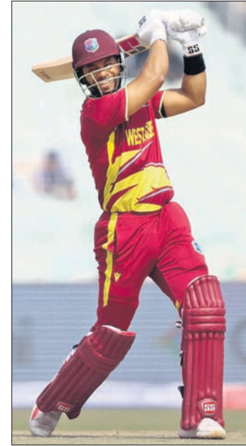
ଶର୍ ଷ୍ଟେଫାନିଶ୍ ଶାଈ ହୋଇ ।