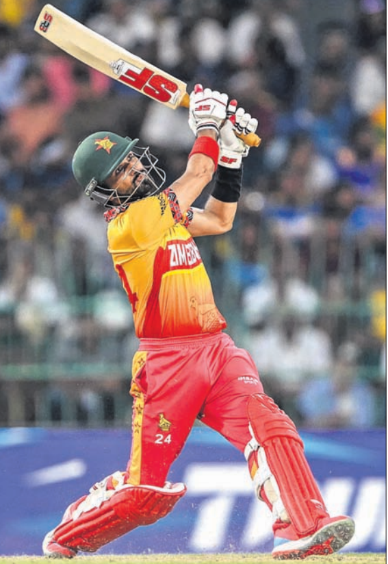
ମ୍ୟାର୍କ ବିଜୟୀ ଜିୟାଡ଼େ ଅବସରରେ ସିକନ୍ଦର ରାଜା ।