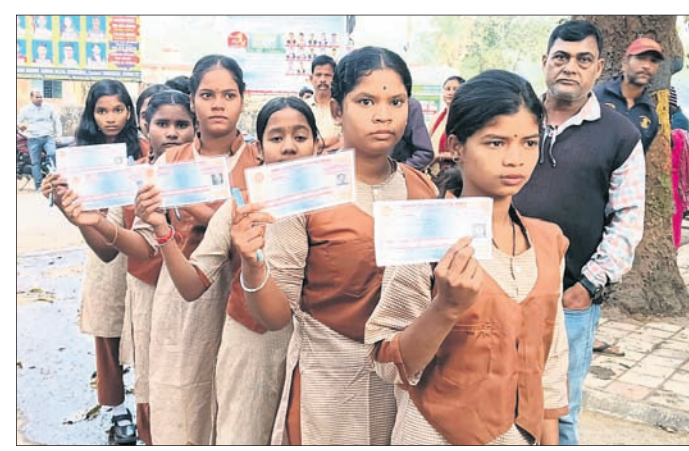
ବ୍ରଜନାଥ ବଡ଼ଜେନା ଉଚ୍ଚ ବିଦ୍ୟାଳୟ ପରୀକ୍ଷା କେନ୍ଦ୍ରରେ ପରୀକ୍ଷାର୍ଥୀମାନେ ଆଡମିଟ୍ କାର୍ଡ ଦେଖାଉଛନ୍ତି ।

ତେଜାନାଳ, ୧୯୨୨ (ରତନ ନାୟକ) ମାଟ୍ରିକ୍ ପରୀକ୍ଷାର ଗୁରୁବାର ଥିଲା ପ୍ରଥମ ଦିବସ । ପ୍ରଥମ ଦିନ ମାଟ୍ରିକ୍ ପରୀକ୍ଷା ଓଡ଼ିଆରେ ୩୨୭ ପରୀକ୍ଷାର୍ଥୀ ଅନୁପସ୍ଥିତ ଥିଲେ । ଜିଲ୍ଲାରେ ୨୬୯୯୯ ହାଜିଲ୍ଲର ମୋଟ ୧୭,୭୭୭ ପରୀକ୍ଷାର୍ଥୀଙ୍କ ମଧ୍ୟରୁ ୧୬୪୪୦ଜଣ ପରୀକ୍ଷା ଦେଇଥିଲେ । ତତ୍ତ୍ୱଧରେ ରେଗୁଲାର ପରୀକ୍ଷାର୍ଥୀଙ୍କ ମଧ୍ୟରେ ୧୬୬୧୪ରୁ