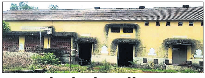
ଅଳ ହୋଇପଡ଼ିଥିବା ରୁଷିଆପଡ଼ାସ୍ଥିତ ଅନୁଜାନ ବିଲିଖର ପ୍ରସ୍ତୁତ କାରଖାନା ।

ତେଜାନାଳ ସହରର ଆଖପାଖ ଅଞ୍ଚଳରେ ଏକଦା ଛୋଟବଡ଼ ଶିଳ୍ପାଗାରକୁ ନେଇ ଶିଳ୍ପ କରିବର ସ୍ୱପ୍ନ ଦିନେ ବାସ୍ତବରୂପ ନେବ ବୋଲି ଅଞ୍ଚଳବାସୀ ଆଶା ବାନ୍ଧିଥିଲେ । କିନ୍ତୁ ପରବର୍ତ୍ତୀ ସମୟରେ ପରିଚାଳନାଗତ ତ୍ରୁଟି ଯୋଗୁ ସହରର ଆଖପାଖ ଅଞ୍ଚଳରେ ଥିବା ଅନେକ ଶିଳ୍ପ ରତ୍ନ ଷୋଭା ବନ୍ଦ ହୋଇଗଲା । ବହୁ ସଂଖ୍ୟାରେ ଶ୍ରମିକ, କର୍ମଚାରୀ ନିଜର ଜୀବନ ଜୀବିକା ହରାଇଲେ । ଜନସାଧାରଣ ଦେଖିଥିବା ଶିଳ୍ପ କରିବର ସ୍ୱପ୍ନ ପରିକଳ୍ପନା ଗୋଟାଠାରୁ ଦୂରରେ ରହିଲା । ବହୁବାର ଗଣ୍ଡେ ଓ ଅଧିକାରୀଙ୍କ ଦୃଷ୍ଟି ଆକର୍ଷଣ କରିବା ପରେ ମଧ୍ୟ ବିଭିନ୍ନ ସମୟରେ ରାଜ୍ୟରେ କ୍ଷମତାରେ ରହିଥିବା ସରକାର ଏଥିପ୍ରତି ଆନ୍ତରିକତା ପ୍ରକାଶ କଲେ ନାହିଁ । ଏଭଳି ଭାବେ ଷୋଭା ପ୍ରକାଶ କରିଛନ୍ତି ତେଜାନାଳ ସକ୍ରିୟ ନାଗରିକ ପରିଷଦ ।