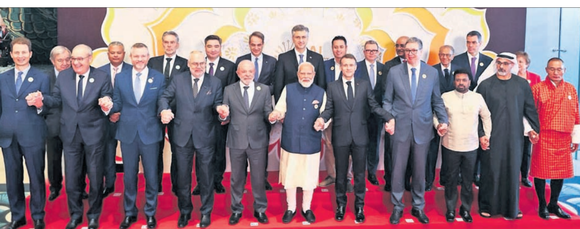
ନୂଆଦିଲ୍ଲୀର ଭାରତ ମଣ୍ଡପରେ ଗୁରୁବାର ଇଣ୍ଡିଆ ଏଆଇ ଲମ୍ପାୟ୍ ସମିତି ୨୦୨୬ର ଉଦ୍‌ଘାଟନା ଅବସରରେ ଯୋଗଦେଇଥିବା ରାଷ୍ଟ୍ରପତିଙ୍କ ଏବଂ ଏଆଇ ପ୍ରତିନିଧାନଙ୍କ ସହ ପ୍ରଧାନମନ୍ତ୍ରୀ ନରେନ୍ଦ୍ର ମୋଦି।