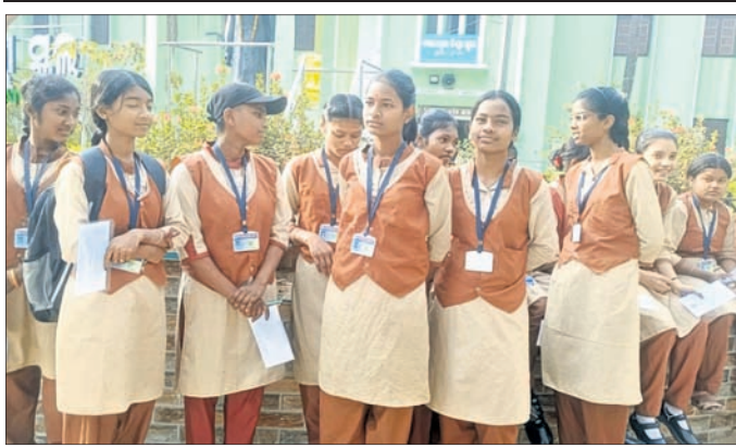
ବାଲେଶ୍ୱର ଜିଲ୍ଲା ସ୍କୁଲରେ ମାତୃଭାଷା ପରୀକ୍ଷା।

୩୭୫ଜଣ ପରୀକ୍ଷାର୍ଥୀ ମିଳି ମୋଟ ୮୩୫ଜଣ ପରୀକ୍ଷାର୍ଥୀ ଅନୁପସ୍ଥିତ ଥିଲେ। ସଦର ବ୍ଲକରେ ୬୫, ଖଇରା ଓ ୮୩୫ଜଣ ପରୀକ୍ଷାର୍ଥୀ ଅନୁପସ୍ଥିତ ଥିଲେ। ତଳେଖଣ୍ଡରେ ୬୫, ବାଲିଆପାଳରେ