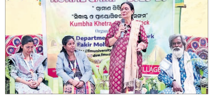
ପୁଣ୍ୟଅତିଥି ଉଦ୍‌ବୋଧନ ଦେଉଛନ୍ତି।

ଏସ୍ପିଏମ୍ସୁ ସାମାଜିକ କାର୍ଯ୍ୟ ବିଭାଗର ଗ୍ରାମୀଣ ଶିବିର ବାଲେଶ୍ୱର, ୧୯।୨(ବାଞ୍ଛାନିଧି ଦେ)