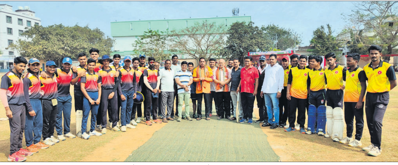
ବିହାରୀଲାଇ କ୍ରିକେଟ୍ ଟୁର୍ନାମେଣ୍ଟର ଉଦ୍‌ଘାଟନୀ ମ୍ୟାଚ୍‌ ପୂର୍ବରୁ ଦଳର ଖେଳାଳିଙ୍କ ଗହଣରେ ଅତିଥିବୃନ୍ଦ।