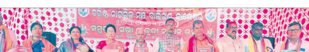
ଅତିଥିମାନଙ୍କ ଦ୍ୱାରା ବାର୍ଷିକ ମୁଖପତ୍ର ‘ଶତାୟୁ’ ଲୋକାର୍ପଣ କରାଯାଇଛି।

ବାଲିଖଣ୍ଡ ବରିଷ୍ଠ ନାଗରିକ ମଞ୍ଚର ବାର୍ଷିକ ଉତ୍ସବ ସିମ୍ବୁଲିଆ, ୧୯।୨(ସତ୍ୟନାଥ ନାୟକ)