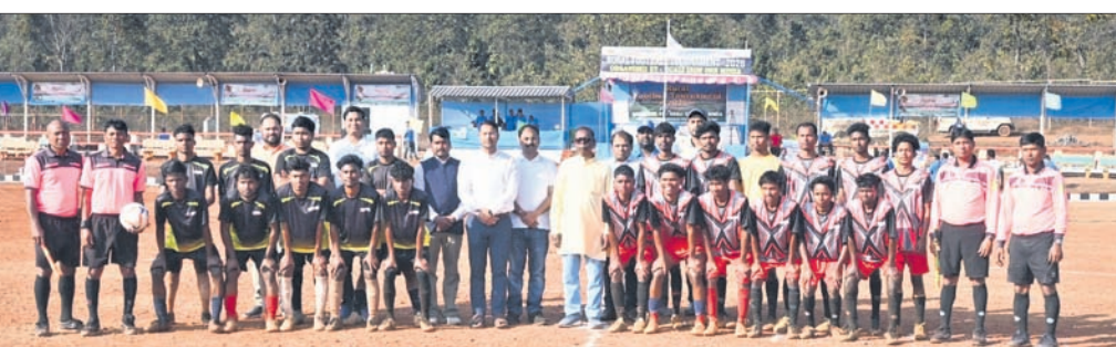
ଅତିଥିକ ଗହଣରେ ୨ ଦଳର ଖେଳାଳି।

ଯୋଡ଼ା, ୧୯୧୨ (ମାନସ ମହାନ୍ତି) କେନ୍ଦୁଝର ଜିଲ୍ଲା ଗୁଆଲି ଲୋହି ଖଣି, ବଡ଼ବଳି ଆଞ୍ଚଳିକ କାର୍ଯ୍ୟାଳୟ ଦ୍ୱାରା ପାଣ୍ଡୁଲିପୋଷି ନିତି ଖେଳପଡ଼ିଆରେ ଅନୁଷ୍ଠିତ ୨ ଦିନିଆ ଚମ୍ପିୟନ ବର୍ଷର ଚମ୍ପିୟନ ଚୟନ ପାଇଁ ଉଦ୍ଦ୍ୟୋଗୀ ଉଦ୍ଦ୍ୟୋଗୀଙ୍କ ଅଧିକାରୀଙ୍କ ଦ୍ୱାରା ପ୍ରସ୍ତୁତ ହୋଇଥିଲା। ଫେବୃ ୧୬ ତି ଦିନ ଅଂଶଗ୍ରହଣ କରିଥିବା ବେଳେ ଫାଇନାଲ ମ୍ୟାଚ୍ ପାଣ୍ଡୁଲିପୋଷି ଏକାଦଶ ଓ ଜନମରୁରୁ ଏକାଦଶ ମଧ୍ୟରେ ଖେଳାଯାଇଥିଲା।