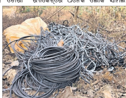
ଚୋରା ବିଦ୍ୟୁତ୍ ତାର ଜବତ କରାଯାଇଛି।