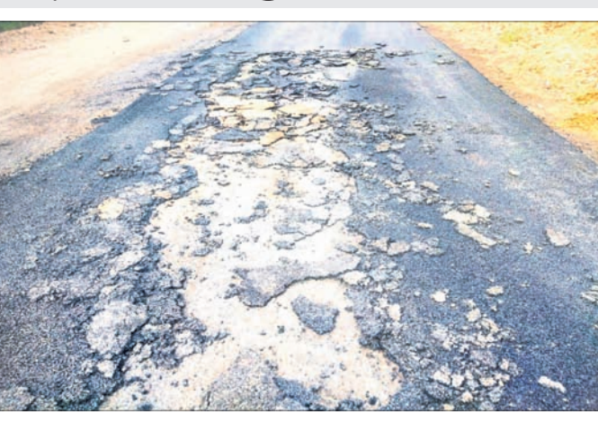
ବିଭାଗୀୟ ଅଧିକାରୀଙ୍କ ଅନୁପସ୍ଥିତିରେ କରାଯାଇଥିବା କାମର ଶେଷ ଗ୍ରାମବାସୀ କାର୍ଯ୍ୟକୁ ବିରୋଧ କରିଥିଲେ।