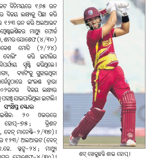
ଶର୍ ଷ୍ଟେକ୍ସିଜି ଶାଲ ହୋପ୍ ।