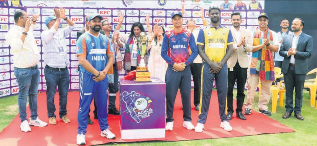
ଅତିଥିକ ଗହଣରେ ଚୁପି ସହ ଅଂଶଗ୍ରହଣକାରୀ ଦଳର ଅଧିନାୟକ।