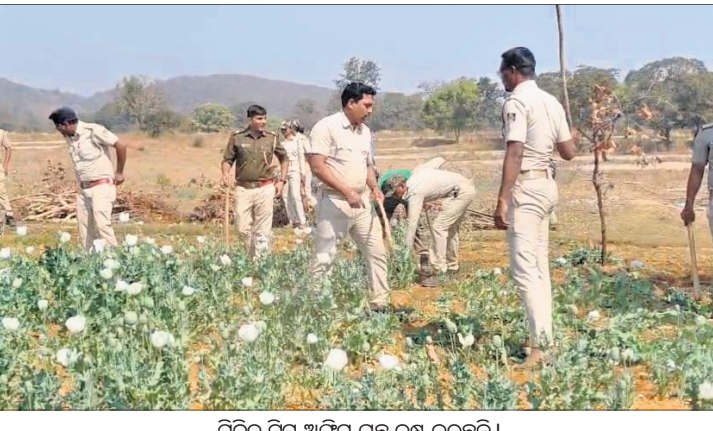
ମିଳିତ ଚିମ୍ ଅର୍ଥମ ଗଛ ନଷ୍ଟ କରୁଛନ୍ତି। ନିରାହ ଆଦିବାସୀଙ୍କୁ ଏହା ଗଲନା କରି ଅର୍ଥମ ଗାଞ୍ଜ କରିଥିଲେ। ଏପରିକି ଶାଗ ଓ ଏହାକୁ ଗାଞ୍ଜ କଲେ ବ୍ୟାପକ ଏହାର ମଞ୍ଜି ମଧ୍ୟ ସେମାନେ ଯୋଗାଇ ରୋଜଗାର ହେବ ବୋଲି ପ୍ରକାଶିତ ହୋଇଥିଲେ ଓ ଗାଁ ସାରା ଲୋକଙ୍କୁ ଏହା