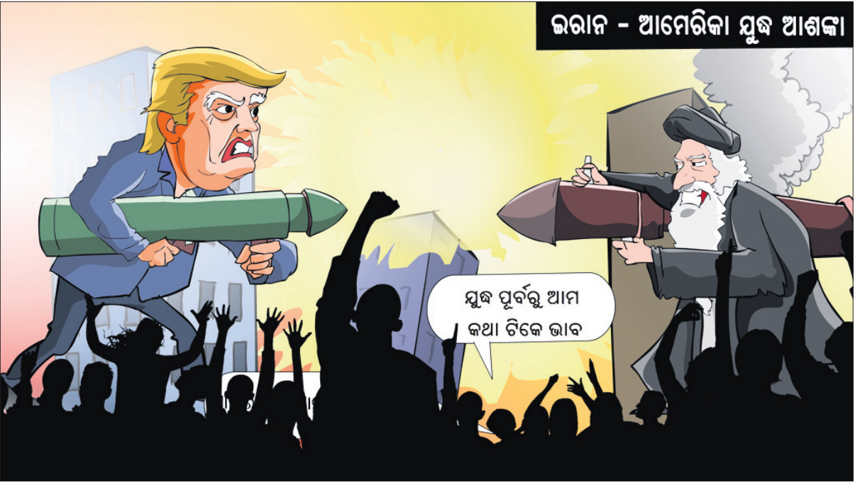
ଭରାନ - ଆମେରିକା ଯୁଦ୍ଧ ଆଶଙ୍କା