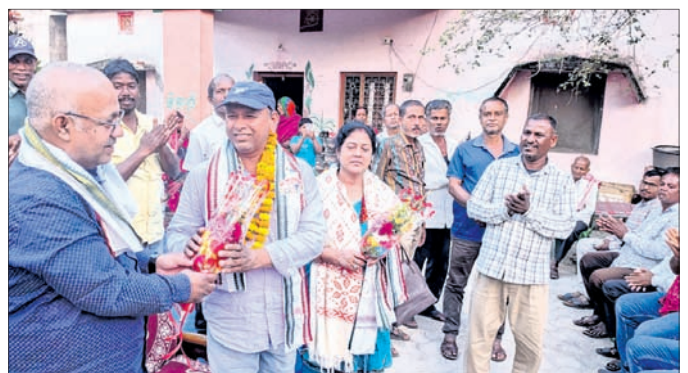
ବିଜେଡି ବ୍ଲକ ସଭାପତିଙ୍କ ସମ୍ବର୍ଦ୍ଧନା ସଭାରେ ବିଜେଡି ନେତୃବୃନ୍ଦ।

ଗତ ୨୪ବର୍ଷ ଧରି ବିଜେଡି ଲୋକଙ୍କ ସେବା କରିଆସିଛି। ପ୍ରତିଟି ସାହି, ଗରିବମାନଙ୍କୁ ବିଜେଡିର ବିକାଶର ଛାପ ରହିଛି। ପୂର୍ବତନ ମୁଖ୍ୟମନ୍ତ୍ରୀ ନବୀନ ପଟ୍ଟନାୟକଙ୍କୁ ଆଜି ବି ଓଡ଼ିଶାବାସୀଙ୍କ ହୃଦୟ ଦେଇ ଭଲ ପାଉଛନ୍ତି। ବର୍ତ୍ତମାନର ଭାଜପା ସରକାର ଖଣି ଲୁଟ୍ଟା ଯାକ୍ତାକୁ ରଙ୍ଗବୋଳା କାର୍ଯ୍ୟରେ ବ୍ୟୁତ୍ପା। ୧୯ମାସ ମଧ୍ୟରେ ଲୋକଙ୍କ ଆତ୍ମା ହରାଇ ସାରିଲାଣି। ଏହି ମହାତ୍ରୁପ ସମ ବିଜେଡି ମାତ୍ର କିଛିଦିନ ଧରି ପତ୍ରଖଣ୍ଡା ଦେଇଥିଲା। ପୁଣି ପତ୍ର କଟିଲାଣି। ମନୋବଳ ସ୍ୱତନ୍ତ୍ର କର ଏବଂ ଆଗାମୀ ପଞ୍ଚାୟତ ନିର୍ବାଚନ ଲାଗି ଏବେଠାରୁ ପ୍ରସ୍ତୁତ ହୋଇ ରୁହ ବୋଲି