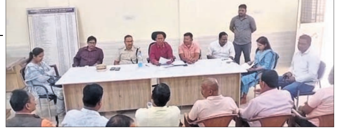
ବୈଠକରେ ଉପସ୍ଥିତ ପ୍ରଶାସନିକ ଅଧିକାରୀ ଓ ମହୋତ୍ସବ କମିଟି ସଦସ୍ୟ।

ଯୋଡ଼ା, ୧୯୧୨ (ମାନସ ମହାନ୍ତି) କେନ୍ଦୁଝର ଜିଲ୍ଲା ଗୁଆଲି ଲୋହି ଖଣି, ବଡ଼ବଳି ଆଞ୍ଚଳିକ କାର୍ଯ୍ୟାଳୟ ଦ୍ୱାରା ପାଣ୍ଡୁଲିପୋଷି ନିତି ଖେଳପଡ଼ିଆରେ ଅନୁଷ୍ଠିତ ୨ ଦିନିଆ ଚମ୍ପିୟନ ବର୍ଷର ଚମ୍ପିୟନ ଚୟନ ପାଇଁ ଉଦ୍ଦ୍ୟୋଗୀ ଉଦ୍ଦ୍ୟୋଗୀଙ୍କ ଅଧିକାରୀଙ୍କ ଦ୍ୱାରା ପ୍ରସ୍ତୁତ ହୋଇଥିଲା। ଫେବୃ ୧୬ ତି ଦିନ ଅଂଶଗ୍ରହଣ କରିଥିବା ବେଳେ ଫାଇନାଲ ମ୍ୟାଚ୍ ପାଣ୍ଡୁଲିପୋଷି ଏକାଦଶ ଓ ଜନମରୁରୁ ଏକାଦଶ ମଧ୍ୟରେ ଖେଳାଯାଇଥିଲା।