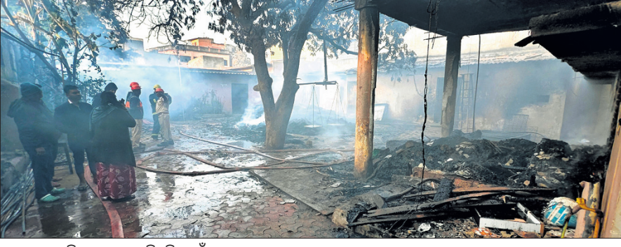
ଅଗ୍ନିକାଣ୍ଡରେ ପୋଡ଼ିକରି ପାଉଁଶ ହୋଇଯାଇଥିବା ସାମଗ୍ରୀ ।

ବଡ଼ବିଲ, ୧୯/୨ (କମଳା ରଣା) କେନ୍ଦୁଝର ଜିଲ୍ଲା ବଡ଼ବିଲ ପରିବାର କୃଷି କ୍ଷେତ୍ର ମାଲିକଙ୍କ ଘର ଅଗଣାରେ ଥିବା ଭୁଜ୍ଜା ଗୋଦାମରେ ଗୁରୁବାର ଭୋରରେ ଅଗ୍ନିକାଣ୍ଡ ଘଟିଛି। ନିଆଁ ଲାଗି ଲକ୍ଷାଧିକ ଟଙ୍କାର ଭୁଜ୍ଜା ଓ ଅଧିକ ଷ୍ଟେଶନରେ ପୋଡ଼ି ନଷ୍ଟ ହୋଇଯାଇଛି। ମହଲାର ଉପରେ ଘରେ ପରିବାର ଲୋକେ ରହୁଥିବା ବେଳେ ସମସ୍ତେ ସୁରକ୍ଷିତ ଅଛନ୍ତି। ପୁରୀ ଅନୁପାୟା, ବଡ଼ବିଲ ଅଞ୍ଚଳର ଜଣାଶୁଣା ବ୍ୟବସାୟୀ 'ପରିବାର କୃଷି କ୍ଷେତ୍ର'ର ମାଲିକ ହୋଇଛନ୍ତି। ସେତେବେଳକୁ ଗୋଦାମ ଅଗ୍ନିକାଣ୍ଡ ଘଟି ୬, ମନି ଗାନ୍ଧୀ ନିକଟରେ ଘର ଅଗଣାରେ ଭୁଜ୍ଜା ଗୋଦାମ କରିଛନ୍ତି। ଉପର