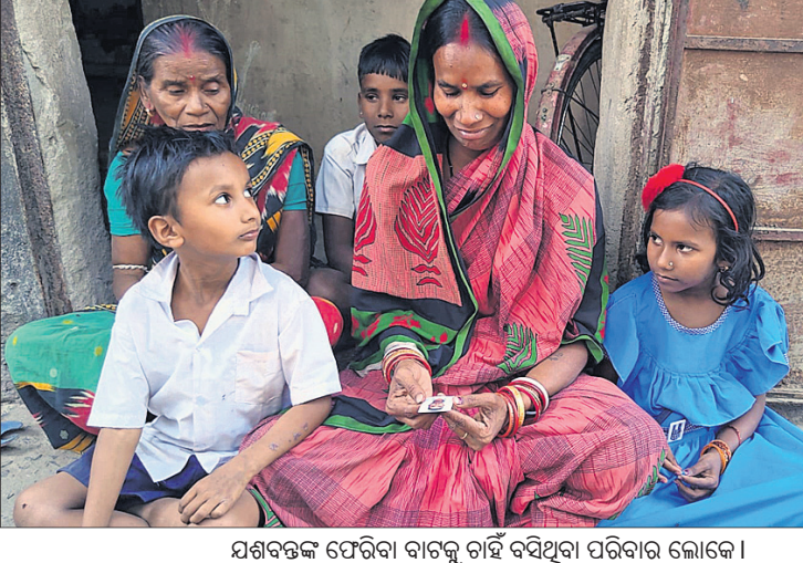
ଯଶବନ୍ତଙ୍କ ଫେରିବା ବାଟକୁ ଚାହିଁ ବସିଥିବା ପରିବାର ଲୋକେ ।