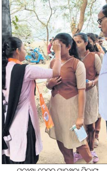
ପରୀକ୍ଷା କେନ୍ଦ୍ରକୁ ଯାଉଥିବା ପିଲାଙ୍କୁ ଫୁଲ ଚନ୍ଦନ ଦେଇ ସ୍ୱାଗତ କରାଯାଉଛି।

ଖଣ୍ଡପଡ଼ା, ୧୯୧୨ (ଅକ୍ଷୟ କୁମାର ମହାରଣା): ମାଧ୍ୟମିକ ଶିକ୍ଷା ପରିଷଦ ଦ୍ୱାରା ପରିଚାଳିତ ମାଟ୍ରିକ୍ ପରୀକ୍ଷା ଗୁରୁବାରଠାରୁ ଆରମ୍ଭ ହୋଇଛି। ଏ ପରିପ୍ରେକ୍ଷାରେ ଖଣ୍ଡପଡ଼ା ବ୍ଲକ୍ ରାମଚନ୍ଦ୍ର ହାଇସ୍କୁଲ ନୋଡାଲ କେନ୍ଦ୍ର ଅଧୀନରେ ୧୧ କେନ୍ଦ୍ରରେ ଶିକ୍ଷକମାନଙ୍କର ସହ ନାଟୁକାକ୍ଷୀ ପରୀକ୍ଷା କରା ହେଉଛି। ଏଥିରେ ଶେଷ ହୋଇଛି। ନୋଡାଲ ସମେତ ୧୧ କେନ୍ଦ୍ରରେ ସମୁଦାୟ ୧୫୪୮ ଛାତ୍ରଛାତ୍ରୀ ପରୀକ୍ଷା ଦେବା ବ୍ୟବସ୍ଥା ହୋଇଥିବା ବେଳେ ପ୍ରଥମ ଦିବସ ମାଟୁକାକ୍ଷୀ ପରୀକ୍ଷାରେ ବିଭିନ୍ନ କେନ୍ଦ୍ରରେ ୨୧ ପରୀକ୍ଷାର୍ଥୀ ଅନୁପସ୍ଥିତ ଥିବା ଜଣାଯାଇଛି। ଏଥିରେ ଖଣ୍ଡପଡ଼ା ବ୍ଲକ୍ ଅଧୀନ କୋସକା ଆଞ୍ଚଳିକ ଉଚ୍ଚ ବିଦ୍ୟାଳୟରେ ୩, ଖଣ୍ଡପଡ଼ା