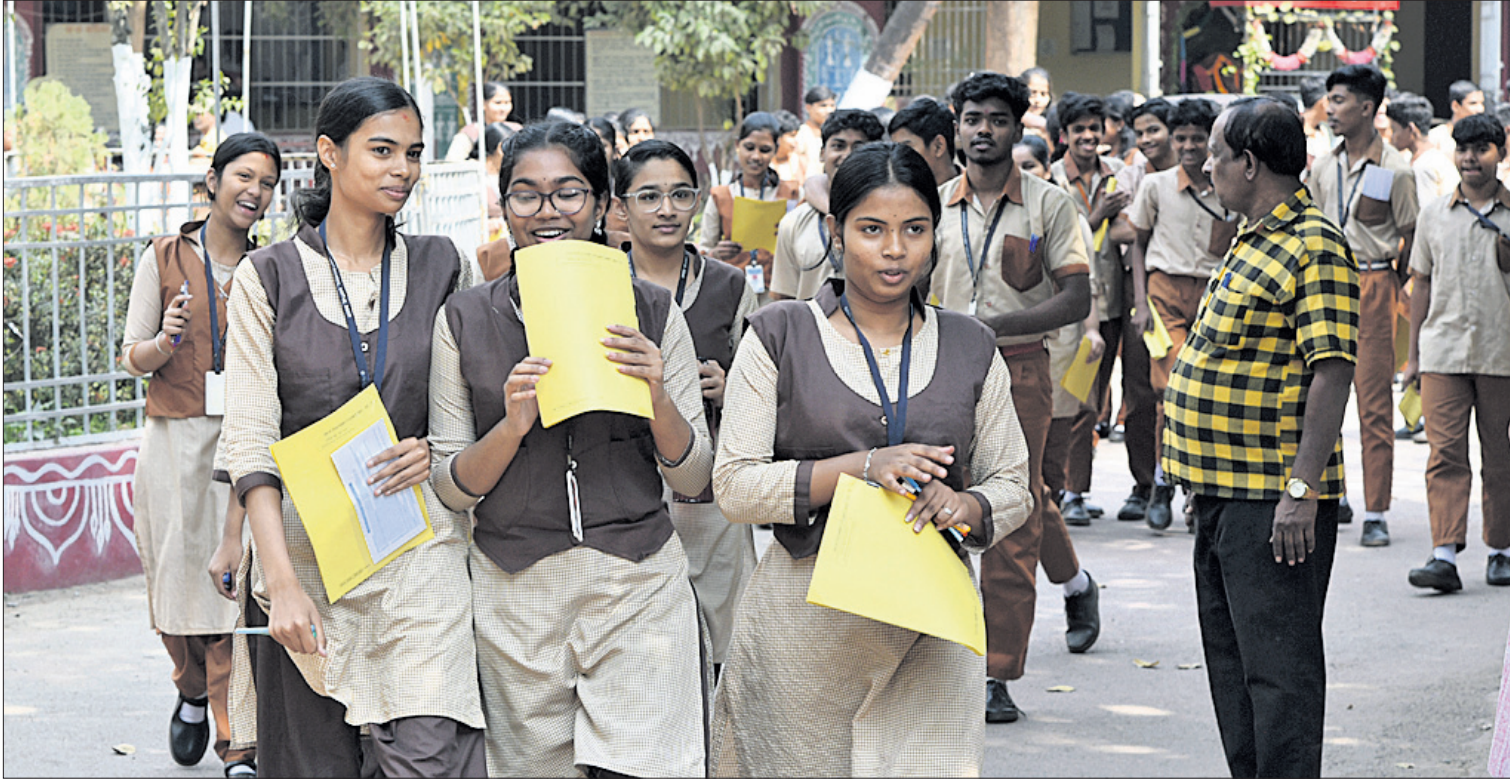
ପରୀକ୍ଷା ଖୁସି: ମାଧ୍ୟମିକ ଶିକ୍ଷା ପରିଷଦ (ବୋର୍ଡ) ପକ୍ଷରୁ ପରିଚାଳିତ ମାଟ୍ରିକ ପରୀକ୍ଷା ଗୁରୁବାରଠାରୁ ଆରମ୍ଭ ହୋଇଛି । ପ୍ରଥମ ଦିନ ସାହିତ୍ୟ ପରୀକ୍ଷା ରହିଥିଲାବେଳେ ଛାତ୍ରଛାତ୍ରୀମାନେ ଭୁବନେଶ୍ୱର ଯୁନିଟ୍-୩ରୁ ଉପସ୍ଥିତ କ୍ୟାମ୍ପସ୍ରେ ଯୋଗ୍ୟ ପରୀକ୍ଷା କେନ୍ଦ୍ରକୁ ଖୁସି ମନରେ ବାହାରୁଛନ୍ତି ।