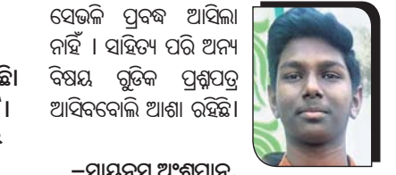
ସେଭେଲ ପ୍ରବନ୍ଧ ଆସିଲା ନାହିଁ। ସାହିତ୍ୟ ପରି ଅନ୍ୟ ବିଷୟ ରୂଚିକ ପ୍ରଶ୍ନପତ୍ର ଆସିବବୋଲି ଆଶା ରହିଛି।

ଓଡ଼ିଆ ଗ୍ରାମୀଣ ଭଲ ପଡ଼ିଥିଲା। ୭୦ରୁ ୭୫ ଭିତରେ ମାର୍କ ରହିବ। ଗତ ମାଟ୍ରିକ୍ ପରୀକ୍ଷାରେ ମିଶନ ଶକ୍ତି ପ୍ରଦତ୍ତ ପଡ଼ିଥିଲା। ତଳତ ବର୍ଷ ଓଡ଼ିଆ ଅଧିକା ପଡ଼ିବ ବୋଲି କୁହାଯାଉଥିଲା। ହେଲେ