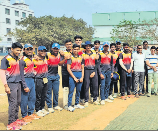
ବିହାରୀଲୀଲ କ୍ରିକେଟ ଟୁର୍ନାମେଣ୍ଟ ଉଦ୍‌ଘାଟନୀ ମ୍ୟାଚ୍ ପୂର୍ବରୁ ଦଳର ଖେଳାଳିଙ୍କ ଗହଣରେ ଅତିଥିବୃନ୍ଦ।

ଏସିଆ କପ୍ ଚ୍ୟାମ୍ପିୟନ୍ସ ଷ୍ଟାମ୍ପିନ୍‌ସ୍ (ଏସିଆ କପ୍) ଏବଂ ଭାରତୀୟ ଚ୍ୟାମ୍ପିୟନ୍ସ ଷ୍ଟାମ୍ପିନ୍‌ସ୍ ମିଳିତ ଆୟତ୍ତରେ ଗୁରୁବାର ଠାରୁ କଟକରେ ଏସିଆ କପ୍ ଆରମ୍ଭ ହୋଇଛି। ଉଦ୍‌ଘାଟନୀ ମ୍ୟାଚ୍‌ରେ ଭାରତ ୪ ରନରୁ ବିଜୟୀ ହୋଇଛି। ଚ୍ୟାମ୍ପିୟନ୍‌ସ୍ ଷ୍ଟାମ୍ପିନ୍‌ସ୍ ମିଳିତ ଆୟତ୍ତରେ ଏସିଆ କପ୍ ଆରମ୍ଭ ହୋଇଛି।