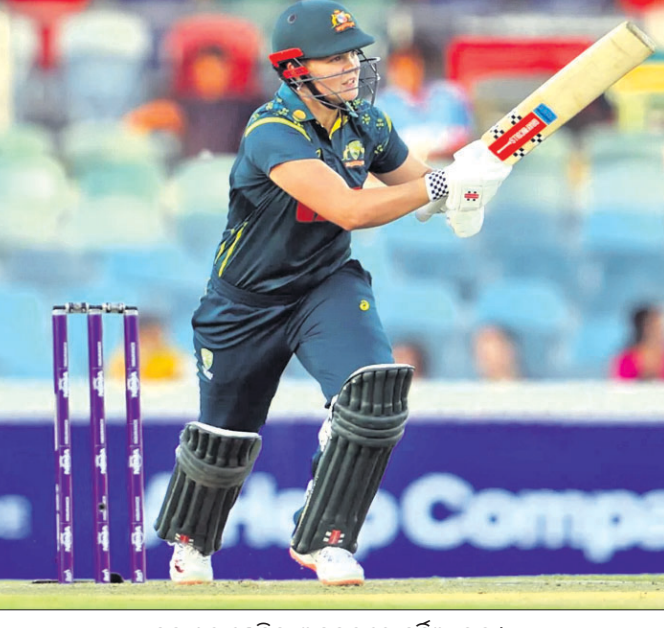
ବଡ଼ ଶତ୍ ଖେଳିବା ଅବସରରେ ଜର୍ଜିଆ ଭଲ୍।

ଅଷ୍ଟ୍ରେଲିଆ ଏବଂ ଭାରତ ମଧ୍ୟରେ ଚଳିଥିବା ଦ୍ୱିତୀୟ ମ୍ୟାଚ୍‌ରେ ଅଷ୍ଟ୍ରେଲିଆ ବିଜୟୀ ହୋଇଛି। ଉଦ୍‌ଘାଟନୀ ମ୍ୟାଚ୍‌ରେ ଅଷ୍ଟ୍ରେଲିଆ ବିଜୟୀ ହୋଇଛି। ଚ୍ୟାମ୍ପିୟନ୍‌ସ୍ ଷ୍ଟାମ୍ପିନ୍‌ସ୍ ମିଳିତ ଆୟତ୍ତରେ ଏସିଆ କପ୍ ଆରମ୍ଭ ହୋଇଛି। ଉଦ୍‌ଘାଟନୀ ମ୍ୟାଚ୍‌ରେ ଅଷ୍ଟ୍ରେଲିଆ ବିଜୟୀ ହୋଇଛି।