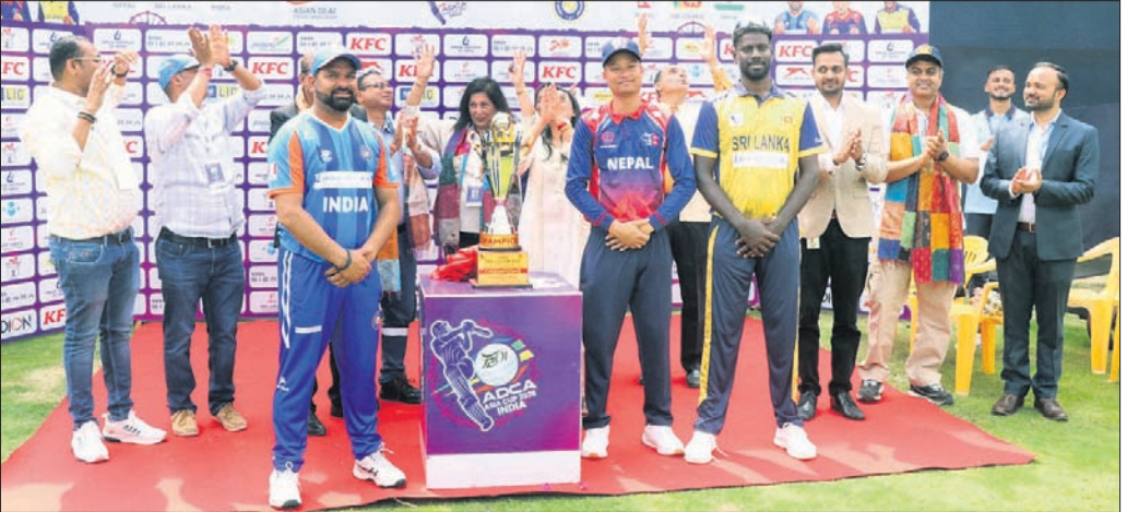
ଅତିଥିକ ଗହଣରେ ଗୁପ୍ତି ସହ ଅଂଶଗ୍ରହଣକାରୀ ଦଳର ଅଧିନାୟକ।

ଏସିଆନ ଚ୍ୟାମ୍ପିୟନ୍ସ ଷ୍ଟାମ୍ପିନ୍‌ସ୍ (ଏସିଆନ) ଏବଂ ଭାରତୀୟ ଚ୍ୟାମ୍ପିୟନ୍ସ ଷ୍ଟାମ୍ପିନ୍‌ସ୍ ମିଳିତ ଆୟତ୍ତରେ ଗୁରୁବାର ଠାରୁ କଟକରେ ଏସିଆ କପ୍ ଆରମ୍ଭ ହୋଇଛି। ବାରବାଟୀ ଷ୍ଟାଡ଼ିୟମ୍‌ରେ ଖେଳାଯାଇଥିବା ଉଦ୍‌ଘାଟନୀ ମ୍ୟାଚ୍‌ରେ ଭାରତ ୪ ରନରୁ ବିଜୟୀ ହୋଇଛି। ଚ୍ୟାମ୍ପିୟନ୍‌ସ୍ ଷ୍ଟାମ୍ପିନ୍‌ସ୍ ମିଳିତ ଆୟତ୍ତରେ ଏସିଆ କପ୍ ଆରମ୍ଭ ହୋଇଛି। ଉଦ୍‌ଘାଟନୀ ମ୍ୟାଚ୍‌ରେ ଭାରତ ୪ ରନରୁ ବିଜୟୀ ହୋଇଛି।