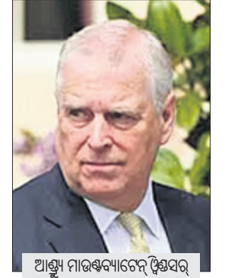
ଆଣ୍ଡ୍ରୁ ମାଡ଼ସ୍‌ବ୍ୟାଚେର୍ ଡିଫେନ୍ସ୍

ଲଣ୍ଡନ, ୧୯୮୨ ବହୁ ଚର୍ଚ୍ଚିତ କେମ୍ବ୍ରିଜ୍ ଏକ୍ସ୍ଟିନ୍ ଯୌନ କେଳେକାରୀ ସମ୍ପର୍କିତ ମାମଲାରେ ଛଦି ହୋଇ ପୂର୍ବତନ ବ୍ରିଟିଶ ରାଜକୁମାର ତଥା କିଙ୍ଗ୍ ଚାର୍ଲ୍ସ୍ ଶାସକ ଭାବେ ଆଣ୍ଡ୍ରୁ ମାଡ଼ସ୍‌ବ୍ୟାଚେର୍ ଡିଫେନ୍ସ୍ ରିପର୍ଟ ହୋଇଛନ୍ତି । ଆଣ୍ଡ୍ରୁ ମାଡ଼ସ୍‌ବ୍ୟାଚେର୍ କ୍ଷମତାର ଅପବ୍ୟବହାର କରି କେମ୍ବ୍ରିଜ୍ ଏକ୍ସ୍ଟିନ୍‌କୁ ବହୁ ଗୁରୁତ୍ୱପୂର୍ଣ୍ଣ ସରକାରୀ ତଥ୍ୟ ଦେଇଥିବା ଅଭିଯୋଗ ହେବା ପରେ ଯୁକ୍ତ ପୋଲିସ୍ ତାଙ୍କୁ ଟିରପ୍ କରିଛନ୍ତି । ପୂର୍ବ ଜର୍ମାନିର ଆଣ୍ଡ୍ରୁଙ୍କ ବାସଭବନରେ ଯୁକ୍ତ ପୋଲିସ୍‌ର ଏକ ସ୍ୱତନ୍ତ୍ର ଟିମ୍ ଗୁରୁବାର ସାକ୍ଷାତକରି ପହଞ୍ଚି ତାଙ୍କୁ ଟିରପ୍ କରିଛି । ୬୬