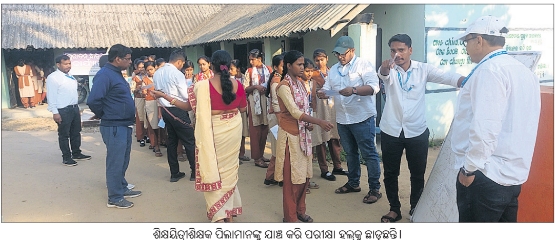
ଶିକ୍ଷଣାଧିକାରୀଙ୍କ ପିଲାମାନଙ୍କୁ ପାଠ୍ୟ ପଢ଼ାଇବା ସହ ଉତ୍ସାହ ଦେଖାଉଛନ୍ତି ।