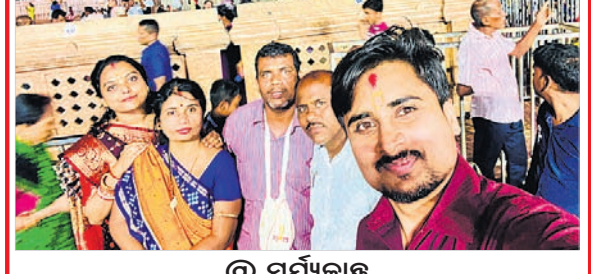
ସେଲ୍ଫି ପଠାଇବା ସମୟରେ ନିଜର ନାମ ଏବଂ ମୋବାଇଲ ନମ୍ବର ଦେବାକୁ ଭୁଲନ୍ତୁ ନାହିଁ । ଯୋଗାଯୋଗରେ ପଡ଼ିବା ପ୍ରକାଶ ପାଇବ ।