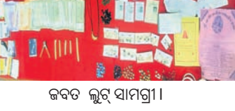
ଜବତ ଲୁଚ୍ ସାମଗ୍ରୀ।