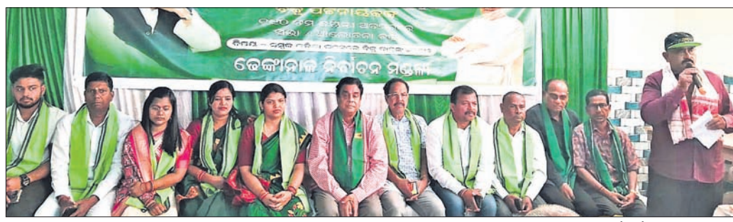
ବିଜୁ ପଟ୍ଟନାୟକଙ୍କ ୧୧୦ତମ ଜନ୍ମଜୟୀ ପାଳନ ଅବସରରେ ଯୋଗଦେଇଥିବା ବରିଷ୍ଠ ନେତୃବୃନ୍ଦ ଓ କର୍ମକର୍ତ୍ତା ।