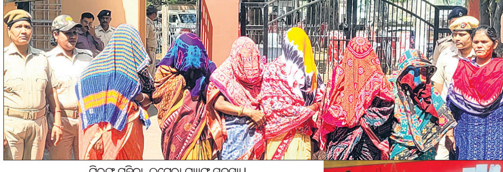
ଗିରଫ ମହିଳା ଲୁଚେରା ଗ୍ୟାଙ୍ଗ ସଦସ୍ୟ।