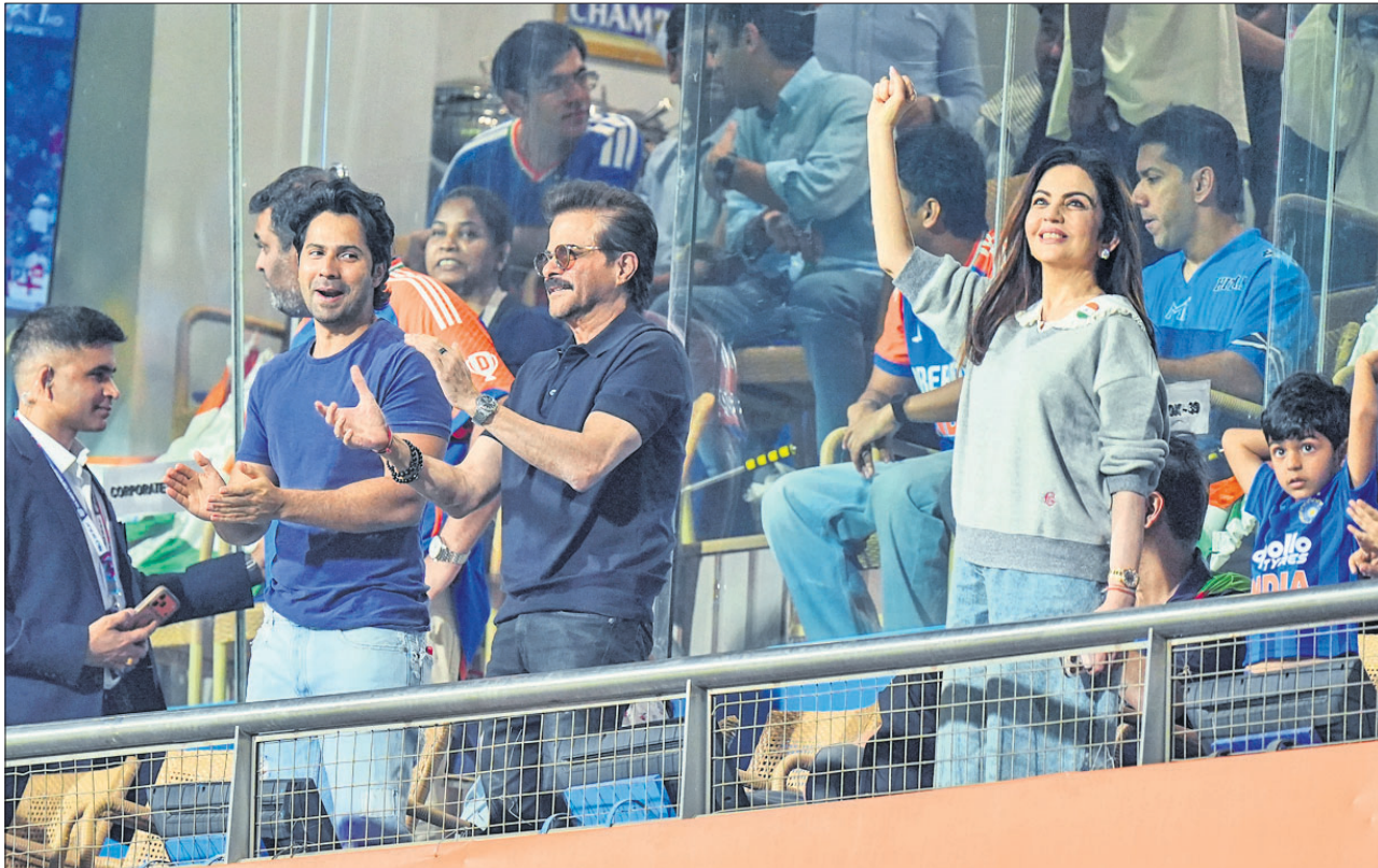
ମୁମ୍ବାଇର ଖିଲ୍ଡୀରେ ଖେଳିବା ପରେ ଗୁରୁବାର ଇଂଲଣ୍ଡ ବିପକ୍ଷରେ ଟି-୨୦ ବିଶ୍ୱକପ୍ ସେମିଫାଇନାଲରେ ୯୭ର ପାର୍ଟନରଶିପ୍ ଅବସରରେ ଭାରତୀୟ ବ୍ୟାଟର ସଞ୍ଜୁ ସାମସନ ଓ ଇଶାନ କିଶନ । ଖେଳାଳିମାନଙ୍କୁ ଉତ୍ସାହିତ କରୁଛନ୍ତି ବଲିଉଡ ଅଭିନେତା ଅନିଲ କାପୁର, ବରୁଣ ଧାଢ଼େନ (ବାମ) ଏବଂ ରିଲିଏନ୍ସ ଫାଉଣ୍ଡେସନ ଚେୟାରପର୍ସନ ନୀତା ଆୟନୀ (ଡାହାଣ)