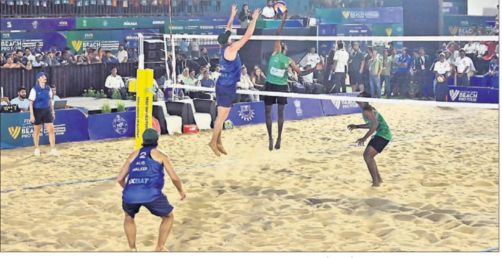
ଗୁରୁବାର ଖେଳାଯାଇଥିବା ଏକ ମ୍ୟାଚ୍ରେ ଉତ୍ସାହୀ ପୁରୁଷ।

ଭାରତରେ ପ୍ରଥମ ଥର ପାଇଁ ଏଫ୍ଆଇଭିବି ବିଶ୍ୱ ବିର୍ ଭଲିବଲ୍ (ମହିଳା ଓ ପୁରୁଷ) ଚାମ୍ପିୟନଶିପ୍ ବୁଧବାର କିର୍ ବିଶ୍ୱବିଦ୍ୟାଳୟ ପରିସରରେ ଉଦ୍ଘାଟିତ ହୋଇଛି।