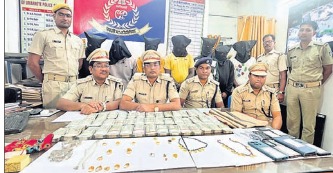
ଖବରଦାପା ସମ୍ମିଳନୀରେ ପୋଲିସ୍ ଡକାୟତି ସମ୍ପର୍କରେ ସୂଚନା ଦେଇଛି।