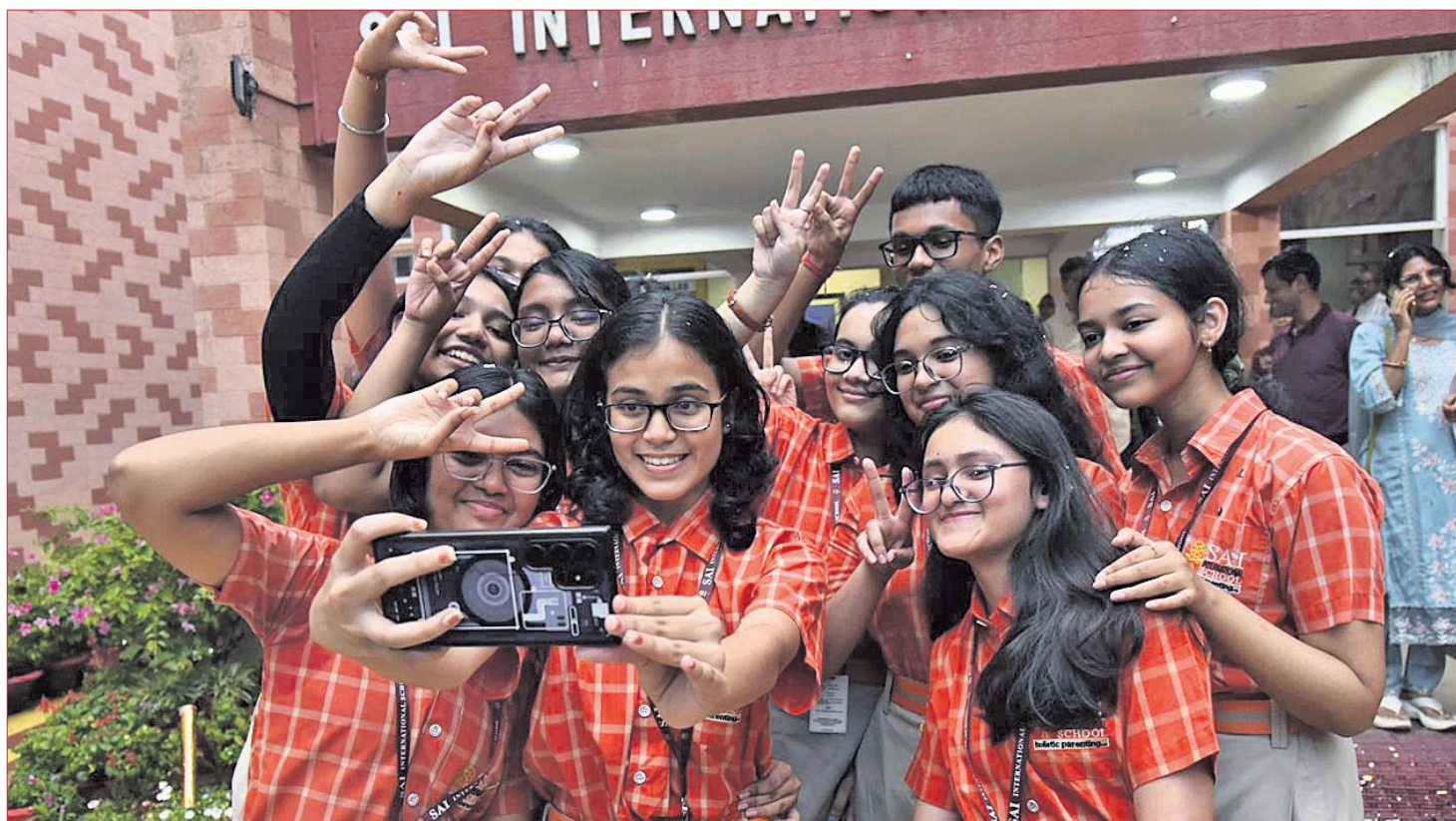
ସିବିଏସ୍‌ଇ ଦଶମ ଶ୍ରେଣୀ ପରୀକ୍ଷାଦିନୀ କୁସୁଧାର ପ୍ରକାଶ ପାଇବା ପରେ ଭୁବନେଶ୍ୱର ସ୍କୁଲ ଛାତ୍ରଛାତ୍ରୀମାନେ ଖୁସି ମନାଳି ସେଲଫି ଉଠାଇଛନ୍ତି।

କେନ୍ଦ୍ରୀୟ ମାଧ୍ୟମିକ ଶିକ୍ଷା ବୋର୍ଡ (ସିବିଏସ୍‌ଇ) ରୁଧିରାଣୀ ୨୦୨୨ର ଦଶମ ଶ୍ରେଣୀ ପରୀକ୍ଷା ଫଳ ପ୍ରକାଶ କରିଛି। ପ୍ରାୟ ୨୫ ଲକ୍ଷ ଛାତ୍ରଛାତ୍ରୀ ପରୀକ୍ଷା ଦେଇଥିଲେ। ସାମଗ୍ରିକ ଭାବେ ୯୩.୭୦% ପିଲା କୃତକାର୍ଯ୍ୟ ହୋଇଛନ୍ତି। ଏଥର ମଧ୍ୟ ଝିଅମାନଙ୍କ ପାଠ୍ୟ ହାର ପୁଅଙ୍କ ତୁଳନାରେ ଅଧିକ ରହିଛି। ପିଲାମାନଙ୍କ ମଧ୍ୟରେ ଅନୁଚିତ ପ୍ରତିଯୋଗିତା ରୋକିବା ପାଇଁ ସିବିଏସ୍‌ଇ ପକ୍ଷରୁ କୌଣସି 'ଟପ୍‌ସ୍‌ଲିଷ୍ଟ' କିମ୍ବା 'ମେରିଟ୍‌ଲିଷ୍ଟ' କରି କରାଯାଇ ନାହିଁ। ତଥାପି ପ୍ରତି ବିଷୟରେ ସର୍ବାଧିକ ନମ୍ବର ରଖୁଥିବା ଶ୍ରେଣୀ ୦.୧% ଛାତ୍ରଛାତ୍ରୀଙ୍କୁ ବୋର୍ଡ ପକ୍ଷରୁ 'ମେରିଟ୍‌ସ୍‌ଲିଷ୍ଟ' ପ୍ରଦାନ କରାଯାଉଛି। ଏହି ସର୍ବୋତ୍ତମ ଶ୍ରେଣୀର ଛାତ୍ରଛାତ୍ରୀମାନଙ୍କୁ ଉପକ୍ରମରେ ଉପକ୍ରମ ହେବ। ଯେଉଁ ପିଲାମାନେ ନିଜ ମାର୍କରେ ସମସ୍ତ ନାହାନ୍ତି ଏବଂ ଏଥିରେ ଉଚ୍ଚତମ ଆକାଶକୁ ଚାହୁଁଛନ୍ତି, ସେମାନଙ୍କ ପାଇଁ ଦ୍ୱିତୀୟ ପର୍ଯ୍ୟାୟ ବୋର୍ଡ ପରୀକ୍ଷା ଆୟୋଜନ କରାଯାଉଛି। ଏହି ପରୀକ୍ଷା ଆସନ୍ତା ମେ ୧୫ରୁ ଆରମ୍ଭ ହେବାକୁ ଯାଉଛି। ଯେଉଁମାନେ କୌଣସି ବିଷୟରେ ଅନୁକାର୍ଯ୍ୟ ହୋଇଛନ୍ତି, ସେମାନଙ୍କ ପାଇଁ ଶୁଦ୍ଧାସ୍ତ୍ର ସମ୍ପୂର୍ଣ୍ଣମାଧ୍ୟମିକ କମ୍ପ୍ୟୁଟର ପରୀକ୍ଷା ଆୟୋଜନ କରାଯାଉଛି। ପରୀକ୍ଷା ଫଳରେ ଭୁବନେଶ୍ୱର ରିଜିଅନ (ଓଡ଼ିଶା, ପଶ୍ଚିମବଙ୍ଗ ଏବଂ ଛତିଶଗଡ଼) ବେଶ୍ ଭଲ ପ୍ରଦର୍ଶନ କରିଛି, ଯାହାର ପାଠ୍ୟ ହାର ରହିଛି ୯୪.୬୭%। ଏହା କାଗାମି ହାରାହାରି ପାଠ୍ୟ ପ୍ରତିଶତ (୯୩.୭୦%) ଠାରୁ ୦.୯୭% ଅଧିକ। ଦେଶର ସମସ୍ତ ସିବିଏସ୍‌ଇ ରିଜିଅନ ମଧ୍ୟରେ ଭୁବନେଶ୍ୱର ୧୧ଶ ସ୍ଥାନରେ ରହିଛି। ତେବେ ପୂର୍ବ ବର୍ଷ ଏଥର ମଧ୍ୟ ଉତ୍ତମ (୯୯.୭୯%) ଏବଂ ବିକାଶଶୀଳ (୯୯.୭୯%) ସର୍ବୋଚ୍ଚ ସ୍ଥାନରେ ରହିଛନ୍ତି। କୌଣସି ଛାତ୍ରଛାତ୍ରୀ ନିଜ ମାର୍କରେ ସମସ୍ତ ନ ଥିଲେ, ସେମାନେ ଗୁରୁବାରଠାରୁ ପୁନଃ ପାଠ୍ୟ ଆବେଦନ କରିପାରିବେ।