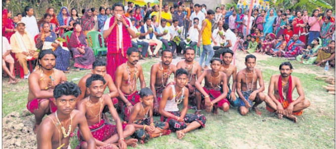
ଭୂମାପତି ଗ୍ରାମରେ ଭଡ଼ାପର୍ବ।

ପୋଲ ନିର୍ମାଣ କାର୍ଯ୍ୟରେ ବୁଲ ବୁଲ ଜଣ ଠିକାଦାର ନିୟୋଜିତ ହୋଇଥିଲେ ବି କେବଳ ନୁହେଁ ପିଲର ନିର୍ମାଣ କାର୍ଯ୍ୟ ବି ସମ୍ପୂର୍ଣ୍ଣ ହୋଇପାରି ନ ଥିଲା। ଉପରେ ଏକ ଘଣ୍ଟା ପୋଲ ନିର୍ମାଣ ଦାବିକୁ ଦୃଷ୍ଟିରେ ରଖି ୫କୋଟି ଟଙ୍କା ବ୍ୟୟବରାଦ ହୋଇଥିଲା। ୨୦୨୬ ଡୁବଡୁବି ବିଭାଗର ଅଧିକାରୀମାନଙ୍କୁ ବିଧାୟକ