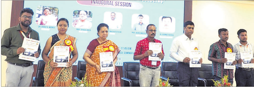
ଅତିଥିକ ବାଚାଂଶ ପୂର୍ତ୍ତିକା ଉନ୍ମୋଚନ କରାଯାଇଛି।