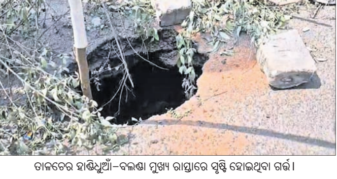
ତାଳଚେର ହାତ୍ତୀ-ବଳୟା ମୁଖ୍ୟ ରାସ୍ତାରେ ସୃଷ୍ଟି ହୋଇଥିବା ଗର୍ତ୍ତ।

ରାୟକୁ ଭିକିରି ଆଇଏମ୍, ଏସପିସିବି ଓ ଯାଜପୁରରୋଡ ଖଣି ଉପନିର୍ଦ୍ଦେଶକ କର୍ତ୍ତୃପକ୍ଷଙ୍କ ଦ୍ୱାରା ଏକ ସ୍ୱତନ୍ତ୍ର ତଦନ୍ତ କରାଯାଇଥିଲା। ତଦନ୍ତରେ ମାଲଦ୍ୱୀ ଦ୍ୱାରା ବହି ଯାଉଥିବା ବର୍ଦ୍ଧ୍ୟପାଣିର ଉପଯୁକ୍ତ ପରିଚାଳନା ଆଣି ହେଉ ନ ଥିବା ଜଣାପଡ଼ିଥିଲା। ଏହାପରେ ଏସପିସିବି ପକ୍ଷରୁ ଆବଶ୍ୟକ ମେଶିନ ସଂସ୍ଥାପନ କରି ବର୍ଦ୍ଧ୍ୟପାଣି ବହିବା ବନ୍ଦ କରିବାକୁ ନିର୍ଦ୍ଦେଶ ହୋଇଥିଲା। ଇତିମଧ୍ୟରେ ସମସ୍ତ କାର୍ଯ୍ୟକ୍ଷମ ଖଣି ସଂସ୍ଥା ସେମାନଙ୍କ ଖଣି ପରିସରରେ ଆବଶ୍ୟକ ମେଶିନ ସଂସ୍ଥାପନ କରି ବହିଯାଉଥିବା ପାଣିକୁ ବିଶୋଧନ କରି ତନଶାଳା ନାଳାରେ ଛାଡ଼ିବାକୁ ନିର୍ଦ୍ଦେଶ ଦିଆଯାଇଛି। କିନ୍ତୁ କେତେକ ଖଣି ସଂସ୍ଥା ଏହାକୁ ଭୁଲେଇ ନ କରି ସଂସ୍ଥାପନ ହୋଇଥିବା ମେଶିନ ବାହାରେ ଖଣି ପରିସରରେ ବର୍ଦ୍ଧ୍ୟପାଣି ବାହାରକୁ ଛାଡ଼ୁଥିବା ଅଭିଯୋଗ ହେଉଛି। ସେହିପରି କଳିଙ୍ଗନଗର କେତେକ ଶିଳ୍ପ କାରଖାନାରେ ବିଷାକ୍ତ ପାଣି ପ୍ରତିବର୍ଷ ହେଉଛି। ସୁକ୍ଷ୍ମ ଖଣି ଅଞ୍ଚଳକୁ ନିଷ୍ପାଦିତ ପାଣି ପରିଚାଳନା ବିପଦ ହେଉଛି। କେନ୍ଦ୍ର ଓ ରାଜ୍ୟ ସରକାରଙ୍କ ନିର୍ଦ୍ଦେଶ ଅନୁଯାୟୀ ଏମ୍ପୁଏଣ୍ଟ ଡିସଚାର୍ଜ ପ୍ରାଣୀ(କିଟିପି) ବ୍ୟବହାର ଶିଳ୍ପ ଓ ଖଣି ପରିସରକୁ ବିଷାକ୍ତ ବର୍ଦ୍ଧ୍ୟପାଣିକୁ ବିଶୋଧନ କରି ପୂର୍ଣ୍ଣ ଚାକ୍ଷୁ ବ୍ୟବହାର କରିବାକୁ ନିର୍ଦ୍ଦେଶ ରହିଛି। କିନ୍ତୁ ବିତ୍ତମନା ଯେ, ଯାଜପୁର ଜିଲ୍ଲାର କେତେକ ଖଣି ଓ ଶିଳ୍ପ ସଂସ୍ଥା ସରକାରଙ୍କ ନିର୍ଦ୍ଦେଶ ଖଣି ନିଷ୍ପାଦନ କାର୍ଯ୍ୟକ୍ଷମ ନୁହେଁ। କେତେକ କାରଖାନାକୁ ଆସୁଥିବା କୋଇଲିଖୋରି ପାଣି ଜଳଜୀବନକୁ ବିପଦରେ ପକାଇଛି। ଏହି ପାଣିରୁ ବିଷାକ୍ତ ପ୍ରାକାରଣ ବା ଫେନଲ ଏବଂ ବର୍ଦ୍ଧ୍ୟପାଣି ନିର୍ଗତ ହୋଇ ଲୋକଙ୍କ ସ୍ୱାସ୍ଥ୍ୟ ଓ କୃଷିକ୍ଷେତ୍ରକୁ ପ୍ରଭାବିତ କରୁଛି ବୋଲି ବହୁଥର ନ୍ୟାଶନାଲ ଗ୍ରାମ