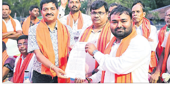
ବିଧାୟକ ମାନସ ଦଳ ଠିକା ସଂସ୍ଥା କର୍ତ୍ତୃପକ୍ଷକୁ କାର୍ଯ୍ୟାଦେଶ ପ୍ରଦାନ କରୁଛନ୍ତି।

ନିର୍ଦ୍ଦେଶ ଦେଇଛନ୍ତି। ଜିଲ୍ଲା ସଦର ମହକୁମାକୁ କଷାଫଳ ପଞ୍ଚାୟତକୁ ଦଳ ଅସମ୍ପୂର୍ଣ୍ଣ ପୋଲର ସ୍ଥିତି ଅନୁଧ୍ୟାନ କରିଛନ୍ତି। ଧାର୍ଯ୍ୟ ସମୟସୀମା ମଧ୍ୟରେ ଅଧ୍ୟାପକିଆ ହୋଇ ପରିଚାଳିତ ହେବା ପୋଲ ନିର୍ମାଣ କାର୍ଯ୍ୟ ସାରିବାକୁ ଠିକାଦାର ସଂସ୍ଥା ଓ ଗ୍ରାମ୍ୟ ଭଲଭଲ ବିଭାଗର ଅଧିକାରୀମାନଙ୍କୁ ବିଧାୟକ