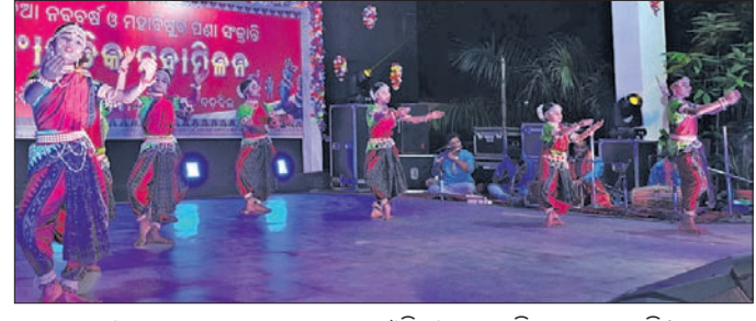
ଶ୍ରୀମତୀ ପାଣିଗ୍ରାହୀଣୀ ଦାସଙ୍କୁ ଉଦ୍ଦେଶ୍ୟ ଦଳ ପାଖରେ କରାଯାଇଛି।