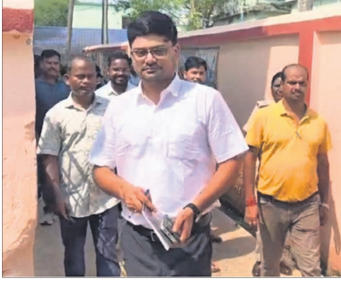
କାକବନ୍ଧ ଆଶ୍ରମ ସ୍କୁଲ ପରିସରରେ କେନ୍ଦ୍ରୀୟ ଆର୍ତ୍ତସିନ୍ଧୁରୀ ମୁଖ୍ୟମନ୍ତ୍ରୀଙ୍କ ନିର୍ଦ୍ଦେଶକ୍ରମେ ଆର୍ତ୍ତସିନ୍ଧୁରୀର ଡବ୍ ଆରମ୍ଭ ହୋଇଛି।

ଭାରତୀୟ/ମୋରଡ଼ା/ରାସଗୋବିନ୍ଦପୁର, ୧୫୪ (ନାଲନ୍ଦ୍ର ବିହାରୀ ବଖରା/ସ୍ମାରକ ମାଳା/ସତ୍ୟବାଦୀ ପରିତା) ମୟୂରଭଞ୍ଜ ଜିଲ୍ଲା ରାସଗୋବିନ୍ଦପୁର ବ୍ଲକ୍ ଅଧୀନ କାକବନ୍ଧ ଅନୁସୂଚିତ ଜାତି ଓ ଜନଜାତି ଆଶ୍ରମ ବିଦ୍ୟାଳୟରେ ବିଷାକ୍ତ ଖାଦ୍ୟ ଖାଇ ୧୪୬ ଛାତ୍ରୀଛାତ୍ର ଅସୁସ୍ଥ ହେବା ଓ ସେଥିମଧ୍ୟରୁ ଜଣେ ଛାତ୍ରୀଙ୍କ ମୃତ୍ୟୁ ଘଟଣାକୁ ନେଇ ରାଜ୍ୟ ସରକାରଙ୍କ ନିର୍ଦ୍ଦେଶକ୍ରମେ ଆର୍ତ୍ତସିନ୍ଧୁରୀର ଡବ୍ ଆରମ୍ଭ ହୋଇଛି। କେନ୍ଦ୍ରୀୟ ଆର୍ତ୍ତସିନ୍ଧୁରୀ ମୁଖ୍ୟମନ୍ତ୍ରୀଙ୍କ ନିର୍ଦ୍ଦେଶକ୍ରମେ ଆର୍ତ୍ତସିନ୍ଧୁରୀର ଡବ୍ ଆରମ୍ଭ ହୋଇଛି। କେନ୍ଦ୍ରୀୟ ଆର୍ତ୍ତସିନ୍ଧୁରୀ ମୁଖ୍ୟମନ୍ତ୍ରୀଙ୍କ ନିର୍ଦ୍ଦେଶକ୍ରମେ ଆର୍ତ୍ତସିନ୍ଧୁରୀର ଡବ୍ ଆରମ୍ଭ ହୋଇଛି। କେନ୍ଦ୍ରୀୟ ଆର୍ତ୍ତସିନ୍ଧୁରୀ ମୁଖ୍ୟମନ୍ତ୍ରୀଙ୍କ ନିର୍ଦ୍ଦେଶକ୍ରମେ ଆର୍ତ୍ତସିନ୍ଧୁରୀର ଡବ୍ ଆରମ୍ଭ ହୋଇଛି।