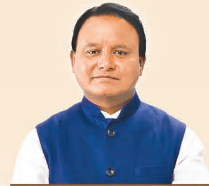
ଶ୍ରୀ ମୋହନ ଚରଣ ମାଝୀ ମୁଖ୍ୟମନ୍ତ୍ରୀ, ଓଡ଼ିଶା