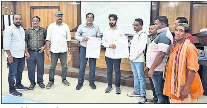
ଦକ୍ଷତା ଶିବିରରେ ଉପସ୍ଥିତ ଅଧିକାରୀମାନେ।

ଝାରସୁଗୁଡ଼ା ଜିଲ୍ଲାପାଳଙ୍କ ସମ୍ପାଦନାରେ ଏହି ଶିବିରରେ ସ୍ୱଚ୍ଛତା ପ୍ରଚାର କରାଯାଇଛି।