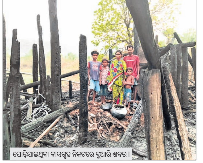
ପୋଡ଼ିଯାଇଥିବା ବାସଗୃହ ନିକଟରେ ଦୁଆରି ଶବ୍ଦର।

ଦେବଗଡ଼ ଜିଲ୍ଲା ରିଆମାଳ ରୁକ୍ଷ କୁଞ୍ଚେଲଗୋଲା ଥାନା ଅନ୍ତର୍ଗତ ରାଉତଗଡ଼ନପୁର ଗ୍ରାମରେ ଦୁଆରି ଶବ୍ଦରକାର ବାସଗୃହ ନିଆଁ ଲାଗି ସମ୍ପୂର୍ଣ୍ଣ ଭାବେ ପୋଡ଼ିଯାଇଛି।