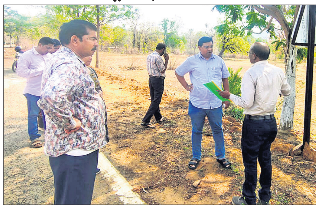
ଜିଲ୍ଲାପାଳ ଲକ୍ଷ୍ୟ ରୁଚିତ୍ୱ ପ୍ରକଳ୍ପର ସମୀକ୍ଷା କରୁଛନ୍ତି।