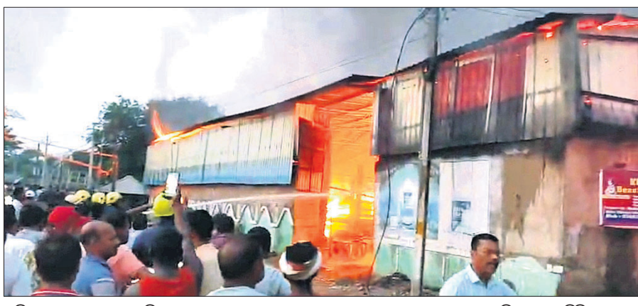
ଶ୍ରମିକମାନେ ୫ଟି ହୋଇ ପଳାଇଯିବା ପରେ ନିଆଁ ଲାଗିଥିବା ସ୍ଥାନୀୟ ବାସିନ୍ଦା କହିଛନ୍ତି। ବିଳମ୍ବରେ ଅଗ୍ନିଶମ ବିଭାଗ ପହଞ୍ଚିବାକୁ