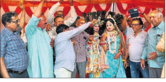
ରାଧାକୃଷ୍ଣ ମନ୍ଦିର ପ୍ରତିଷ୍ଠାର ବାର୍ଷିକୋତ୍ସବ ଆୟତ୍ତ ହେବ।

ସଂକୀର୍ତ୍ତନ କରାଯାଇଥିଲା। ଏଥିରେ ରାଉରକେଲା, ବଟେଇ ଓ ବଡ଼ପା ଅଞ୍ଚଳରୁ ସଂକୀର୍ତ୍ତନ ମଣ୍ଡଳୀ ଯୋଗଦେଇ ନାମ କାର୍ତ୍ତନ କରିଥିଲେ।