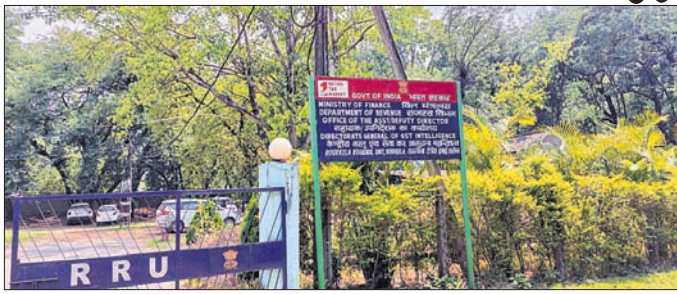
ଜିଏସ୍ଟି (କେନ୍ଦ୍ରୀୟ) ମହାନିର୍ଦ୍ଦେଶାଳୟ କାର୍ଯ୍ୟାଳୟ।

ରାଉରକେଲା, ୧୮୪ (ସଙ୍ଗାତା ଜେନା) ରାଉରକେଲାରେ ଜିଏସ୍ଟି ଠକେଇ ମାମଲା ବଢିବାରେ ଲାଗିଛି। ବିଶେଷ ଭାବେ ନକଲି ଇନ୍ଦ୍ରଧନୁ ବ୍ୟବହାର କରି ମାଲ୍ କାରବାର ମାମଲାରେ ଅଧିକାଂଶ ଠିକାସଂସ୍ଥା ସମ୍ପୃକ୍ତ ଥିବା ଜଣାପଡିଛି। ଏଭଳି ୧୫୫୫ରୁ ଉର୍ଦ୍ଧ୍ୱ ମାମଲା ଯାଞ୍ଚ ହୋଇଥିବାବେଳେ ଅଧିକାଂଶ ଠିକାସଂସ୍ଥା ଠକେଇରେ ସମ୍ପୃକ୍ତ ରହିଥିବା ତଥ୍ୟ ସାମ୍ନାକୁ ଆସିଛି। ଅନ୍ୟପକ୍ଷେ ବିଭିନ୍ନ ରାଜ୍ୟକୁ ଏହି ନକଲି ଇନ୍ଦ୍ରଧନୁ ମାମଲା ଚେର ଲାଗିଛି। ଏହାର ତଦନ୍ତ ପ୍ରକ୍ରିୟା ସମୟସାପେକ୍ଷ ଏବଂ ବିଭାଗରେ କର୍ମଚାରୀଙ୍କ ଅଭାବ ଯୋଗୁ ସେଭଳି ସଫଳତା ମିଳୁନାହିଁ। ଏହି କ୍ରମରେ ୨୦୨୫-୨୬ ଆର୍ଥିକ ବର୍ଷରେ ମାତ୍ର ୩/୪ଟି ମାମଲାରେ ସଫଳତା ମିଳିଛି। ଯାହା ନଗଣ୍ୟ ଅଟେ। ଏଥିସହ ଜିଏସ୍ଟି ନିୟମରେ ମଧ୍ୟ ପରିବର୍ତ୍ତନ ହୋଇଛି। ତେଣୁ ଗିରଫ ମାମଲା ହ୍ରାସ ପାଇଛି ବୋଲି ରାଉରକେଲା ସେକ୍ଟର-୫ସ୍ଥିତ ଜିଏସ୍ଟି (କେନ୍ଦ୍ରୀୟ) ମହାନିର୍ଦ୍ଦେଶାଳୟ କର୍ମଚାରୀଙ୍କୁ ସୂଚନା ଦିଆଯାଇଛି। ରାଉରକେଲାରେ ବ୍ୟବସାୟ, ଟ୍ରେଡିଂ ଓ ଜିଏସ୍ଟି ସମନ୍ୱୟ ନେଶନେଶରେ ନକଲି ଇନ୍ଦ୍ରଧନୁ ମାଧ୍ୟମରେ ଜିଏସ୍ଟି ଠକେଇ କରିବା ଭଳି ଘଟଣା ଘଟୁଛି। ପ୍ରକୃତ ମାଲ୍ ବା ସେବା ବିକ୍ରି ହୋଇ ନ ଥିଲେ ମଧ୍ୟ ଆର୍ଥିକ ନେଶନେଶ ହେଉଛି। କାର୍ଗଜ କଲମରେ ନକଲି କମ୍ପାନୀ ଓ