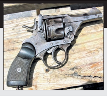
ସୁବର୍ଣ୍ଣପୁର ଜିଲ୍ଲା ବିଗୁଡୁଛି ଆଇନଶୃଙ୍ଖଳା ପରିଚ୍ଛା

ସୁବର୍ଣ୍ଣପୁର ଜିଲ୍ଲାରେ ଆଇନଶୃଙ୍ଖଳା ପରିଚ୍ଛା କରିବାରେ ଲାଗିଛି। କଥା କଥାକେ ଚୁଲି ଫୁଟୁଛି। ଲାଇସେନ୍ସ ନ ଥାଇ ନିଶାଗ୍ରସ୍ତ ବ୍ୟକ୍ତି ଓ ଅପରାଧୀମାନେ ପିସ୍ତୁଳ ଧରି ବୁଲୁଛନ୍ତି। ପୋଲିସ୍ ପାଟ୍ରୋଲ୍ କଡ଼ାକଡ଼ି କରାଯାଉଛି। ଫଳରେ ସହରଠାରୁ ଗ୍ରାମାଞ୍ଚଳ ପର୍ଯ୍ୟନ୍ତ ଆପରାଧୀଙ୍କ କାର୍ଯ୍ୟକଳାପ ବଢ଼ିବାରେ ଲାଗିଛି। ଅଭିଯୁକ୍ତଙ୍କ ବିରୋଧରେ ପୋଲିସ୍ କଠୋର କାର୍ଯ୍ୟାନୁଷ୍ଠାନ ଗ୍ରହଣ କରୁ ନ ଥିବା ଅଭିଯୋଗ ହେଉଛି। ଏହାର ସୁଯୋଗରେ କେତେକ ଯୁବପିଢ଼ି କଳ୍ପପତ୍ର ଓ ଅନ୍ୟାନ୍ୟ ନିଶାଦ୍ରବ୍ୟ ସେବନ କରି ପିସ୍ତୁଳ, ବୋମା ଓ ମାରଣାସ୍ତ୍ର ଧରି ଖୁଲିଫଖୁଲି ବୁଲୁଛନ୍ତି। ତେବେ ଜିଲ୍ଲା ପୋଲିସ୍ ମୁଖ୍ୟଙ୍କ ପ୍ରତ୍ୟକ୍ଷ ହସ୍ତକ୍ଷେପ ଓ କଡ଼ା ତାରିବ ପୋଲିସ୍ ଅନେକ ଆପରାଧୀଙ୍କ ମାମଲାକୁ ସୋପାନିତ ହୋଇଛି। ଏଭଳି ପିସ୍ତୁଳ ଖୋଜିବା ଶୁଭକାରୀ ରାଜିରେ ବାରମହାରାଜପୁର ଉପଜିଲ୍ଲାପାଳଙ୍କ କାର୍ଯ୍ୟାଳୟ ଛକରେ