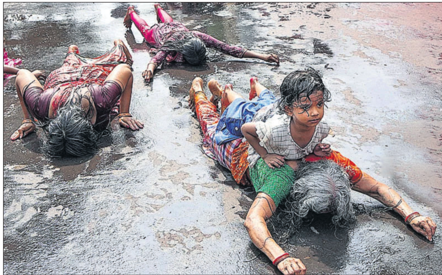
ଶୀତଳା ପୂଜା ଅବସରରେ ଶନିବାର ଦୋଷ୍ଟି ରାତିନାତି ପାକନ କରିବାକୁ ଯାଇ ଶ୍ରଦ୍ଧାକୁମାରେ କୋଲକାତାର କାଳିଦାସ ଆଡ଼େ ରାସ୍ତା ଉପରେ ସାଷ୍ଟାଙ୍ଗ ପ୍ରଣାମ କରି ଯାଉଛନ୍ତି।