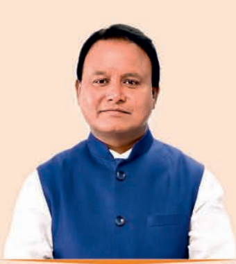
ଶ୍ରୀ ମୋହନ ଚରଣ ମାଝୀ ମୁଖ୍ୟମନ୍ତ୍ରୀ, ଓଡ଼ିଶା