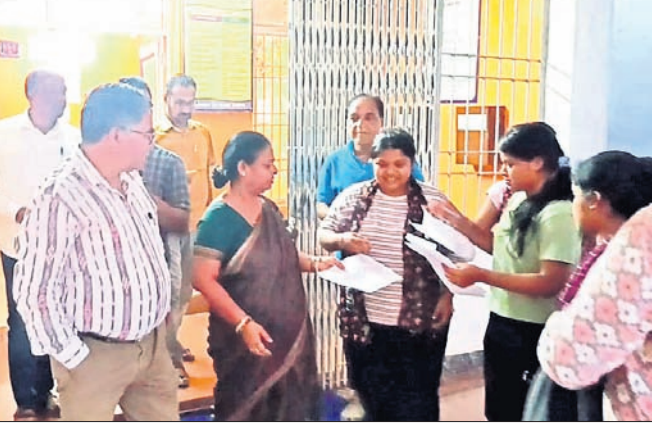
୨ ଜଣିଆ ଚିମ୍ ହାତ୍ରାହାତ୍ରୁକ୍ତ ସହ ଆଲୋଚନା କରୁଛନ୍ତି।