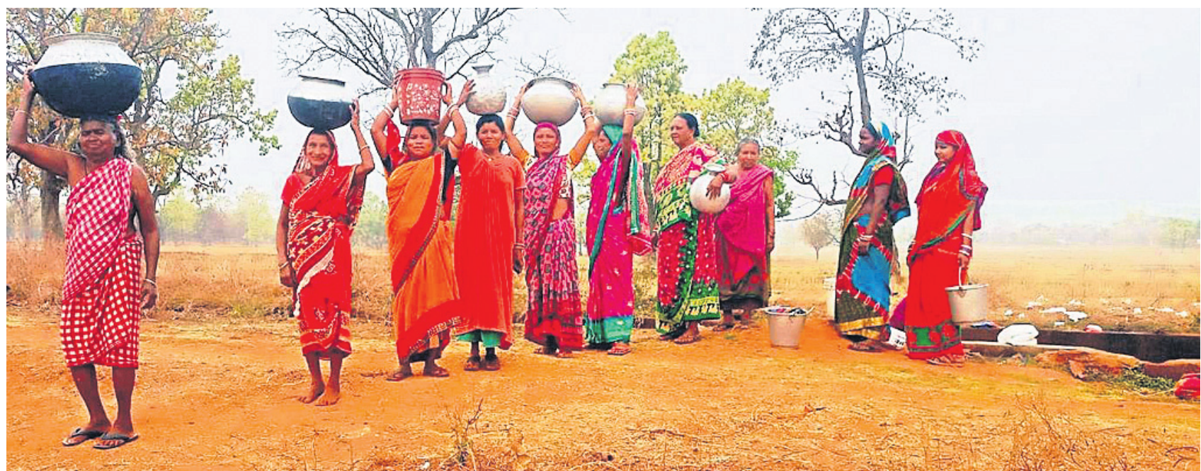
ଯାକପୁର ଜିଲ୍ଲା ସୁକିୟା ବ୍ଲକ୍ ବେଶାଗାଡ଼ିଆ ଗ୍ରାମର ନଳକୂପ ଜଳ ପାନାୟ ଅନୁପଯୋଗୀ ହୋଇପଡ଼ିଥିବାରୁ ମହିଳାମାନେ ଗାଁ ନିକଟ ଏକ ନାଳକୁ ପାଣି ସଂଗ୍ରହ କରି ଆଣୁଛନ୍ତି । (ରିପୋର୍ଟ: ପୃଷ୍ଠା-୨)