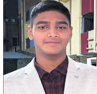
ବରଗଡ଼, ୧୮୪ (ପ୍ରେମାନନ୍ଦ ଖମାରି)

ଆନ୍ଧ୍ରପ୍ରଦେଶର ଶ୍ରୀହରିକୋଟ୍ଟାରେ ଭାରତୀୟ ଅନ୍ତରୀକ୍ଷ ଗବେଷଣା ସଂଗଠନ(ଇସ୍ତ୍ରୋ)ରେ ହେବାକୁ ଥିବା