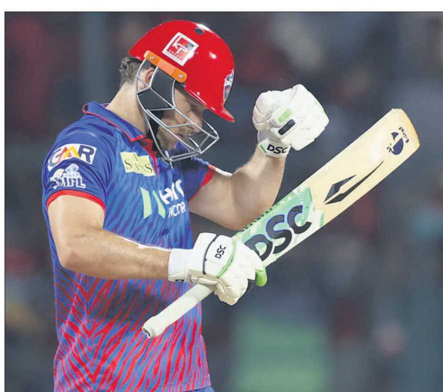
ମ୍ୟାଚ୍ ଫିନିଶ୍ କରିବା ପରେ ଡେଭିଡ୍ ମିଲର।

ବେଙ୍ଗାଳୁରୁ, ୧୮୪ ଡେଭିଡ୍ ମିଲରଙ୍କ ବିଶ୍ୱାସନୀୟ ବ୍ୟାଟିଂ କରିବା ପାଇଁ ଦିଲ୍ଲୀ କ୍ୟାପିଟାଲ୍ସ (ଡିସି) ଶନିବାର ଅପରାହ୍ନରେ ଖେଳାଯାଇଥିବା ଏକ ରୋମାଞ୍ଚିକ ଆଇପିଏଲ୍ ମ୍ୟାଚ୍ରେ ୬ ଉଇକେଟରେ ରୟାଲ ଚ୍ୟାଲେଞ୍ଜର୍ସ ବେଙ୍ଗାଳୁରୁ (ଆରସିବି)କୁ ପରାସ୍ତ କରିଛି। ଏହା ଦିଲ୍ଲୀର ୫ ମ୍ୟାଚ୍ରେ ତୃତୀୟ ବିଜୟ ହୋଇଥିବା ବେଳେ ଆରସିବି ଲାଗି ୬ ମ୍ୟାଚ୍ରେ ଏହା ତୃତୀୟ ପରାଜୟ। ଲୋକେଶ ରାହୁଲ ଶନିବାର ଅର୍ଦ୍ଧଶତକୀୟ ପାକି ଖେଳି ଟାକର ୩୪ତମ ଜନ୍ମଦିନ ଓ ୧୫୦ତମ ଆଇପିଏଲ୍ ମ୍ୟାଚ୍କୁ ସ୍ମରଣୀୟ କରାଇଛନ୍ତି। ଅପରାଜିତ ଅର୍ଦ୍ଧଶତକୀୟ ଇନିଂସ ଖେଳିଥିବା ତ୍ରିଷ୍ଟାନ ଷ୍ଟୁଭ୍ ପୂର୍ଣ୍ଣର ଅର୍ଦ୍ଧ ଦି ମ୍ୟାଚ୍ ବିବେଚିତ ହୋଇଛନ୍ତି। ବ୍ୟାଟିଂ ଲାଗି କୃଷକର ପିନ୍ରେ ପ୍ରଥମେ ବ୍ୟାଟିଂ କରିଥିବା ଆରସିବି ନିର୍ଦ୍ଧାରିତ ୨୦ ଓଭରରେ ୮ ଉଇକେଟ ହରାଇ ୧୭୫ ରନ କରିଥିଲା। ଫିଲିପ୍ ସଲୁକର ୩୮ ବଲ୍ରେ ୬୩ (୪ ଚୋକା ଓ ୩ ଛକା) ରନର ଅର୍ଦ୍ଧଶତକୀୟ ଇନିଂସ ଯୋଗୁ ଆରସିବି ଏକଦା ୧୨.୩ ଓଭରରେ ୧୩୧/୩ ଷ୍ଟୋର କରିଥିଲା। ହେଲେ ଶେଷ ଆଡୁକୁ ଟିମ୍ ଡେଭିଡ୍ (୧୭ ବଲ୍, ୨୬ ରନ, ୩ ଚୋକା ଓ ୧ ଛକା)କୁ