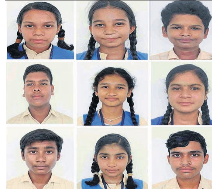
ପାଇକମାଳ, ୧୮୪ (ବଡ଼ ଶତପଥୀ) ସିଦ୍ଧି-ଏସ୍‌ଇ ପରୀକ୍ଷା

ସିଦ୍ଧି-ଏସ୍‌ଇ ପରୀକ୍ଷା ଫଳ ପ୍ରକାଶ ପାଇବା ପରେ ପାଇକମାଳ କୁଳ ଓଡ଼ିଶା ଆଦର୍ଶ ବିଦ୍ୟାଳୟ, ପ୍ରେମନଗରରେ ଖୁସିର ଲହରୀ ଛାଡ଼ି ତିନାଠାରୁ ଅଧିକ ୯୪.୨% ମାର୍କ ରଖି ଚମ୍ପିୟ ହୋଇଛନ୍ତି।