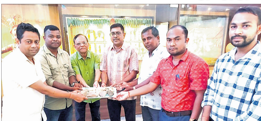
ବୀର ସୁରେନ୍ଦ୍ର ସାଏ ସଂଗ୍ରହାଳୟକୁ ପ୍ରସ୍ତର ମୁଗାୟ ଅସ୍ତ୍ର ଓ ଉପକରଣ ପ୍ରଦାନ କରାଯାଇଛି।