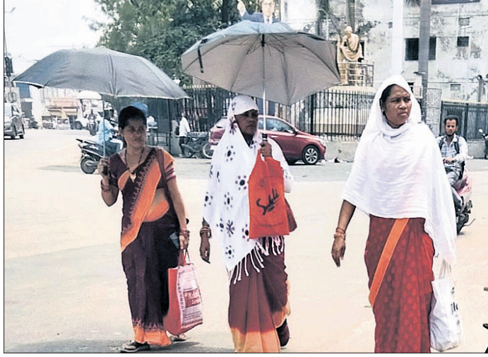
ଛତାର ଆଶ୍ରୟ ନେଇ ବରଗଡ଼ ସହର ମୁଖ୍ୟରାସ୍ତାରେ ଯାଉଛନ୍ତି।

ଗତି ବହୁଛି ଗୁଳୁଗୁଳୁ ବି ହେଉଛି। ସକାଳ ୯ଟାରୁ ଗତିର ପ୍ରକୋପ ବଢ଼ିବାରେ ଲାଗିଛି। ସମସ୍ତା ଖଟା ପର୍ଯ୍ୟନ୍ତ ଲାଗି ରହିଛି। ଏହା ଅସହ୍ୟ ହୋଇ ପହୁଥିବା ଜୀବନ ଦହରାଜ ହୋଇ ପଡ଼ିଛି। ବରଗଡ଼ ଜିଲ୍ଲାରେ ବର୍ତ୍ତମାନ ଏଭଳି ସ୍ଥିତି ପରିଲକ୍ଷିତ ହୋଇଛି। ଅନ୍ୟପଟେ ଆଗଭଳି ପଥଚାରୀଙ୍କ ପର୍ଯ୍ୟାପ୍ତ ଜଳକ୍ଷତ୍ର ନ ଥିବାବେଳେ ରାସ୍ତାକଡ଼ରେ ଆଉ ସେଭଳି ବୁଧରାଜି ନାହିଁ। ଫଳରେ ସହର ସମେତ ବିଭିନ୍ନ ସ୍ଥାନରେ ଲୋକଙ୍କୁ ନାହିଁ ନ ଥିବା ଅସୁବିଧାର ସମ୍ମୁଖୀନ ହେବାକୁ ପଡ଼ିଛି। ଗତିର ପ୍ରକୋପ ଯୋଗୁ ଘରୁ ପଦାକୁ