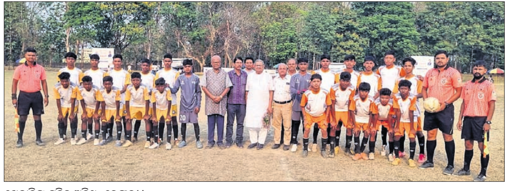
ଝାଡ଼େଶ୍ୱର କ୍ଳବ, ଝାରସୁଗୁଡ଼ା ଏଫ୍.ସି ମ୍ୟାଚ ଡ୍ର

ଝାଡ଼େଶ୍ୱର କ୍ଳବ ପକ୍ଷରୁ ଉଦ୍ଘାଟନୀୟ ଭାବେ ମ୍ୟାଚ ଡ୍ର ହୋଇଛି।