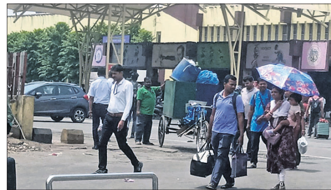
ଖରାରେ ଲୋକେ ଛତା ଧରି ଯାଉଛନ୍ତି।