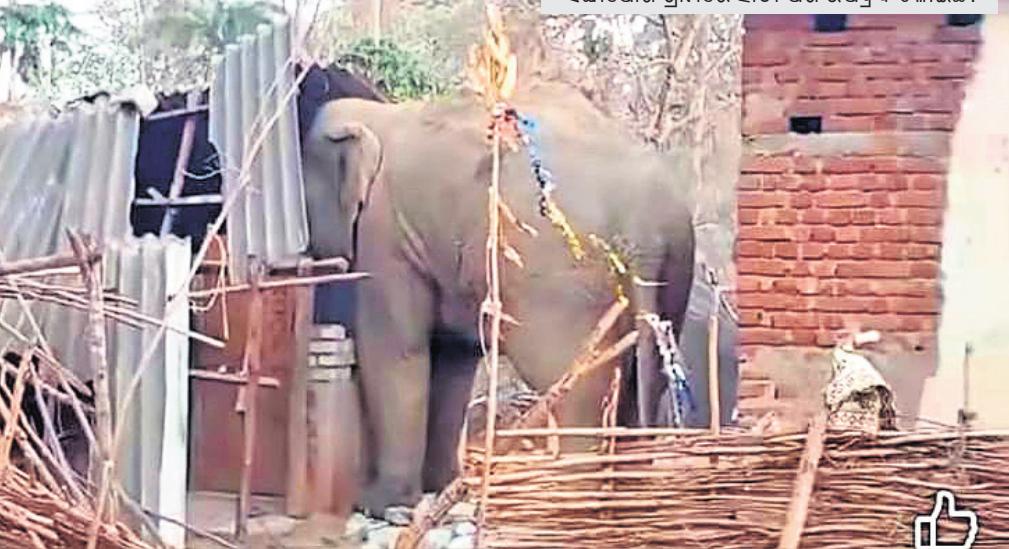
ଘର ଭିତରୁ ଏକ ଚାଉଳ ବସ୍ତା ଟାଣି ଆଣି ଖାଇଦେଇଥିଲା। ତେବେ କିଛି ସମୟ ପରେ ସେଠାରେ ପୂର୍ବରୁ ଉପସ୍ଥିତ ଥିବା ବନ ବିଭାଗ କର୍ମଚାରୀମାନେ ଗ୍ରାମବାସୀଙ୍କ ସହାୟତାରେ ହାତୀକୁ ଜଳାଳୁ ଘରଭଙ୍ଗଭାବେ ସଫଳ ହୋଇଥିଲେ।

ଦେବଗଡ଼ ଜିଲ୍ଲା ରିଆମାଳ ବନାଞ୍ଚଳରେ ହାତୀ ଉପଦ୍ରବ ବେଶୀ ହୋଇଛି।